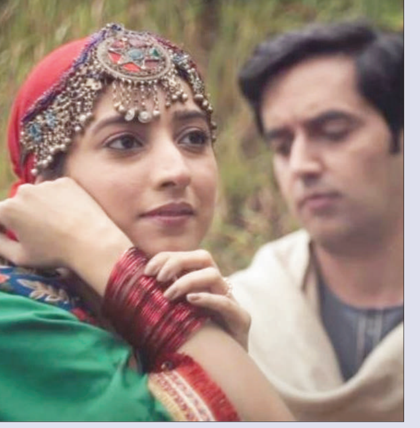
ನೋಡುಗರು ಕೊಟ್ಟಿದ್ದಾರೆ. ಆರ್ಟಿಕಲ್ 370 ಚಿತ್ರದ ಕುರಿತು ಈಗಾಗಲೇ ನಿರೀಕ್ಷೆ ಹೆಚ್ಚಿದೆ. ಅದರಲ್ಲೂ ಟೈಲರ್ ರಿಲೀಸ್ ನಂತರ ಈ ಕಾಯುವಿಕೆ ಇಮ್ಮಡಿಯಾಗಿದೆ.

ಬಾಲಿವುಡ್ ನಲ್ಲಿ ಮತ್ತೊಂದು ಭರವಸೆಯ ಸಿನಿಮಾ ಮೂಡಿ ಬಂದಿದೆ. ಕನ್ನಡತಿ ಪ್ರಿಯಾ ಮಣಿ ಹಾಗೂ ಬಾಲಿವುಡ್ ಹೆಸರಾಂತ ನಟಿ ಯಾಮಿನಿ ಗೌತಮ್ ಕಾಂಬಿನೇಷನ್ ನ 'ಆರ್ಟಿಕಲ್ 370' ಚಿತ್ರದ ಟೈಲರ್ ರಿಲೀಸ್ ಆಗಿದ್ದು, ನೋಡುಗರಿಂದ ಅದ್ಭುತ ಪ್ರತಿಕ್ರಿಯೆ ವ್ಯಕ್ತವಾಗಿದೆ. ಈ ಟೈಲರ್ ನಲ್ಲಿ ಪ್ರಧಾನಿ ನರೇಂದ್ರ ಮೋದಿ ಹಾಗೂ ಕೇಂದ್ರ ಗೃಹ ಸಚಿವ ಅಮಿತ್ ಶಾ ಪಾತ್ರಗಳು ಇವೆ. ರಿಲೀಸ್ ಆದ ಟೈಲರ್‌ನಲ್ಲಿ 'ಪೂರಾ ಕಾ ಪೂರಾ ಕಾಶ್ಮೀರ್, ಭಾರತ್ ದೇಶ್ ಕಾ ಹಿಸ್ಸಾ ಥಾ. ಹೇ ಡಿರ್ ರಹೇಗಾ' ಎನ್ನುವ ಮಾತು ಮತ್ತೆ ಮತ್ತೆ ಪ್ರೇರೇಪಿಸುತ್ತಿದೆ. ಅಂದಹಾಗೆ ಜಮ್ಮು ಕಾಶ್ಮೀರದ ವಿಶೇಷಾಧಿಕಾರವಾದ ಆರ್ಟಿಕಲ್ 370 ಅನ್ನು ತೆಗೆದು ಹಾಕಲಾದ ಕಥಾಹಂದರವನ್ನು ಈ ಸಿನಿಮಾ ಹೊಂದಿದೆ. ಫೆಬ್ರವರಿ 23 ರಂದು ಈ ಸಿನಿಮಾ ತೆರೆಗೆ ಬರಲಿದ್ದು, ಯಾಮಿ ಗೌತಮ್ ಖಡಕ್ ಎಸ್.ಐ.ಎ ಅಧಿಕಾರಿಯಾಗಿ ಕಾಣಿಸಿಕೊಂಡಿದ್ದಾರೆ. ಟೈಲರ್ ನಲ್ಲಿ ಕಾಶ್ಮೀರ ಭಯೋತ್ಪಾದನೆ, ಸೇನಾಧಿಕಾರಿಗಳ ಹೋರಾಟ, ಆರ್ಟಿಕಲ್ 370 ತೆಗೆದರೆ ಏನಿಲ್ಲ ಆಗಲಿದೆ ಎನ್ನುವ ಚರ್ಚೆ. ಭಯೋತ್ಪಾದಕರ ಕುತಂತ್ರ, ಹೀಗೆ ಸಾಕಷ್ಟು ವಿಷಯಗಳನ್ನು 2 ನಿಮಿಷ 40 ಸೆಕೆಂಡ್ ನ ಟೈಲರ್ ನಲ್ಲಿ ತೋರಿಸಲಾಗಿದೆ. ಶಾಶ್ವತ ಸತ್ಯ ದೇವ್ ಅವರ ಹಿನ್ನೆಲೆ ಸಂಗೀತ ಸೂಪರ್. ಕಾಶ್ಮೀರ ಕುರಿತಂತೆ ಈವರೆಗೂ ಬಂದಿರುವ ಯಾವುದೇ ಸಿನಿಮಾ ಸೋತಿಲ್ಲ. ಬಾಕ್ ಅಫೀಸಿನಲ್ಲಿ ಕೋಟಿ ಕೋಟಿ ಹಣ ಬಾಚಿವೆ. ಜೊತೆಗೆ ಅತ್ಯುತ್ತಮ ಪ್ರತಿಕ್ರಿಯೆಯನ್ನೂ