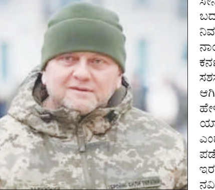
ಸೇನಾ ನಾಯಕತ್ವದಲ್ಲಿ ಇದು ಪ್ರಮುಖ ಬದಲಾವಣೆಯಾಗಿದೆ. ಇಂದಿನಿಂದ ಹೊಸ ನಿರ್ವಹಣಾ ತಂಡವು ಉಕ್ರೇನ್ ಸಶಸ್ತ್ರ ಪಡೆಗಳ ನಾಯಕತ್ವವನ್ನು ವಹಿಸಿಕೊಳ್ಳಲಿದೆ. ನಾನು ಕರ್ನಲ್-ಜನರಲ್ ಸಿರ್ಸಿಯನ್ನು ಉಕ್ರೇನ್ ಆಗಿ ನೇಮಿಸಿದ್ದೇನೆ ಎಂದು ಝೆಲೆನ್ಸ್ಕಿ ಹೇಳಿದ್ದಾರೆ. ಉಕ್ರೇನ್ ಸಶಸ್ತ್ರ ಪಡೆಗಳಿಗೆ ಯಾವ ರೀತಿಯ ನವೀಕರಣದ ಆಗತ್ಯವಿದೆ ಎಂದು ನಾವು ಚರ್ಚಿಸಿದ್ದೇವೆ. ಉಕ್ರೇನ್ ಸಶಸ್ತ್ರ ಪಡೆಗಳ ಹೊಸ ನಾಯಕತ್ವದಲ್ಲಿ ಯಾರು ಇರಬಹುದೆಂದು ನಾವು ಚರ್ಚಿಸಿದ್ದೇವೆ. ಈಗ ನವೀಕರಣದ ಸಮಯ ಬಂದಿದೆ ಎಂದಿದ್ದಾರೆ.

ದೆಹಲಿ: ಕಳೆದ ಸಾಕಷ್ಟು ಸಮಯದಿಂದ ರಷ್ಯಾದಲ್ಲಿ ಯುದ್ಧ ನಡೆಯುತ್ತಿದೆ. ಈ ಯುದ್ಧದ ಮಧ್ಯೆಯೇ ಉಕ್ರೇನ್ ಅಧ್ಯಕ್ಷ ವೊಲೊಡಿಮಿರ್ ಝೆಲೆನ್ಸ್ಕಿ ದೊಡ್ಡ ನಿರ್ಧಾರವನ್ನು ತೆಗೆದುಕೊಂಡಿದ್ದು, ಉಕ್ರೇನ್ ಸೇನಾ ಮುಖ್ಯಸ್ಥ ವ್ಯಾಲೆರಿ ಜಲೂಜ್ನಿ ಅವರನ್ನು ತೆಗೆದುಹಾಕಿದ್ದಾರೆ. ಇದೀಗ ವ್ಯಾಲೆರಿ ಸ್ಕಾನಿಕ್ ಗ್ರೆಂಜ್ ಫೋರ್ಸ್ ಕಮಾಂಡರ್ ಒಲೆಕ್ಸಾಂಡರ್ ಸಿರ್ಸಿಯನ್ನು ನೇಮಿಸಿದ್ದಾರೆ. ಸುಮಾರು ಎರಡು ವರ್ಷಗಳ ಯುದ್ಧದ ನಂತರ ಉಕ್ರೇನ್