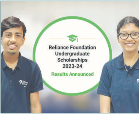
5000 ಮಂದಿಯನ್ನು ವ್ಯವಸ್ಥಿತವಾದ ಮೆರಿಟ್-ಕಮ್-ಆರ್ಥಿಕ ಸ್ಥಿತಿಗತಿಯ ಆಧಾರದ ಮೇಲೆ ಪ್ರಶಸ್ತಿ ನೀಡಲಾಗಿದೆ.

ಮುಂಬೈ: ರಿಲಯನ್ಸ್ ಫೌಂಡೇಷನ್ ನಿಂದ 2023-24ನೇ ಸಾಲಿಗಾಗಿ ದೇಶದಾದ್ಯಂತ ಐದು ಸಾವಿರ ವಿದ್ಯಾರ್ಥಿಗಳನ್ನು ಪದವಿಪೂರ್ವ ವಿದ್ಯಾರ್ಥಿ ವೇತನಕ್ಕಾಗಿ ಆಯ್ಕೆ ಮಾಡಲಾಗಿದೆ. ಇದರಲ್ಲಿ ಕರ್ನಾಟಕದ 469 ವಿದ್ಯಾರ್ಥಿಗಳು ಸಹ ಇದ್ದು, ಈ ವಿದ್ಯಾರ್ಥಿಗಳ ಆಯ್ಕೆಯು ಫಲಿತಾಂಶವನ್ನು ಶುಕ್ರವಾರ ಪ್ರಕಟಿಸಲಾಗಿದೆ. ವಿದ್ಯಾರ್ಥಿ ವೇತನವು ಉನ್ನತ ಶಿಕ್ಷಣಕ್ಕಾಗಿ ಭಾರತದಲ್ಲೇ ಅತಿದೊಡ್ಡ, ಒಳಗೊಳ್ಳುವ ಮತ್ತು ವೈವಿಧ್ಯಮಯ ಉಪಕ್ರಮವಾಗಿದೆ. ಈ ಯೋಜನೆ ಅಡಿಯಲ್ಲಿ ಪದವಿಪೂರ್ವ ವಿದ್ಯಾರ್ಥಿಗಳು ಎರಡು ಲಕ್ಷ ರೂಪಾಯಿ ತನಕ ಅನುದಾನ ಪಡೆಯುತ್ತಾರೆ ಮತ್ತು ಹಳೆಯ ವಿದ್ಯಾರ್ಥಿಗಳ ಅದ್ಭುತ ನೆಟ್ ವರ್ಕ್ ನ ಭಾಗವಾಗುತ್ತಾರೆ. ಭಾರತದ 35 ರಾಜ್ಯಗಳು ಮತ್ತು ಕೇಂದ್ರಾಡಳಿತ ಪ್ರದೇಶಗಳು ಸೇರಿದಂತೆ 5,500ಕ್ಕೂ ಹೆಚ್ಚು ಶಿಕ್ಷಣ ಸಂಸ್ಥೆಗಳಲ್ಲಿ ವ್ಯಾಸಂಗ ಮಾಡುತ್ತಿರುವ 58,000 ವಿದ್ಯಾರ್ಥಿಗಳು ವಿದ್ಯಾರ್ಥಿವೇತನಕ್ಕಾಗಿ ಆರ್ಜಿ ಸಲ್ಲಿಸಿದ್ದರು. ಅಂತಿಮವಾಗಿ