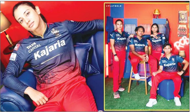
ಅರುಣ್ ಜೇಟ್ಟಿ ಕ್ರೀಡಾಂಗಣದಲ್ಲಿ ನಡೆಯಲಿದೆ. ಎಲ್ಲೆಲ್ಲಿ ಪಂದ್ಯ ನಡೆಯಲಿದೆ?: ಕಳೆದ ವರ್ಷ ಮುಂಬೈನ ಬ್ರೂಯರ್ಸ್ ಮತ್ತು ವಾಂಖೆಡೆ ಕ್ರೀಡಾಂಗಣದಲ್ಲಿ ಪಂದ್ಯಗಳನ್ನು ನಡೆಸಲಾಗುತ್ತಿತ್ತು. ಆದ್ರೆ ಈ ಬಾರಿ ಬೆಂಗಳೂರಿನ ಚಿನ್ನಸ್ವಾಮಿ ಕ್ರೀಡಾಂಗಣ ಹಾಗೂ ದೆಹಲಿಯ ಆರ್‌ಸಿಬಿ ಜೇಟ್ಟಿ ಕ್ರೀಡಾಂಗಣಗಳಲ್ಲಿ ಆಯೋಜಿಸಲಾಗಿದೆ. ಲೀಗ್ ಸುತ್ತಿನ ಬಹುತೇಕ ಪಂದ್ಯಗಳು ಬೆಂಗಳೂರಿನ ಕ್ರೀಡಾಂಗಣದಲ್ಲಿ ನಡೆಯಲಿದೆ. ಡಬ್ಲ್ಯೂ.ಪಿಎಲ್ ನಲ್ಲಿ 5 ಮಹಿಳಾ ತಂಡಗಳು ಇರಲಿದ್ದು, ಅಗ್ರಸ್ಥಾನ