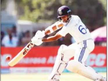
ಸ್ಥಾನದಲ್ಲಿದ್ದಾರೆ. ಈಗಾಗಲೇ 3 ಪಂದ್ಯಗಳಲ್ಲಿ 545 ರನ್ ಗಳಿಸಿರುವ ಯುವ ಅಟಗಾರ ಯಶಸ್ವಿ ಜೈಸ್ವಾಲ್‌ಗೆ ಕೊಫಿ ದಾಖಲೆ ಮುರಿಯಲು ಇನ್ನೂ 147 ರನ್‌ಗಳ ಅಗತ್ಯವಿದೆ. ಸದ್ಯ ಯಶಸ್ವಿ ಜೈಸ್ವಾಲ್ ಇಂಗ್ಲೆಂಡ್ ವಿರುದ್ಧ

ಪಡೆದ ತಂಡ ನೇರವಾಗಿ ಫೈನಲ್‌ಗೆ ಅರ್ಹತೆ ಪಡೆದುಕೊಳ್ಳಲಿದೆ. ಇನ್ನೂ 2 ಮತ್ತು 3ನೇ ಸ್ಥಾನಗಳಲ್ಲಿರುವ ತಂಡಗಳು ಎಲಿಮಿನೇಟರ್ ಪಂದ್ಯದಲ್ಲಿ ಸೇರಲಿದ್ದು, ಗೆದ್ದ ತಂಡ ಫೈನಲ್‌ನಲ್ಲಿ ಸೇರಲಿದೆ. ಚೊಚ್ಚಲ ಆವೃತ್ತಿಯಲ್ಲಿ ಮುಂಬೈ ಚಾಂಪಿಯನ್: 2023ರಲ್ಲಿ ಆರಂಭಗೊಂಡ ಮಹಿಳಾ ಪ್ರೀಮಿಯರ್ ಲೀಗ್ ಚೊಚ್ಚಲ ಆವೃತ್ತಿಯಲ್ಲಿ ಹರ್ಮನ್ ಪ್ರೀತ್ ಕೌರ್ ನಾಯಕತ್ವದ ಮುಂಬೈ ಇಂಡಿಯನ್ಸ್ ತಂಡವು ಚಾಂಪಿಯನ್ ಆಗಿ ಹೊರಹೊಮ್ಮಿತ್ತು.