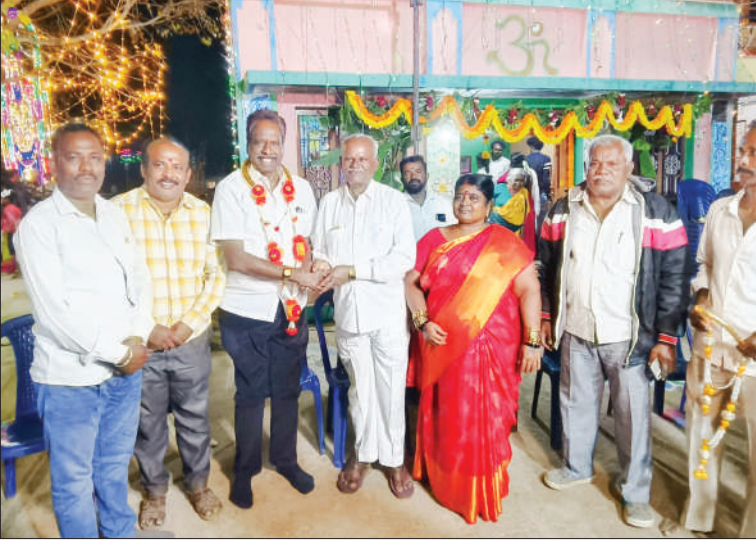
ಬಂಡೂರು ಅಗ್ರಹಾರ ಇಂದು ರಾಜ್ಯದಲ್ಲಿ ತನ್ನದೇ ಆದ ಮಹತ್ವದ ಹೆಸರು ಪಡೆದುಕೊಂಡಿದೆ ಇದು ನನ್ನ ಪರಿಶ್ರಮದ ಭಾಗವಾಗಿದೆ ಈ ಹಿಂದೆ ಇಲ್ಲಿ ನಡೆದಜಾತ್ರಾ ಪ್ರಧಾನಿಗಳಾದ ಎಚ್.ಡಿ.ದೇವೇಗೌಡರು ಬಂದುಅಮ್ಮನ ಪೂಜೆಯಲ್ಲಿ ಪಾಲ್ಗೊಂಡಿದ್ದನ್ನು