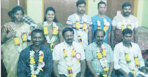
ಹಳಿಯಾರಿನ ಶ್ರೀ ಆರ್ಯವೈಶ್ಯ ಕನ್ನಿಕಾಪರಮೇಶ್ವರಿ ಸಹಕಾರ ಸಂಘದ ಆಡಳಿತ ಮಂಡಳಿಯ ನೂತನ ನಿರ್ದೇಶಕರುಗಳು.

ಒಟ್ಟು 13 ಸ್ಥಾನಗಳ ಪೈಕಿ 4 ಸ್ಥಾನಗಳು ಖಾಲಿ ಇದ್ದು 9 ಸ್ಥಾನಗಳಿಗೆ ಚುನಾವಣೆ ನಡೆದಿದೆ. 9 ನಿರ್ದೇಶಕರುಗಳ ಸ್ಥಾನಕ್ಕೆ 18 ಅಭ್ಯರ್ಥಿಗಳು ಸ್ಪರ್ಧಿಸಿದ್ದರು. 7 ಸಾಮಾನ್ಯ ಸ್ಥಾನಕ್ಕೆ ಒಟ್ಟು 15 ಜನ ಅಭ್ಯರ್ಥಿಗಳು ಸ್ಪರ್ಧಿಸಿದ್ದು, 2 ಮಹಿಳಾ ಮೀಸಲು ಸ್ಥಾನಕ್ಕೆ ಒಟ್ಟು 3 ಮಹಿಳಾ ಅಭ್ಯರ್ಥಿಗಳು ಸ್ಪರ್ಧಿಸಿದ್ದರು.