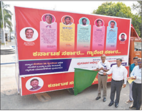
ಹಾಗೂ ಕಲಾತಂಡಗಳಿಂದ ಬೀದಿ ನಾಟಕ ಪ್ರದರ್ಶನ ಮಾಡುವ ಮೂಲಕ ವ್ಯಾಪಕ ಪ್ರಚಾರ ಮಾಡಲಿದೆ. ಈ

ಈ ವೇಳೆ ಅವರು ಮಾತನಾಡಿ ಈ ಕಲಾಜಾಥಾ ಸಂಚಾರಿ ವಾಹನವು ಜಿಲ್ಲೆಯಾದ್ಯಂತ ಮುಂದಿನ 15 ದಿನಗಳ ಕಾಲ 45 ಗ್ರಾಮಗಳಲ್ಲಿ ಸಂಚರಿಸಿ, ಸರ್ಕಾರದ ಯೋಜನೆಗಳ ಮಹತ್ವದ ಬಗ್ಗೆ ಹಾಗೂ ಯೋಜನೆಗಳ ಫಲಾನುಭವಿಗಳ ಬಗ್ಗೆ ಎಲ್.ಇ.ಡಿ ಪರದೆಗಳಲ್ಲಿ ವಿಡಿಯೋ ಬಿತ್ತರಿಸುವ ಮೂಲಕ