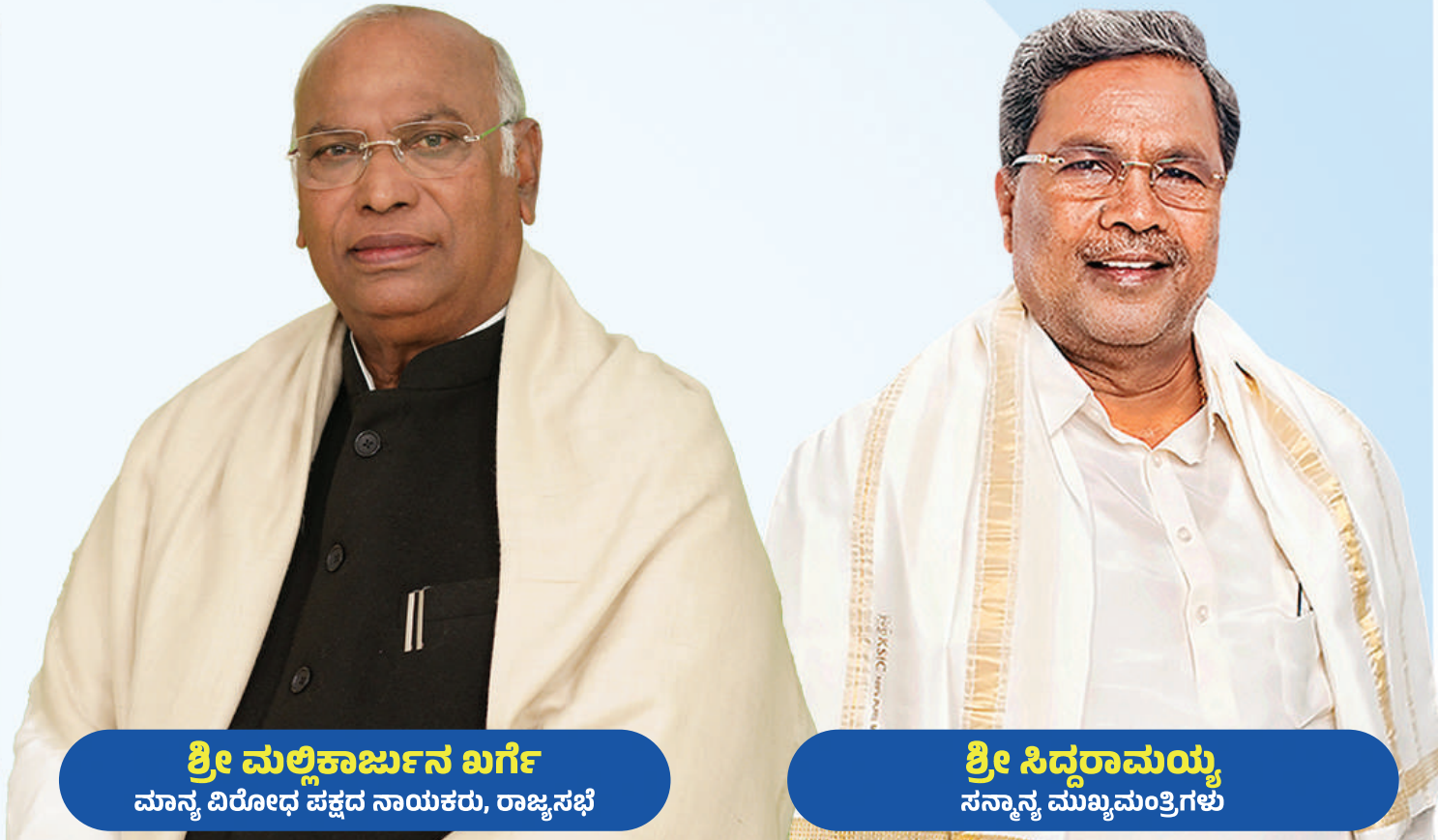
ಶ್ರೀ ಮಲ್ಲಿಕಾರ್ಜುನ ಬರ್ಗೆ ಮಾನ್ಯ ವಿರೋಧ ಪಕ್ಷದ ನಾಯಕರು, ರಾಜ್ಯಸಭೆ

ಸಂಜೆ 5.15 ಗಂಟೆಗೆ ಓಕಲೇಪುರಂ ಸಿಗ್ನಲ್ (ರಾಧಾಕೃಷ್ಣ ಜಂಕ್ಷನ್), ರಾಜಾಜಿನಗರ ಕಡೆಯಿಂದ ಮೆಜಿಸ್ಟಿಕ್ ಮಾರ್ಗದ ಕೆಳಸೇತುವೆಯ ಬಳಿ, ಬೆಂಗಳೂರು.