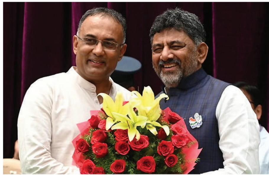
ಶ್ರೀ ಡಿ. ಕೆ. ಶಿವಕುಮಾರ್, ಮಾನ್ಯ ಉಪಮುಖ್ಯಮಂತ್ರಿಗಳು ಹಾಗೂ ಶ್ರೀ ದಿನೇಶ್ ಗುಂಡೂರಾವ್, ಮಾನ್ಯ ಆರೋಗ್ಯ ಸಚಿವರು ಇಲಾಖೆಯ ಸಮಾರಂಭವೊಂದರಲ್ಲಿ ಭಾಗವಹಿಸಿರುವುದು.