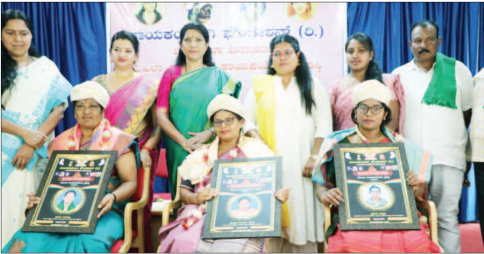
ತಿಳಿಸಿದರು. ಯಾವತ್ತೂ ಹೆಣ್ಣು ಮಗಳೊಬ್ಬಳು ಒಬ್ಬಂಟಿಯಾಗಿ ಮದ್ಯರಾಶಿ ನಿರ್ಭಯವಾಗಿ ನಡೆದುಕೊಂಡು ಹೋದ ದಿನ ಮಹಿಳಾ ದಿನ ಆಚರಣೆಗೆ ಒಂದು ಅರ್ಥ ಬರುತ್ತದೆ. ಕಟ್ಟುಪಾಡುಗಳಿಂದ ಅವಳನ್ನು ಕಟ್ಟಿ ಹಾಕಿದರೆ ಆಚರಣೆಗಳಿಗೆ ಅರ್ಥವಿಲ್ಲ ಎಂದು ಹೇಳಿದರು. ಹೆಣ್ಣು ಮಕ್ಕಳು ಯಾವುದೇ ಸಂದರ್ಭದಲ್ಲೂ ಕುಗ್ಗಬಾರದು. ಜೀವನದಲ್ಲಿ ಸೋತಾಗಲೂ ಧೈರ್ಯದಿಂದ ಮುನ್ನಡೆಯಬೇಕು. ಅವಕಾಶಗಳನ್ನು ಯಾರೂ ಸೃಷ್ಟಿಸಿ ಕೊಡುವುದಿಲ್ಲ. ಯಾವುದೇ ಕ್ಷೇತ್ರದಲ್ಲಿ ಸಾಧಿಸಲು ತಾವೇ

ತಮ್ಮ ಮನೆಯ ಹೆಣ್ಣು ಮಕ್ಕಳಿಗೆ ಸರ್ಕಾರದ ಸವಲತ್ತು ದೊರೆಯುತ್ತಿದ್ದರೂ ಗಂಡಸರು ವೀರೋಧಿಸುತ್ತಾರೆ. ಮನೆಯ ಯಾವಮಾನನಿಗೆ ಮಾಸಿಕ 2 ಸಾವಿರ ರೂ. ಕೊಟ್ಟಿದ್ದರೆ ಬಹುಶಃ ಈ ಹಣ ಲಿಕ್ವಿಡ್ ಶಾಪ್‌ನಲ್ಲಿ ಖರ್ಚು ಮಾಡುತ್ತಿದ್ದರು ಎಂದು