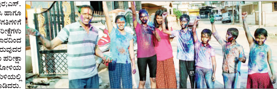
ವಿಜಯಪುರ;ಎಸ್. ಎಸ್.ಎಲ್.ಸಿ ಹಾಗೂ 5,8,9 ತರಗತಿಗಳಿಗೆ ಮೌಲ್ಯಾಂಕ ಪರೀಕ್ಷೆಗಳು ಸೋಮವಾರದಿಂದ ಆರಂಭವಾಗಿರುವುದರ ನಡುವೆಯೂ ಮಕ್ಕಳು ಪರೀಕ್ಷಾ ಭಯವಿಲ್ಲದೆ, ಹೋಳಿಯ ಬಣ್ಣದೋಕಳಿಯಲ್ಲಿ ಆಟವಾಡಿದರು.