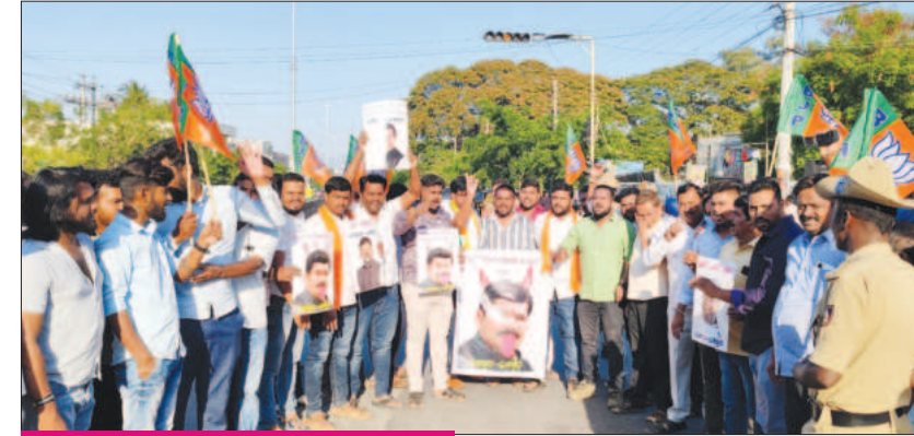
ಹಿಂದುಳಿದ ವರ್ಗಗಳ ನಾಯಕ ಮೋದಿ ಜನಪ್ರಿಯತೆ ಸಹಿಸದ ಕಾಂಗ್ರೆಸ್

ಈ ಕೂಡಲೇ ಸಚಿವ ಶಿವರಾಜ ತಂಗಡಗಿಯಿಂದ ಮುಖ್ಯಮಂತ್ರಿ ಸಿದ್ದರಾಮಯ್ಯ ರಾಜೀನಾಮೆ ಪಡೆದುಕೊಳ್ಳಬೇಕು. ಸಚಿವರು ದೇಶದ ಜನರ ಕ್ಷಮೆ ಯಾಚಿಸಬೇಕು. ಅತ್ಯಂತ ಹಿಂದುಳಿದ