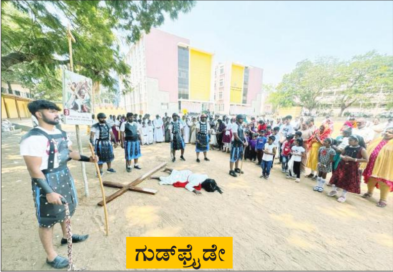
ಮಂಡ್ಯ ನಗರದ ಕಾರ್ಮಲ್ ಕಾನ್ವೆಂಟ್‌ನಲ್ಲಿ ಗುಡ್‌ಫೈಡೇ ದಿನದ ಅಂಗವಾಗಿ ಮನುಕುಲದ ಮಾತೆ ದೇವಾಲಯದ ವತಿಯಿಂದ ಏಸುವಿನ ಶಿಲುಬೆಗೇರಿಸಿದ ನಾಟಕ ಪ್ರದರ್ಶನಲಾಯಿತು. ಈ ಸಂದರ್ಭದಲ್ಲಿ ಶಾಲಾ ಮಂಡಳಿ ಮತ್ತು ಶಿಕ್ಷಕರು ಹಾಗೂ ವಿದ್ಯಾರ್ಥಿಗಳು ಭಾಗವಹಿಸಿದ್ದರು.