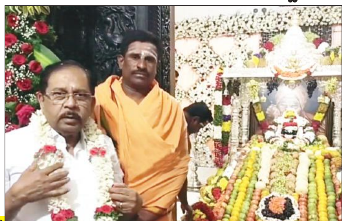
ಡಾ.ಶಿವಕುಮಾರ್ ಸ್ವಾಮೀಜಿ ಅವರ 117ನೇ ಜಯಂತಿ ನಡೆದಿದೆ. ಈ ಸಂದರ್ಭದಲ್ಲಿ ಭಕ್ತಿ ಪೂರ್ವಕವಾಗಿ ನಾನು ನಮನ ಸಲ್ಲಿಸಿದ್ದೇನೆ. ರಾಜ್ಯದ ಎಲ್ಲಾ ಭಾಗದ ಬಂದು ಮಕ್ಕಳು ವಿಶ್ವಾಭ್ಯಾಸ ಮಾಡಿದ್ದಾರೆ. ಲಕ್ಷಾಂತರ ಮಕ್ಕಳು ಜೀವನ ಕಲಿಸಿಕೊಂಡಿದ್ದಾರೆ.

ತುಮಕೂರು: ಇಂದು ತ್ರಿವಿಧ ದಾಸೋಹಿ, ನಡೆದಾಡುವ ದೇವರು ಲಿಂಗೈಕ್ಯ ಶ್ರೀ ಶಿವಕುಮಾರ್ ಶ್ರೀಗಳ 117 ನೇ ಜಯಂತಿ. ಲೋಕಸಭಾ ಚುನಾವಣೆ ನೀತಿ ಸಂಹಿತೆ ಓರ್ವರ ಸಿದ್ಧಗಂಗಾ ಮಠದಲ್ಲಿ ಸರಳವಾಗಿ ಜಯಂತಿ ಆಚರಣೆ ಮಾಡಲಾಗುತ್ತಿದೆ. ಶ್ರೀಗಳ ಗದ್ದುಗೆಗೆ ವಿಶೇಷ ಪೂಜೆ, ಮಹಾಮಂಗಳಾರತಿ ಮಾಡಲಾಗುತ್ತಿದೆ. ಗೃಹ ಸಚಿವ ಡಾ.ಜಿ.ಪರಮೇಶ್ವರ್, ವಿವಿಧ ಮಠಾಧೀಶರು ಹಾಗೂ ಭಕ್ತರು ಭಾಗಿಯಾಗಿದ್ದಾರೆ. ಸಿದ್ಧಗಂಗಾ ಮಠಕ್ಕೆ ಭೇಟಿ ನೀಡಿದ ಸಚಿವ ಡಾ.ಜಿ.ಪರಮೇಶ್ವರ್ ಗದ್ದುಗೆ ದರ್ಶನ ಪಡೆದರು.