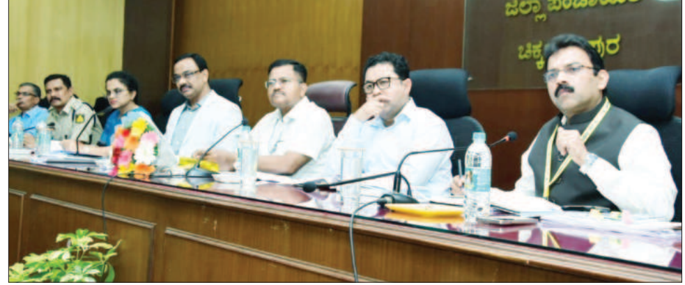
ಎಂದು ಚುನಾವಣಾಧಿಕಾರಿಗಳು ವಿವರಿಸಿದರು.