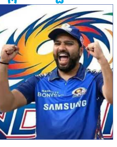
ಎಂಬ ಹೆಗ್ಗಳಿಕೆಗೂ ಪ್ರಾರ್ಥಿಸಿದರು. ಇದಕ್ಕೂ ಮುನ್ನ ಇಂತಹದೊಂದು ಅಪರೂಪದ ದಾಖಲೆಯನ್ನು ವಿರಾಟ್ ಕೊಹ್ಲಿ ಬರೆದಿದ್ದಾರೆ. ಕಿಂಗ್ ಕೊಹ್ಲಿ ಬೆಂಗಳೂರಿನ ಚನ್ನಸ್ವಾಮಿ

ಇಂಡಿಯನ್ ಪ್ರೀಮಿಯರ್ ಲೀಗ್ ನಲ್ಲಿ ಹಿಸ್ ಮ್ಯಾನ್ ಖ್ಯಾತಿಯ ರೋಹಿತ್ ಶರ್ಮಾ ಭರ್ಜರಿ ಪ್ರದರ್ಶನ ನೀಡುತ್ತಿದ್ದಾರೆ. ಈ ಸ್ಕೋಟಿಕ್ ಬ್ಯಾಟಿಂಗ್ ನೊಂದಿಗೆ ಇದೀಗ ಹೊಸ ಇತಿಹಾಸ ನಿರ್ಮಿಸಿದ್ದಾರೆ. ಅದು ಸಹ ತವರು ಮೈದಾನದಲ್ಲಿ ಸಿಕ್ಸರ್ ಗಳ ಸುರಿಮಳೆಗೆ ಯುವ ಮೂಲಕ ಎಂಬುದು ವಿಶೇಷ. ಮುಂಬೈನ ವಾಂಖೆಡೆ ಸ್ಟೇಡಿಯಂನಲ್ಲಿ ನಡೆದ ಐಪಿಎಲ್ ನ 25ನೇ ಪಂದ್ಯದಲ್ಲಿ ಮೊದಲು ಬ್ಯಾಟ್ ಮಾಡಿದ ಆರ್ ಸಿಬಿ 8 ವಿಕೆಟ್ ಕಳೆದುಕೊಂಡು 196 ರನ್ ಕಲೆಹಾಕಿತು.