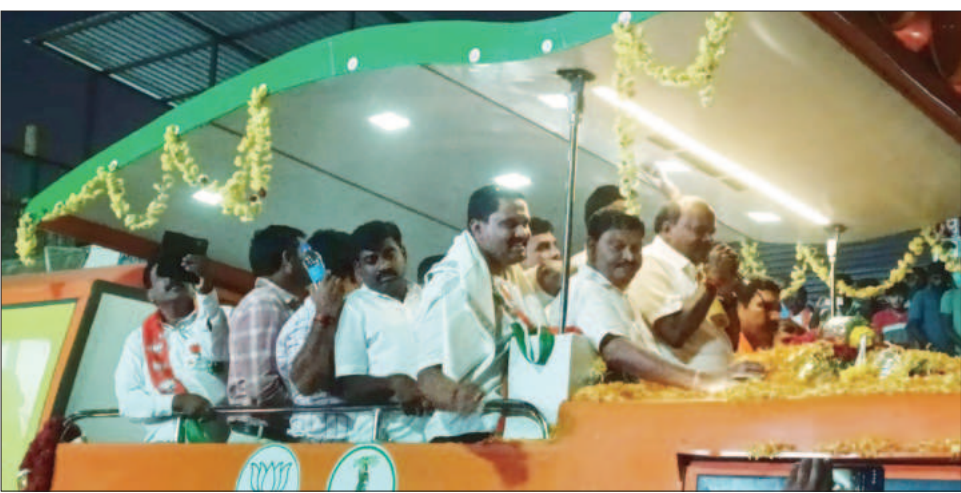
ಜೆಡಿಎಸ್ ಕಾರ್ಯಕರ್ತರು ಗೊಂದಲಕ್ಕೀಡಾಗುವುದು ಬೇಡ ಕಮಲದ ಗುರುತಿಗೆ ಮತ ನೀಡಿ ಎಂದು ತಿಳಿಸಿದರು. ಬಿಜೆಪಿ ರಾಜ್ಯ ಘಟಕದ ಅಧ್ಯಕ್ಷ ಬಿ. ವೈ. ವಿಜಯೇಂದ್ರ ಮಾತನಾಡಿ ಮತ್ತೊಮ್ಮೆ ಮೋದಿ ಪ್ರಧಾನಮಂತ್ರಿ ಯಾಗಬೇಕು,

ಪಿರಿಯಾಪಟ್ಟಣ: ಕಾಂಗ್ರೆಸ್ ಸರ್ಕಾರ ಬಂದಾಗಲೆಲ್ಲ ಬರಗಾಲ ಬರುತ್ತಿದ್ದು, ಕಳೆದ ಏಳು ತಿಂಗಳಿಂದ ವಿವಿಧ ಯೋಜನೆಯ ಫಲಾನುಭವಿಗಳಿಗೆ ಹಣ ಹಾಕದೆ ಇರುವ ಕಾಂಗ್ರೆಸ್ ಸರ್ಕಾರ ಪಿಕ್ ಪಾಕೆಟ್ ಸರ್ಕಾರ ಎಂದು ಮಾಜಿ ಮುಖ್ಯಮಂತ್ರಿ ಎಚ್.ಡಿ. ಕುಮಾರಸ್ವಾಮಿ ಟೀಕಿಸಿದರು. ಪಟ್ಟಣದಲ್ಲಿ ಲೋಕಸಭಾ ಚುನಾವಣೆಗೆ ಸ್ಪರ್ಧಿಸಿರುವ ಬಿಜೆಪಿ ಅಭ್ಯರ್ಥಿ ಯದುವೀರ್ ಕೃಷ್ಣ ದತ್ತ ಚಾಮರಾಜ ಒಡೆಯರ್ ಪರ ಪಟ್ಟಣದ ಬಿ ಎಂ ರಸ್ತೆಯಲ್ಲಿ ಮಂಗಳವಾರ ರೋಡ್ ಶೋ ನಡೆಸಿ ಮತಯಾಚನೆ ಮಾಡಲಾಗಿದೆ. ಮಹಿಳೆಯರಿಗೆ 2,000 ಹಣ ನೀಡುವ ನೆಪದಲ್ಲಿ ಮದ್ಯದ ಬೆಲೆಯನ್ನು ಬೆಲೆಯನ್ನು ಏರಿಕೆ ಮಾಡುವ ಮೂಲಕ ಪಿಕ್ ಪಾಕೆಟ್ ಮಾಡುವ ಕೆಲಸದಲ್ಲಿ ತೊಡಗಿದ್ದಾರೆ ಎಂದು ಟೀಕಿಸಿದರು. ಜನವಿರೋಧಿ ನೀತಿ ಅನುಸರಿಸುತ್ತಿರುವ ಈ ಸರ್ಕಾರಕ್ಕೆ ಪಾಠ ಕಲಿಸುವ ಸಲುವಾಗಿ ಬಿಜೆಪಿ ಅಭ್ಯರ್ಥಿಯನ್ನು ಗೆಲ್ಲಿಸುವ ಕೆಲಸ ಮಾಡಿ ಎಂದು ಕರೆ ನೀಡಿದರು. ಯದುವೀರ್ ಅತ್ಯಂತ ಸಂಭಾವಿತ ವ್ಯಕ್ತಿಯಾಗಿದ್ದು ಮಾದರಿ ಸಂಸದರಾಗಿ ಕೆಲಸ ಮಾಡುವ ಎಲ್ಲಾ ಅರ್ಹತೆ ಹೊಂದಿದ್ದಾರೆ, ಮತಗಟ್ಟೆಯಲ್ಲಿ ನಮ್ಮ ಪಕ್ಷದ ಚಿಹ್ನೆ ಕಾಣುತ್ತಿಲ್ಲವೆಂದು