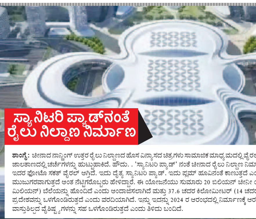
ಸ್ಯಾನಿಟರಿ ಪ್ಲಾಡ್‌ನಂತೆ ರೈಲು ನಿಲ್ದಾಣ ನಿರ್ಮಾಣ