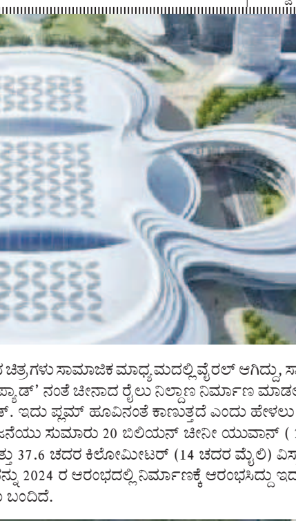
ಸ್ಯಾನಿಟರಿ ಪ್ಲಾಡ್‌ನಂತೆ ರೈಲು ನಿಲ್ದಾಣ ನಿರ್ಮಾಣ

ನವದೆಹಲಿ: ಸೋಲಿಯಲ್ ಮೀಡಿಯಾ ವೇದಿಕೆ ಎಕ್ಸ್ ಮಾಲೀಕ ಖಸ್ರಿಲ್ 21 ರಂದು ಭಾರತಕ್ಕೆ ಭೇಟಿ ನೀಡಲಿದ್ದಾರೆ. ಇದಕ್ಕೂ ಮುನ್ನವೇ ಪಾಕಿಸ್ತಾನ ತನ್ನ ದೇಶದಲ್ಲಿ ಎಕ್ಸ್ ಅನ್ನು ತಾತ್ಕಾಲಿಕವಾಗಿ ಬ್ಯಾನ್ ಮಾಡಿದೆ. ಕಳೆದ ಫೆಬ್ರವರಿಯಿಂದಲೇ ಈ ಬ್ಯಾನ್ ಜಾರಿಗೆ ಬಂದಿದ್ದು, ಈವರೆಗೂ ಅದನ್ನು ತೆಗೆದುಹಾಕಿಲ್ಲ. ಪಾಕಿಸ್ತಾನದ ಆಂತರಿಕ ಸಚಿವಾಲಯವು ಬುಧವಾರ ರಾಷ್ಟ್ರೀಯ ಭದ್ರತಾ ಕಾಳಜಿಗಳ ಮೇಲೆ ಸಾಮಾಜಿಕ ಮಾಧ್ಯಮ ಪ್ಲಾಟ್ಫಾರ್ಮ್ ಎಕ್ಸ್ ಅನ್ನು ತಾತ್ಕಾಲಿಕವಾಗಿ ನಿರ್ಬಂಧಿಸಲು ಆದೇಶಿಸಿದೆ ಎಂದು ಹೇಳಿದೆ. ಭವಿಷ್ಯದಲ್ಲಿ ಪಾಕಿಸ್ತಾನದಲ್ಲಿ ಎಕ್ಸ್ ಶಾಶ್ವತವಾಗಿ ಬ್ಯಾನ್ ಆಗಬಹುದು ಎನ್ನುವ ಆನುಮಾನ ಕೂಡ ವ್ಯಕ್ತವಾಗಿದೆ. ಫೆಬ್ರವರಿ ಮಧ್ಯದಿಂದ ಪಾಕಿಸ್ತಾನದಲ್ಲಿ ಟ್ವಿಟ್ಟರ್ ಎಂದು ಕರೆಯಲ್ಪಡುವ ಎಕ್ಸ್ ಅನ್ನು ಬಳಸುವಲ್ಲಿ ಸಮಸ್ಯೆ ಎದುರಾಗುತ್ತಿದೆ ಎಂದು ಯೂಸರ್‌ಗಳು ವರದಿ ಮಾಡುತ್ತಿದ್ದಾರೆ. ಆದರೆ, ಪಾಕಿಸ್ತಾನ ಮಾತ್ರ ಈ ಕುರಿತಾಗಿ ಯಾವುದೇ ಪ್ರಕಟಣೆಯನ್ನು ಹೊರಡಿಸಿಲ್ಲ. ಆಂತರಿಕ ಸಚಿವಾಲಯವು ಬುಧವಾರದಂದು ಲಿಖಿತ ನ್ಯಾಯಾಲಯದ ಸಲ್ಲಿಕೆಯಲ್ಲಿ ಎಕ್ಸ್ ತಾತ್ಕಾಲಿಕ