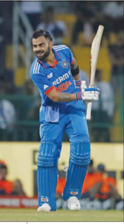
ಯುವ ಭಾರತವು ವಿರಾಟ್ ಕೊಹ್ಲಿ ಮನಸ್ಥಿತಿಯನ್ನು ಹೊಂದಿದೆ