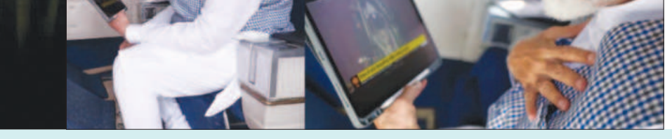
ಲಂಡನ್, ದುಬೈನಲ್ಲಿ ಮನೆ. 5 ಕೋಟಿ ಮೌಲ್ಯದ ಚಿನ್ನ, ಗೋವಾ ಬಿಜೆಪಿ ಅಭ್ಯರ್ಥಿ 1,400 ಕೋಟಿ ಒಡತಿ

ಪಣಜಿ: ದಕ್ಷಿಣ ಗೋವಾದ ಬಿಜೆಪಿ ಮೊದಲ ಮಹಿಳಾ ಅಭ್ಯರ್ಥಿ ಪಲ್ಲವಿ ಡೆಂಪೊ ಮತ್ತು ಅವರ ಪತಿ ಶ್ರೀನಿವಾಸ್ ತಮ್ಮ ಆಸ್ತಿ ವಿವರ ಘೋಷಿಸಿಕೊಂಡಿದ್ದಾರೆ. ಬರೋಬ್ಬರಿ 1,400 ಕೋಟಿ ರೂ. ಆಸ್ತಿ ಒಡತಿಯಾಗಿದ್ದಾರೆ. ಪಲ್ಲವಿ ಅವರು 255.4 ಕೋಟಿ ಮೌಲ್ಯದ ಚರಾಸ್ತಿ ಹೊಂದಿದ್ದರೆ, ಡೆಂಪೋ ಗ್ರೂಪ್ ಅಧ್ಯಕ್ಷರಾಗಿರುವ ಅವರ ಪತಿ ಒಡೆತನದ ಆಸ್ತಿ 994.8 ಕೋಟಿ ರೂ. ಬಿಜೆಪಿ ಲೋಕಸಭಾ ಅಭ್ಯರ್ಥಿಯ ಸ್ವಿರಾಸ್ತಿ ಮೌಲ್ಯ 28.2 ಕೋಟಿ ರೂ. ಇದೆ. ಪಲ್ಲವಿ ಮತ್ತು ಶ್ರೀನಿವಾಸ್ ಡೆಂಪೊ ದಂಪತಿ ದುಬೈನಲ್ಲಿ 2.5 ಕೋಟಿ ರೂಪಾಯಿ ಮೌಲ್ಯದ ಆಸ್ತಿ ಹೊಂದಿದ್ದಾರೆ. ಲಂಡನ್ ನಲ್ಲಿ 10 ಕೋಟಿ ರೂ. ಮಾರುಕಟ್ಟೆ ಮೌಲ್ಯದ ಅಪಾರ್ಟ್‌ಮೆಂಟ್ ಹೊಂದಿದ್ದಾರೆ. ಜೊತೆಗೆ ಗೋವಾ ಮತ್ತು ಭಾರತದ ಇತರ ಸ್ಥಳಗಳಲ್ಲಿ ಆಸ್ತಿ ಹೊಂದಿದ್ದಾರೆ.