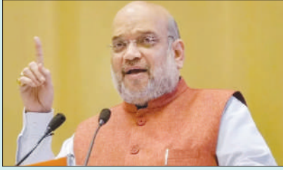
ಹ್ಯಾಂಡಲ್‌ಗಳಲ್ಲಿ ಈ ವಿಡಿಯೋವನ್ನು ಹಂಚಿಕೊಂಡಿದ್ದಾರೆ.

ನಿಕಲಿ ವಿಡಿಯೋವನ್ನು ಕಾಂಗ್ರೆಸ್ ಹರಡುತ್ತಿದೆ ಎಂದು ಅಮಿತ್ ಶಾ, ದೂಷಿಸಿದ್ದಾರೆ. ಇದು ಆ ಪಕ್ಷದ ಹಿತಾಸಕ್ತಿ ಮತ್ತು ನಿರಾಶೆಯ ಫಲಿತಾಂಶವಾಗಿದೆ ಎಂದು ಹೇಳಿದ್ದಾರೆ. ಕೇಂದ್ರ ಗೃಹ ಸಚಿವರ ಈ ತಿರುಚಿದ ವಿಡಿಯೋ ಸಾಮಾಜಿಕ ಜಾಲತಾಣಗಳಲ್ಲಿ ವೈರಲ್ ಆಗಿದೆ. ಬಿಜೆಪಿಯ ಮೀಸಲಾತಿಯನ್ನು ರದ್ದುಗೊಳಿಸಲು ತಯಾರಿ ನಡೆಸುತ್ತಿದೆ ಎಂದು ಹೇಳಿಕೊಂಡು ಹಲವಾರು ಕಾಂಗ್ರೆಸ್ ನಾಯಕರು ತಮ್ಮ ಸಾಮಾಜಿಕ ಮಾಧ್ಯಮ