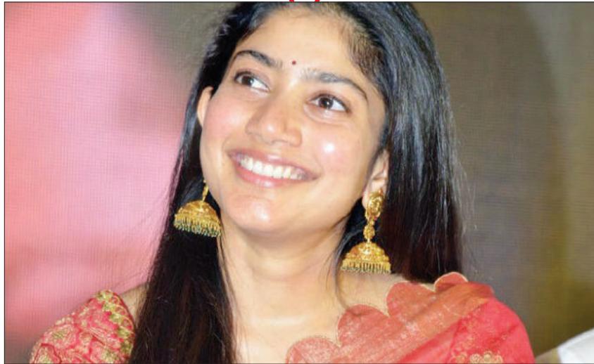
ಅಧಿಕೃತ ಮಾಹಿತಿ ನೀಡಿಲ್ಲ. ಇನ್ನೂ ಆಮೀರ್ ಖಾನ್ ಪುತ್ರನಿಗೆ ನಾಯಕಿಯಾಗಿ ಬಾಲಿವುಡ್‌ಗೆ ಸಾಯಿ ಪಲ್ಲವಿ ಪಾದಾರ್ಪಣೆ ಮಾಡುತ್ತಿದ್ದಾರೆ. ಯಶ್ ಸಹ-ನಿರ್ಮಾಣದ