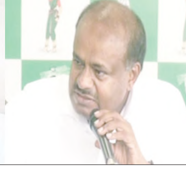
ಪ್ರಾಯೋಜಕರಾಗಿ ನಂದಿನಿಯನ್ನು ಘೋಷಿಸಲು ಸಂಶಯವಾಗುತ್ತಿದೆ” ಎಂದರು.