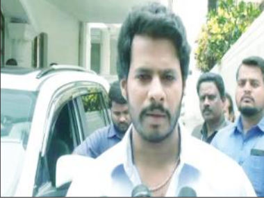
ಹೆಮ್ಮೆಯ ಮಾಜಿ ಪ್ರಧಾನಿಗಳ ವಿರುದ್ಧ ಅವರ ಹೇಳಿಕೆ, ಅವರ ಸಂಸ್ಕೃತಿ, ಮನಸ್ಸುತಿ ಹೇಗಿದೆ ಎನ್ನುವುದನ್ನು ತೋರಿಸುತ್ತದೆ.ರಾಜೀಯ ಮಾಡಿ, ಆದರೆ ಇನ್ನೊಬ್ಬರ ಸಾವನ್ನು ಬಯಸಿ ರಾಜೀಯ ಮಾಡೋದು ಸರಿಯಲ್ಲ ಎಂದಿದ್ದಾರೆ. ಹಾಸನದ ಸಂಸದರ ವಿಡಿಯೋ ರಿಲೀಸ್ ಆದ ಬಳಿಕ ಸಂತ್ರಸ್ತೆಯರ ಮುಖವನ್ನ ಬ್ಲರ್ ಮಾಡಲಿಲ್ಲ. ವಿಡಿಯೋ ಬಿಡುಗಡೆ ಮಾಡಿ ಸಂತ್ರಸ್ತೆಯರ ಮಾನ