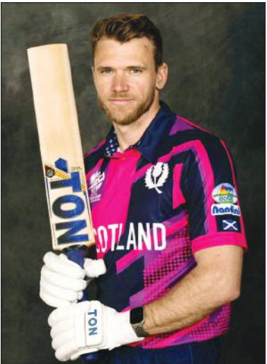
ಪ್ರಾಯೋಜಕರಾಗಿ ನಂದಿನಿಯನ್ನು ಘೋಷಿಸಲು ಸಂಶಯವಾಗುತ್ತಿದೆ” ಎಂದರು.