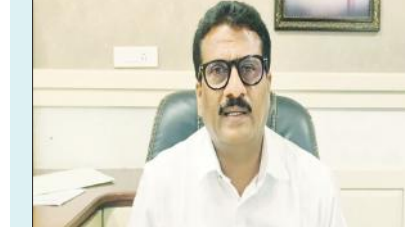
ಪ್ರಾಯೋಜಕರಾಗಿ ನಂದಿನಿಯನ್ನು ಘೋಷಿಸಲು ಸಂಶಯವಾಗುತ್ತಿದೆ” ಎಂದರು.