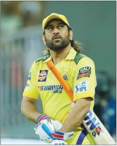
ಐಪಿಎಲ್ ವಿರಾಯ ಪಂದ್ಯವನ್ನು ಆಡಲು ಸಾಧ್ಯವಾಗುತ್ತದೆ ಎಂದು ನಿರೀಕ್ಷಿಸಲಾಗಿತ್ತು. ಆದರೆ, ತನಿಖಾ ಅಂಗಳದಲ್ಲಿ ಆರ್‌ಸಿಬಿ ವಿಜಯಶಾಲಿಯಾಗಿ ಹೊರಹೊಮ್ಮಿದ್ದರಿಂದ ಸಿಎಸ್‌ಕೆ ತಂಡ ಯೋಜನೆಗಳು ತಲೆಕೆಳಗಾಯಿತು.

ಚೆನ್ನೈ: ಹಾಲಿ ಐಪಿಎಲ್ ಟೂರ್ನಿಯ ರಾಯಲ್ ಚಾಲೆಂಜರ್ಸ್ ಬೆಂಗಳೂರು ತಂಡದ ವಿರುದ್ಧದ ಸೋಲಿನ ಬಳಿಕ ಚೆನ್ನೈ ಸೂಪರ್ ಕಿಂಗ್ಸ್ ತಂಡದ ಹಿರಿಯ ಆಟಗಾರ ಮಹೇಂದ್ರ ಸಿಂಗ್ ಧೋನಿ ಐಪಿಎಲ್ ಗೆ ನಿವೃತ್ತಿ ಘೋಷಣೆ ಮಾಡಲಿದ್ದಾರೆ ಎಂದು ಹೇಳಲಾಗಿತ್ತು. ಆದರೆ ಮಾಹಿತಿ ಪಂದ್ಯದ ಬಳಿಕ ಯಾವ ನಿರ್ಧಾರವನ್ನೂ ಮಾಡದೇ ರಾಂಚಿಗೆ ತೆರಳಿದ್ದು, ಈ ಬಗ್ಗೆ ಸಿಎಸ್ ಕೆ ಆಡಳಿತ ಮಂಡಳಿ ಮಹತ್ವದ ಹೇಳಿಕೆ ನೀಡಿದೆ. ಮೇ 18ರ ತನಿಖಾ ಎಂ ಚೆನ್ನೈಸ್ವಾಮಿ ಕ್ರೀಡಾಂಗಣದಲ್ಲಿ ರಾಯಲ್ ಚಾಲೆಂಜರ್ಸ್ ಬೆಂಗಳೂರು (ಆರ್‌ಸಿಬಿ) ವಿರುದ್ಧದ ಸಿಎಸ್‌ಕೆ ತಂಡದ ಅಂತಿಮ ಲೀಗ್ ಪಂದ್ಯದಲ್ಲಿ ರೋಚಕ ಘಟನೆಗಳ ನಂತರ, ಎಂಎಸ್ ಧೋನಿ ನಿವೃತ್ತಿಯನ್ನು ತಾತ್ಕಾಲಿಕವಾಗಿ ಮುಂದೂಡಲಾಗಿದೆ. ಈ ಬಗ್ಗೆ ಮಾಹಿತಿ ನೀಡಿರುವ ಸಿಎಸ್‌ಕೆ ಆಡಳಿತ ಮಂಡಳಿ ಸದ್ಯಕ್ಕಂತೂ ಧೋನಿ ತಮ್ಮ ನಿವೃತ್ತಿ ಬಗ್ಗೆ ತಮ್ಮೊಂದಿಗೆ ಮಾತುಕತೆಯಾಡಿಲ್ಲ. ಎಂಎಸ್ ಧೋನಿ ಅವರು ಸಿಎಸ್‌ಕೆಯಲ್ಲಿ ಯಾರೊಂದಿಗೂ ನಿವೃತ್ತಿ ಹೇಳುವುದಾಗಿ ತಿಳಿಸಿಲ್ಲ. ಅವರು ಅಂತಿಮ ನಿರ್ಧಾರ ತೆಗೆದುಕೊಳ್ಳುವ ಮೊದಲು ಒಂದೆರಡು ತಿಂಗಳು ಕಾಯುವುದಾಗಿ ಜೈನೇಟ್‌ಮಂಚ್‌ಗೆ ತಿಳಿಸಿದ್ದಾರೆ, ಎಂದು ಸಿಎಸ್‌ಕೆ ಮೂಲಗಳು ತಿಳಿಸಿವೆ. ಆರ್ ಸಿಬಿ ವಿರುದ್ಧ ಚೆನ್ನೈ ಗೆದ್ದಿದ್ದರೆ ಅದು ಪ್ಲೇಆಫ್‌ಗೆ ಪ್ರವೇಶ ಪಡೆಯುತ್ತಿತ್ತು. ಚೆನ್ನೈನ ಚೆಚಾಕ್ ಸ್ಟೇಡಿಯಂನಲ್ಲಿ ಪ್ಲೇನಲ್‌ನಲ್ಲಿ ಧೋನಿ