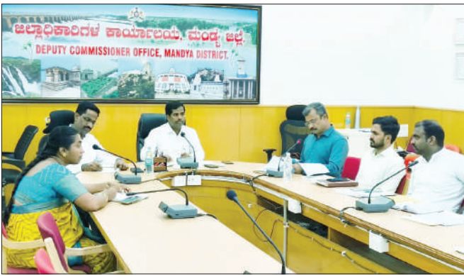
ಕಾರ್ಯ ನಿರ್ವಹಿಸಬೇಕು ಎಂದರು.

ಅಂಚೆ ಮತ ಎಣಿಕೆ ಪ್ರಕ್ರಿಯೆಯಲ್ಲಿ ಒಟ್ಟು 11 ಟೇಬಲ್ ಗಳ ವ್ಯವಸ್ಥೆ ಮಾಡಲಾಗಿದ್ದು, ಪ್ರತಿ ಟೇಬಲ್ ಗೂ ಜಿಲ್ಲಾ ಮಟ್ಟದ ಅಧಿಕಾರಿಗಳನ್ನು ಅಂಚೆ ಮತ ಪತ್ರ ಎಣಿಕೆಯ ಸಹಾಯಕ ಚುನಾವಣಾ ಅಧಿಕಾರಿಗಳನ್ನಾಗಿ ನೇಮಕ ಮಾಡಲಾಗಿದೆ. ಅಂಚೆ ಮತ ಎಣಿಕೆಯು ಬಹಳ ಸೂಕ್ಷ್ಮ ವಾಗಿದ್ದು, ಎಲ್ಲಾ ಮತ ಎಣಿಕೆ ಅಧಿಕಾರಿಗಳು, ಮೇಲ್ವಿಚಾರಕರುಗಳು ಹಾಗೂ ಸಿಬ್ಬಂದಿಗಳು ಗಂಭೀರವಾಗಿ ಪರಿಗಣಿಸಿ ಸಂಪೂರ್ಣ ಜವಾಬ್ದಾರಿಯಿಂದ