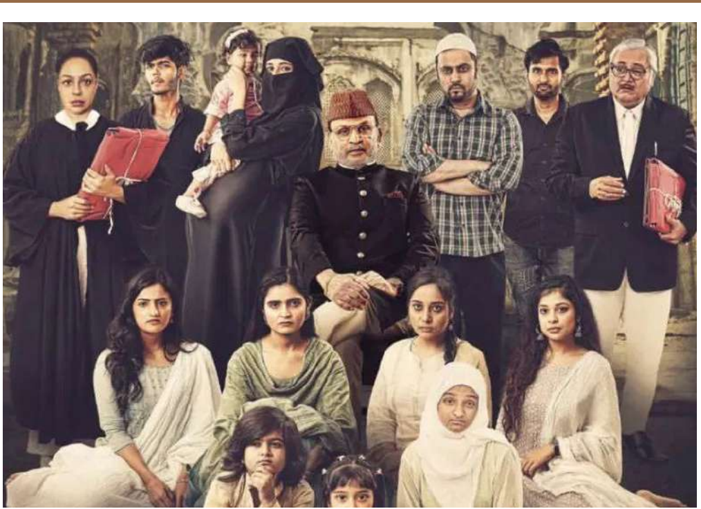
ಶಿವಕಾರ್ತಿಕೇಯನ್, ನಟಿ ಸ್ನೇಹಾ, ವಿಜಯ್ ಸೇತುವತಿ, ಪ್ರಭುದೇವ ಸೇರಿದಂತೆ ಅನೇಕರು ಭಾಗಿಯಾಗಿ ಶುಭಕೋರಿದ್ದರು.