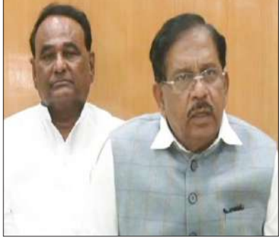
ಅಲ್ಲದೇ ನೀರು ಮತ್ತು ಬಸ್ ಟಿಕೆಟ್ ದರ ಹೆಚ್ಚಳ ಕುರಿತು ಪ್ರತಿಕ್ರಿಯಿಸಿ, ನೀರು ಮತ್ತು ಬಸ್ ಟಿಕೆಟ್

ಬೆಂಗಳೂರು: ಈಗಾಗಲೇ ತೈಲ ದರ ಹೆಚ್ಚಳ ಆದೇಶ ಹೊರಡಿಸಿದ್ದೇವೆ. ದರ ಹೆಚ್ಚಾದ ಬಳಿಕ ಜನರೂ ಕೂಡ ಪೆಟ್ರೋಲ್, ಡೀಸೆಲ್ ಹಾಕಿಸಿಕೊಳ್ಳುತ್ತಾರೆ. ಈಗ ಯಾವುದೇ ಕಾರಣಕ್ಕೂ ದರ ಕಡಿಮೆ ಮಾಡುವ ಪ್ರಶ್ನೆಯೇ ಇಲ್ಲ ಎಂದು ಗೃಹ ಸಚಿವ ಜಿ. ಪರಮೇಶ್ವರ್ ಹೇಳಿದ್ದಾರೆ. ಬೆಂಗಳೂರಿನಲ್ಲಿ ಸುದ್ದಿಗಾರರೊಂದಿಗೆ ಮಾತನಾಡಿದ ಅವರು, ಪೆಟ್ರೋಲ್ ದರ ಇಳಿಸೋರಾ ಎಂಬ ಪ್ರಶ್ನೆ ಉತ್ತರಿಸಿದರು. ಈಗಾಗಲೇ ದರ ಹೆಚ್ಚಳ ಆದೇಶ ಹೊರಡಿಸಿದ್ದೇವೆ. ದರ ಹೆಚ್ಚಾದ ಬಳಿಕ ಜನರೂ ಕೂಡ ಪೆಟ್ರೋಲ್, ಡೀಸೆಲ್ ಹಾಕಿಸಿಕೊಳ್ಳುತ್ತಾರೆ. ನೆರೆಯ ರಾಜ್ಯದವರು ಕಡಿಮೆ ದರ ಇದೆ ಅಂತ ಇಲ್ಲಿಗೆ ಬಂದು ಪೆಟ್ರೋಲ್ ಹಾಕಿಸಿಕೊಳ್ಳುತ್ತಾರೆ. ಈಗ ದರ ಕಡಿಮೆ ಮಾಡುವ ಪ್ರಶ್ನೆಯೇ ಇಲ್ಲ ಎಂದಿದ್ದಾರೆ.