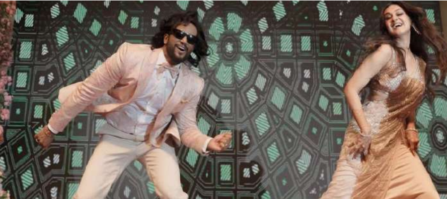
ಆರತಕ್ಕತೆ ಕಾರ್ಯಕ್ರಮ ಚಿನ್ನೆ ನಲ್ಲಿ ಅದ್ಧೂರಿಯಾಗಿ ಮಾಡಲಾಯ್ತು. ಈ ಸಮಾರಂಭದಲ್ಲಿ ಅತ್ತಿನಿ ಪುನೀತ್ ರಾಜ್‌ಕುಮಾರ್, ಉಪೇಂದ್ರ, ರಜನಿಕಾಂತ್,