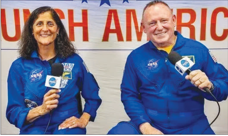
ಹೀಲಿಯಂ ಸೋರಿಕೆ ಹಾಗೂ ಥರ್ಸರ್ ಸಮಸ್ಯೆಗೆ ಸಿಲುಕಿದ್ದ ಸ್ಪಾಲ್ಡರ್‌ನ ಗಗನ ನೌಕೆಯು ಗಗನ