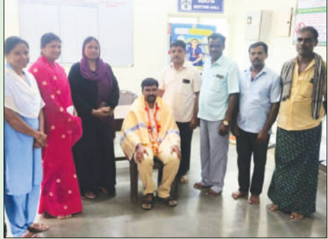
ಸಿದ್ಧರಾಮಯ್ಯರನ್ನು ಸಿಎಂ ಮಾಡಿದ್ದು ಶಾಸಕರು