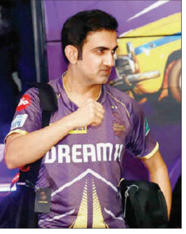
ಪ್ರಾರಂಭಿಸುತ್ತಿರುವ ಗೌತಮ್ ಗಂಭೀರ್ ಅವರಿಗೆ ಬಿಸಿಬಿಬಿ ಸಂಪೂರ್ಣ ಬೆಂಬಲ ನೀಡುತ್ತದೆ ಎಂದು ಜಯ್ ಶಾ ಎಕ್ಸ್‌ನಲ್ಲಿ ತಿಳಿಸಿದ್ದಾರೆ.

ಬಹುದಿನಗಳಿಂದ ಹರಿದಾಡುತ್ತಿದ್ದ ಸುದ್ದಿ ಕೊನೆಗೂ ಖಚಿತವಾಗಿದ್ದು ಟೀಂ ಇಂಡಿಯಾದ ಕೋಚ್ ಆಗಿ ಗೌತಮ್ ಗಂಭೀರ್ ಆಯ್ಕೆಯಾಗಿದ್ದಾರೆ. ಬಿಸಿಬಿಬಿ ಕಾರ್ಯದರ್ಶಿ ಜಯ್ ಶಾ ಅವರು ತಮ್ಮ ಎಕ್ಸ್ ಖಾತೆಯಲ್ಲಿ ಅಧಿಕೃತವಾಗಿ ಈ ವಿಚಾರವನ್ನು ತಿಳಿಸಿದ್ದಾರೆ. ಪುರುಷರ ರಾಷ್ಟ್ರೀಯ ತಂಡದ ಮುಖ್ಯ ಕೋಚ್ ಆಗಿ ಭಾರತದ ಮಾಜಿ ಆರಂಭಿಕ ಆಟಗಾರ ಗೌತಮ್ ಗಂಭೀರ್ ಅವರನ್ನು ನೇಮಿಸಲಾಗಿದೆ ಜಯ್ ಶಾ ಪ್ರಕಟಿಸಿದರು.