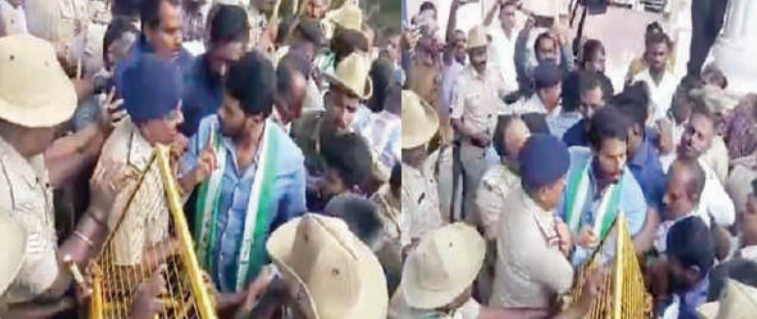
ಕಾರ್ಯಕರ್ತರು ಸಹಕಾರ ಸಂಘಗಳ ನಿಬಂಧಕರ ಕಚೇರಿ ಮುಂದೆ ಪ್ರತಿಭಟನೆ ನಡೆಸಿದ್ದಾರೆ. ಈ ವೇಳೆ ಕಂದಾಯ ಭವನಕ್ಕೆ ಪ್ರತಿಭಟನಾಕಾರರು ಮುತ್ತಿಗೆ ಹಾಕಿದ್ದಾರೆ. ಬಳಿಕ ಸಹಕಾರ ಸಂಘಗಳ ನಿಬಂಧಕರ ಕಚೇರಿಗೆ ಬೀಗ ಜಡಿಯಲು ಯತ್ನಿಸಿದ್ದಾರೆ. ಅಲ್ಲದೇ ಕಂದಾಯ ಭವನದ ಗ್ಯಾಸ್ ಪುಡಿಪುಡಿ ಮಾಡಿದ್ದಾರೆ. ಈ ವೇಳೆ ಪ್ರತಿಭಟನಾಕಾರರನ್ನು ಪೊಲೀಸರು ತಡೆದಿದ್ದು, ಪೊಲೀಸರು ಹಾಗೂ ಪ್ರತಿಭಟನಾಕಾರರ ನಡುವೆ ವಾಗ್ವಾದ ನಡೆದಿದೆ.