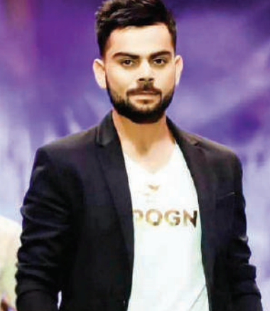
ದೂರುಗಳನ್ನು ನಾವು ಸ್ವೀಕರಿಸಿದ್ದೇವೆ. ಪಬ್ ತೆರೆದಿರುವುದನ್ನು ಗಮನಿಸಲಾಗಿದೆ. ಈ ಅವಧಿ ಮೀರಿ ಗಳು ಮದ್ಯರಾತ್ರಿ 1 ಗಂಟೆಯವರೆಗೆ ಮಾತ್ರ ತೆರೆಯುವಂತಿಲ್ಲ ಎಂದು ಸ್ಪಷ್ಟಪಡಿಸಿದ್ದಾರೆ.