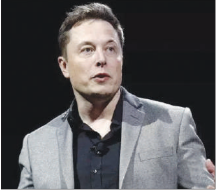
'ಅಪಾಯದ ಕ್ಷಣಗಳು ಮುಂದಿವೆ. ಕಳೆದ 8 ತಿಂಗಳಲ್ಲಿ ಇಬ್ಬರು ವ್ಯಕ್ತಿಗಳು (ಪ್ರತ್ಯೇಕ ಸಂದರ್ಭಗಳಲ್ಲಿ) ನನ್ನನ್ನು ಕೊಲ್ಲಲು ಪ್ರಯತ್ನಿಸಿದ್ದಾರೆ. ಟೆಕ್ನಾಸ್ತರಿರುವ ಟೆಸ್ಲಾ ಕೇಂದ್ರಕಚೇರಿಯ ಸಮೀಪ ಅವರನ್ನು ಗೆರ್ಸೆ ಸಹಿತ

ವಾಷಿಂಗ್ಟನ್: ಕಳೆದ 8 ತಿಂಗಳಲ್ಲಿ ತಾನು ಎರಡು ಹತ್ಯೆಯ ಪ್ರಯತ್ನಗಳನ್ನು ಎದುರಿಸಿರುವುದಾಗಿ ಟೆಸ್ಲಾ ಮಾಲಕ ಎಲಾನ್ ಮಸ್ಕ್ ಹೇಳಿದ್ದು, ಮಾಜಿ ಅಧ್ಯಕ್ಷ ಡೊನಾಲ್ಡ್ ಟ್ರಂಪ್ ಹತ್ಯೆಯ ಯತ್ನವನ್ನು ವಿರೋಧಿಸಿದ್ದಾರೆ. ಹತ್ಯೆ ಪ್ರಯತ್ನದಲ್ಲಿ ಗುಪ್ತಚರ ಸೇವೆಯ ವೈಫಲ್ಯ ಎದುರಿಸಬೇಕಾಗಿದೆ. ಅಧಿಕಾರಿಗಳು ಸಂಪೂರ್ಣ ಅಸಮರ್ಥರಾಗಿದ್ದಾರೆ ಅಥವಾ ಉದ್ದೇಶಪೂರ್ವಕ ವರ್ತನೆ ಇದಾಗಿರಬಹುದು ಎಂದವರು ಟೀಕಿಸಿದ್ದಾರೆ. ಹತ್ಯೆಯ ಪ್ರಯತ್ನದಿಂದ ಪಾರಾದ ರಿಪಬ್ಲಿಕನ್ ಅಧ್ಯಕ್ಷೀಯ ಅಭ್ಯರ್ಥಿ ಡೊನಾಲ್ಡ್ ಟ್ರಂಪ್‌ನನ್ನು ಬೆಂಬಲಿಸುವುದಾಗಿ ಮಸ್ಕ್ ಹೇಳಿದ್ದಾರೆ. ಅವರ ಪ್ರಚಾರ ಕಾರ್ಯಕ್ಕೆ ದೇಶದಾದ್ಯಂತ ಮೂಲಕ ಮುಂದಿನ ಅಧ್ಯಕ್ಷರಾಗಿ ಅವರನ್ನು ಬೆಂಬಲಿಸುವುದಾಗಿ ಮಸ್ಕ್ ಹೇಳಿದ್ದಾರೆ. 2022ರಲ್ಲೂ ತನ್ನ ಹತ್ಯೆಗೆ ಪ್ರಯತ್ನ ನಡೆದಿತ್ತು. ತಾನಿರುವ ಸ್ಥಳದ ಮಾಹಿತಿಯನ್ನು ವರದಿಗಾರರು ಶೇರ್ ಮಾಡಿಕೊಳ್ಳುವ ಮೂಲಕ 'ಹತ್ಯೆ ಸಂಚಿಗೆ ಸಹಕರಿಸುತ್ತಿದ್ದರು. ತನ್ನ ಬಾಸಿಕೆ ವಿಚಾರವನ್ನು ಪ್ರಯೋಗದ ಮಾಹಿತಿಗಳನ್ನು ಪಡೆದಿದ್ದರು' ಎಂದು ಮಸ್ಕ್ ಆರೋಪಿಸಿದ್ದು ಈ ವರದಿಗಾರರ ಬಾತಗಳನ್ನು 'ಎಕ್ಸ್'ನಿಂದ ನಿಷೇಧಿಸಲಾಗಿದೆ ಎಂದಿದ್ದಾರೆ.