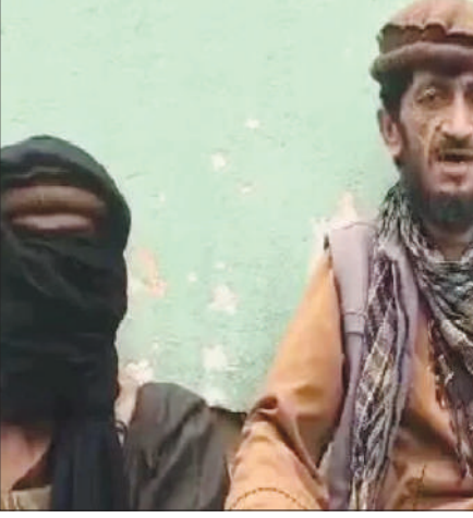
ಎನ್‌ಆರ್‌ಎಫ್ ಕಮಾಂಡರ್ ಎಂದು ವಿವರಿಸುವ ವ್ಯಕ್ತಿಯೊಬ್ಬರು ಟ್ರಂಪ್ ಮೇಲಿನ ದಾಳಿಯ ಜವಾಬ್ದಾರಿಯನ್ನು ತೆಗೆದುಕೊಳ್ಳುವ ಬಗ್ಗೆ ಮಾತನಾಡುತ್ತಿದ್ದಾರೆ. ಇನ್ನೊಬ್ಬ ಮುಖ್ಯವಾಡ್ ಧರಿಸಿದ ವ್ಯಕ್ತಿ ಅವನೊಂದಿಗೆ ಕುಳಿತಿರುವುದನ್ನು ವೀಡಿಯೋದಲ್ಲಿ ಕಾಣಬಹುದು.

ನವದೆಹಲಿ: ಅಮೆರಿಕದ ಮಾಜಿ ಅಧ್ಯಕ್ಷ ಡೊನಾಲ್ಡ್ ಟ್ರಂಪ್ ಮೇಲೆ ಪೆನ್ಸಿಲ್ವೇನಿಯಾದಲ್ಲಿ ದಾಳಿ ನಡೆದಿದೆ. ರಿಪಬ್ಲಿಕನ್ ಪಕ್ಷದ ನಾಯಕ ಮತ್ತು ಅಧ್ಯಕ್ಷೀಯ ಅಭ್ಯರ್ಥಿ ಟ್ರಂಪ್ ಹತ್ಯೆಯ ಉದ್ದೇಶದಿಂದ ನಡೆದ ಈ ದಾಳಿಯಲ್ಲಿ ಗಾಯಗೊಂಡಿದ್ದರು. ಚಿತ್ರಗಳು ಮತ್ತು ವೀಡಿಯೋಗಳಲ್ಲಿ ಅವರ ಕಿವಿಯಿಂದ ರಕ್ತಸ್ರಾವವಾಗುತ್ತಿರುವುದನ್ನು ಕಾಣಬಹುದು. ವಿಶ್ವದ ಅತ್ಯಂತ ಶಕ್ತಿಶಾಲಿ ದೇಶವಾದ ಅಮೆರಿಕದ ಪ್ರಭಾವಿ ನಾಯಕರಲ್ಲಿ ಒಬ್ಬರಾದ ಟ್ರಂಪ್ ಅವರನ್ನು ಹತ್ಯೆ ಮಾಡುವ ಪ್ರಯತ್ನವು ಜಗತ್ತನ್ನು ಬೆಚ್ಚಿಬೀಳಿಸಿದೆ. ಈಗ ಅಫಘಾನಿಸ್ತಾನದ ಭಯೋತ್ಪಾದಕ ಸಂಘಟನೆ ಈ ದಾಳಿಯ ಜವಾಬ್ದಾರಿಯನ್ನು ವಹಿಸಿಕೊಂಡಿದೆ. ತನ್ನನ್ನು ಅಫಘಾನಿ ಭಯೋತ್ಪಾದಕ ಸಂಘಟನೆ ಎನ್‌ಆರ್‌ಎಫ್ (ನ್ಯಾಷನಲ್ ರೆಸಿಸ್ಟೆನ್ಸ್ ಫೋರ್ಸ್) ಕಮಾಂಡರ್ ಎಂದು ವಿವರಿಸುವ ವ್ಯಕ್ತಿ ವೀಡಿಯೋವನ್ನು ಬಿಡುಗಡೆ ಮಾಡಿದ್ದಾನೆ ಮತ್ತು ಟ್ರಂಪ್ ಮೇಲಿನ ದಾಳಿಯ ಜವಾಬ್ದಾರಿಯನ್ನು ವಹಿಸಿಕೊಂಡಿದ್ದಾನೆ. ಅಫಘಾನಿಸ್ತಾನದಲ್ಲಿ ಸಕ್ರಿಯವಾಗಿರುವ ಭಯೋತ್ಪಾದಕ ಸಂಘಟನೆ ಎನ್‌ಆರ್‌ಎಫ್ ಡೊನಾಲ್ಡ್ ಟ್ರಂಪ್ ಮೇಲಿನ ದಾಳಿಯ ಜವಾಬ್ದಾರಿಯನ್ನು ವಹಿಸಿಕೊಂಡಿದೆ. ಇದರ ವೀಡಿಯೋವನ್ನು ಎನ್‌ಆರ್‌ಎಫ್ ಬಿಡುಗಡೆ ಮಾಡಿದ್ದು, ಇದು ಸಾಮಾಜಿಕ ಮಧ್ಯಮದಲ್ಲಿ ವೈರಲ್ ಆಗಿದೆ. ಆದರೆ, ತನ್ನನ್ನು