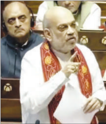
ವೈಫಲ್ಯಗಳನ್ನು ತಿಳಿಸುವ ಬದಲು ಈಗ ಸಂಸತ್ತಿನಲ್ಲಿ ರಾಜಕೀಯ ನಾಟಕವಾಡುತ್ತಿವೆ ಎಂದು ಕಡಿಕಾರಿದರು.

ಒಡಿಶಾ ಮತ್ತು ಗುಜರಾತ್ನೂ ಕೇಂದ್ರ ಸರ್ಕಾರ ಇಂತಹುದೇ ಎಚ್ಚರಿಕೆಗಳನ್ನು ನೀಡಿದ್ದು, ಅದನ್ನು ಗಂಭೀರವಾಗಿ ಪರಿಗಣಿಸಿದ್ದರಿಂದ ಅಲ್ಲಿ ಪರಿಣಾಮಕಾರಿಯಾಗಿ ಅದ್ವೈತ ಜೀವಗಳನ್ನು ಉಳಿಸಲಾಗಿದೆ. ಎಡಪಕ್ಷಗಳು ಮತ್ತು ಕಾಂಗ್ರೆಸ್ ತಮ್ಮ