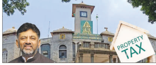
ಎಂದು ತಿಳಿಸಿದರು. 'ಪ್ರಾಮಾಣಿಕವಾಗಿ ತೆರಿಗೆ ಪಾವತಿ ಮಾಡುತ್ತಿರುವವರಿಗೆ ತೊಂದರೆಯಾಗದೆ ರಿಲೀಯಲ್ಲಿ ಕೆಲವು ಬದಲಾವಣೆ ಮಾಡಿಕೊಳ್ಳಲಾಗುವುದು. ಒಂದು ವೇಳೆ ಯಾರಾದರೂ ಹೆಚ್ಚಿಗೆ ಹಣ ಪಾವತಿ ಮಾಡಿದ್ದರೆ, ಮುಂದಿನ ಬಾರಿ ಆಸ್ತಿ ತೆರಿಗೆ ಪಾವತಿ ವೇಳೆ ಅದನ್ನು ವಜಾಗೊಳಿಸಲಾಗುವುದು. ಈ ವಿಚಾರದಲ್ಲಿ ಅನಗತ್ಯವಾಗಿ ಗಾಬರಿಯಾಗುವುದು ಬೇಡ' ಎಂದು ಹೇಳಿದರು. ಬೆಂಗಳೂರು ನಗರಾಭಿವೃದ್ಧಿಯ ಮೇಲೆ ಸುಸ್ಥಿರವಾಗಿರಬೇಕಾದ ಕರ್ನಾಟಕದ ಉಪಮುಖ್ಯಮಂತ್ರಿ ಡಿ.ಕೆ. ಶಿವಕುಮಾರ್ ಅವರು ಮಾಜಿ ಫನಲ್ಲಿ ತೆರಿಗೆ ಸಂಗ್ರಹವನ್ನು ಸುಗಮಗೊಳಿಸಲು ಮತ್ತು ಆದಾಯವನ್ನು ಹೆಚ್ಚಿಸಲು ಹೊಸ ಆಸ್ತಿ ತೆರಿಗೆ ವ್ಯವಸ್ಥೆಯನ್ನು ಪರಿಚಯಿಸಿದ್ದರು. ಎಂದಿಗೂ ತೆರಿಗೆ ಪಾವತಿಸದ ಆಸ್ತಿ ಮಾಲೀಕರಿಗೆ ಒಂದು ಬಾರಿ ಪರಿಹಾರದ ಆಯ್ಕೆಯನ್ನು ಅವರು ಈ ಯೋಜನೆಯ ಅಡಿಯಲ್ಲಿ ಘೋಷಿಸಿದ್ದರು. ಆಸ್ತಿ ಮಾಲೀಕರಿಗೆ ಪರಿಹಾರ ನೀಡಲು ಬೆಂಗಳೂರಿನಲ್ಲಿ ಬಾಕಿ ಉಳಿದಿರುವ ಆಸ್ತಿ ತೆರಿಗೆ ಪಾವತಿ ಎಂಡೋಮೆಂಟ್ ಈ ವರ್ಷ ಏಪ್ರಿಲ್ 30ರಿಂದ ಜುಲೈ 31ರವರೆಗೆ ವಿಸ್ತರಿಸಲಾಗಿತ್ತು. ಜುಲೈ 31 ರೊಳಗೆ ಬಾಕಿ ಪಾವತಿಸಲು ವಿಫಲರಾದವರನ್ನು ಆಗಸ್ಟ್ 1ರಿಂದ ಸುಸ್ಥಿರವಾಗಿಯೇ ಪರಿಗಣಿಸಲಾಗುವುದು ಎಂದು ಉಪ ಮುಖ್ಯಮಂತ್ರಿ ಡಿ.ಕೆ. ಶಿವಕುಮಾರ್ ಹೇಳಿದ್ದರು. ಆದರೆ, ಇದೀಗ ಮತ್ತೊಂದು ತಿಂಗಳು ?ಒನ್ ಟೈಮ್ ಸೆಟ್ಲೆಮೆಂಟ್ ಯೋಜನೆ? ವಿಸ್ತರಿಸಲಾಗಿದೆ.

ಬೆಂಗಳೂರು: ಆಸ್ತಿ ತೆರಿಗೆ ಬಾಕಿ ಉಳಿಸಿಕೊಂಡವರಿಗೆ ಬಿಬಿಎಂಪಿ ಗುಡ್ ನ್ಯೂಸ್ ನೀಡಿದೆ. 'ಒಂದು ಬಾರಿ ಪರಿಹಾರ ಯೋಜನೆ'ಯಡಿ (ಒಟಿಎಸ್) ಆಸ್ತಿ ತೆರಿಗೆಗೆ ಶೇ.5 ರಿಯಾಯಿತಿ ಪಡೆಯಲು ಜುಲೈ 31 ಅಂಚಿಮ ದಿನವಾಗಿತ್ತು. ಆದರೆ, ಇದೀಗ ?ಒನ್ ಟೈಮ್ ಸೆಟ್ಲೆಮೆಂಟ್ ಯೋಜನೆ? ಕಾಲಾವಕಾಶವನ್ನು ಮತ್ತೆ ಒಂದು ತಿಂಗಳ ಕಾಲ ವಿಸ್ತರಣೆ ಮಾಡಲಾಗಿದೆ. ಬಿಬಿಎಂಪಿ ವ್ಯಾಪ್ತಿಯಲ್ಲಿನ ಆಸ್ತಿ ತೆರಿಗೆ ಪಾವತಿಸಲು ಒಂದು ಬಾರಿ ಪರಿಹಾರ ಯೋಜನೆಯನ್ನು(ಒಟಿಎಸ್) ಸರ್ಕಾರ ಜಾರಿಗೆ ತಂದಿತ್ತು. ಈ ಯೋಜನೆಯಿಂದ ಆಸ್ತಿ ತೆರಿಗೆಯ ಬಾಕಿಯ ಮೇಲೆ ಪಾವತಿಸಬೇಕಾದ ಬಡ್ಡಿಯನ್ನು ಸಂಪೂರ್ಣ ಮನ್ನಾ ಮತ್ತು ದಂಡವನ್ನು ಅರ್ಧಕ್ಕೆ ಇಳಿಸಲಾಗಿದೆ. ಒಟಿಎಸ್ ಯೋಜನೆಯಡಿ ದಂಡಗಳ ಮೇಲೆ ಶೇ. 50 ರಿಯಾಯಿತಿ ಮತ್ತು ಆಸ್ತಿ ತೆರಿಗೆ ಡಿಫಾಲ್ಟರ್‌ಗಳಿಗೆ ಬಡ್ಡಿ ಪಾವತಿಗೇ ಮೇಲೆ ಶೇ. 100ರಷ್ಟು ರಿಯಾಯಿತಿ ನೀಡಲಾಗುತ್ತದೆ. ಒಟಿಎಸ್ ಕಾಲಾವಧಿ ಆ. 31ರವರೆಗೆ ವಿಸ್ತರಣೆ: ಡಿಟಿ: ಈ ಬಗ್ಗೆ ಡಿಟಿಎಂ ಹಾಗೂ ಬೆಂಗಳೂರು ನಗರಾಭಿವೃದ್ಧಿ ಸಚಿವ ಡಿ.ಕೆ.ಶಿವಕುಮಾರ್ ಮಾಹಿತಿ ನೀಡಿದ್ದಾರೆ. "ಆಸ್ತಿ ತೆರಿಗೆ ಸುಸ್ಥಿರವಾಗಲು ಜಾರಿಗೆ ತರಲಾಗಿದ್ದ 'ಒಂದು ಬಾರಿ ಪರಿಹಾರ ಯೋಜನೆ' (ಒಟಿಎಸ್)ಯ ಕಾಲಾವಧಿ (ಜುಲೈ 31) ಮುಕ್ತಾಯಗೊಂಡಿರುವ ಹಿನ್ನೆಲೆಯಲ್ಲಿ, ಸಾರ್ವಜನಿಕರ ಒತ್ತಡದ ಮೇರೆಗೆ ಇದನ್ನು ಒಂದು ತಿಂಗಳ ಕಾಲ ಅಂದರೆ ಆಗಸ್ಟ್ 31ರವರೆಗೆ ವಿಸ್ತರಣೆ ಮಾಡಲಾಗಿದೆ" ಎಂದು ತಿಳಿಸಿದ್ದಾರೆ. 11ನೇ ನ್ಯಾನೋ ತಂತ್ರಜ್ಞಾನ ಅಂತಾರಾಷ್ಟ್ರೀಯ ಸಮ್ಮೇಳನ ಕಾರ್ಯಕ್ರಮದ ಬಳಿಕ ಮಾಧ್ಯಮಗಳ ಜೊತೆ ಶುಕ್ರವಾರ ಮಾತನಾಡಿದ ಶಿವಕುಮಾರ್ ಅವರು, "ಈವರೆಗೂ 3 ಸಾವಿರ ಕೋಟಿಯಷ್ಟು ಆಸ್ತಿ ತೆರಿಗೆ ಸಂಗ್ರಹವಾಗಿದ್ದು, ಹೆಚ್ಚುವರಿಯಾಗಿ 400 ಕೋಟಿ ತೆರಿಗೆ ಸಂಗ್ರಹವಾಗಿದೆ. ಕೆಲ ಬದಲಾವಣೆ ಮಾಡಿಕೊಳ್ಳಬೇಕು ಮತ್ತು ಒಟಿಎಸ್ ಕಾಲಾವಧಿ ಒಂದು ತಿಂಗಳು ವಿಸ್ತರಣೆ ಮಾಡಬೇಕು ಎಂದು ಅಧಿಕಾರಿಗಳು ಹಾಗೂ ಸಾರ್ವಜನಿಕರಿಂದ ಒತ್ತಡ ಬರುತ್ತಿದೆ. ಸರ್ವರ್ ಸಮಸ್ಯೆ ಹಾಗೂ ಮತ್ತೆ ಕೆಲವರು ಚೆಕ್ ನೀಡಿದ್ದು ಜುಲೈ 31ರವರೆಗೆ ನೀಡಲಾಗಿದ್ದ ಕಾಲಾವಧಿಯನ್ನು ಒಂದು ತಿಂಗಳ ಕಾಲ ಅಂದರೆ ಆಗಸ್ಟ್ 31ರವರೆಗೆ ವಿಸ್ತರಣೆ ಮಾಡಲಾಗಿದೆ"