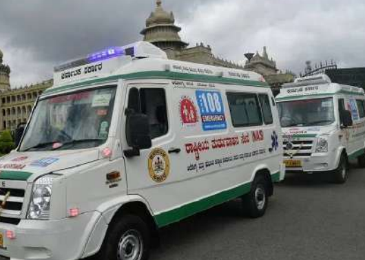
ಮತ್ತು 10,000 ರೂ.ನಂತೆ ಪಾವತಿಯಾಗಿದೆ ಎಂದೂ ಹೇಳಲಾಗಿದೆ. 12 ಗಂಟೆಗಳ ಪಾಳೆಯಲ್ಲಿ ಕೆಲಸ ಮಾಡುವ ಕಾರ್ಯಕರ್ತರು ನಾವು. ಕಾನೂನಿನ ಪ್ರಕಾರ ಕನಿಷ್ಠ 30,000 ರೂ. ವೇತನ ದೊರೆಯಬೇಕಿತ್ತು. ಆದರೆ, ಡಿಸೆಂಬರ್‌ನಿಂದ ನಾವು ಸರಿಯಾಗಿ ವೇತನ ಪಡೆದಿಲ್ಲ. ಬಾಕಿ ಮೊತ್ತವನ್ನೂ ಸ್ವೀಕರಿಸಿಲ್ಲ. ನಾವು ನಮ್ಮ ಕುಟುಂಬಗಳನ್ನು ಸಾಕುವುದು ಹೇಗೆ ಎಂದು ಸುವರ್ಣ ಕರ್ನಾಟಕ ಆರೋಗ್ಯ ಕವಚ ನೌಕರರ ಸಂಘದ ಅಧ್ಯಕ್ಷ ಆರ್ ಶ್ರೀಧರ್ ಅವರು ಹೇಳಿದ್ದಾರೆ.

ಬೆಂಗಳೂರು: ಅಂಬುಲೆನ್ಸ್ ಚಾಲಕರು, '108 ಆರೋಗ್ಯ ಕವಚ ಅಂಬುಲೆನ್ಸ್'ಗಳಲ್ಲಿ ಕಾರ್ಯನಿರ್ವಹಿಸುತ್ತಿರುವ ಚಾಲಕರು ಮತ್ತು ತುರ್ತು ವೈದ್ಯಕೀಯ ತಂತ್ರಜ್ಞರಿಗೆ ಡಿಸೆಂಬರ್‌ನಿಂದ ಪೂರ್ಣ ವೇತನ ದೊರೆಯಲಿಲ್ಲ. ಮೂರು ಯೂನಿಯನ್‌ಗಳ ಸುಮಾರು 3,500 ಉದ್ಯೋಗಿಗಳ ಪರವಾಗಿ ಕರ್ನಾಟಕ ಪ್ರೇಮಿಟ್ ಫ್ ರಿಟ್ ಅರ್ಜಿಯನ್ನು ಸಲ್ಲಿಸಲಾಗಿದೆ. ಇವರೆಲ್ಲ ಇಎಂಆರ್ ಐ ಗ್ರೀನ್ ಹೆಲ್ಪ್ ಸರ್ವಿಸ್ (ಹಿಂದೆ ಜಿವಿಕೆ ಇಎಂಆರ್ ಐ) ಜೊತೆ ಗುತ್ತಿಗೆ ಆಧಾರದಲ್ಲಿ ಕಾರ್ಯನಿರ್ವಹಿಸುತ್ತಿದ್ದಾರೆ. ಮೂರು ಯೂನಿಯನ್‌ಗಳ ಸದಸ್ಯರು ಮೇ 6 ರಿಂದ ಮುಷ್ಕರ ನಡೆಸಲು ಯೋಚಿಸಿದ್ದರು. ಆದರೆ ರಾಜ್ಯ ಆರೋಗ್ಯ ಇಲಾಖೆಯೊಂದಿಗೆ ಚರ್ಚಿಸಿದ ನಂತರ ಮುಷ್ಕರ ಮುಂದೂಡಿದ್ದಾರೆ. ಆಗಿ ಮೂರು ತಿಂಗಳ ನಂತರವೂ ವೇತನ ಪಾವತಿ ಸಮಸ್ಯೆ ಹಾಗೆಯೇ ಉಳಿದಿದೆ. ಅಂಬುಲೆನ್ಸ್ ಚಾಲಕರು ಮತ್ತು ತುರ್ತು ವೈದ್ಯಕೀಯ ತಂತ್ರಜ್ಞರು ತಮ್ಮ ಡಿಸೆಂಬರ್ ಮತ್ತು ಜನವರಿ ತಿಂಗಳ ಸಂಬಳದ ಶೇ 50 ರಷ್ಟನ್ನು ಮೇ ತಿಂಗಳಲ್ಲಿ ಸ್ವೀಕರಿಸಿದ್ದಾರೆ. ಫೆಬ್ರವರಿಯಿಂದ ವೇತನ ದೊರೆಯಲಿಲ್ಲ ಎಂದು ಅವರು ಸಲ್ಲಿಸಿರುವ ಅರ್ಜಿಯಲ್ಲಿ ಉಲ್ಲೇಖಿಸಲಾಗಿದೆ ಎಂದು 'ಡೆಡ್ಲೈನ್ ಹೆಲ್ಪರ್' ವರದಿ ಮಾಡಿದೆ. ಕೆಲವೇ ಕೆಲವು ಸಿಬ್ಬಂದಿಗೆ 5,000