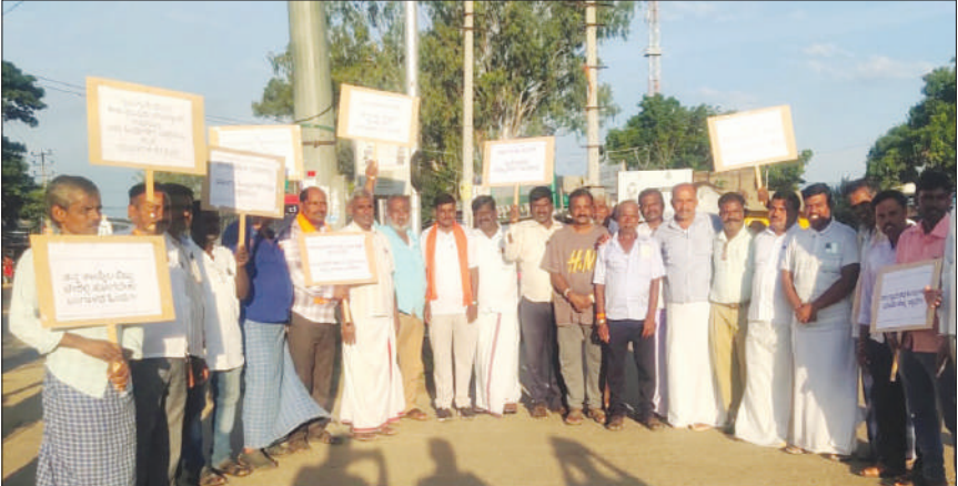
ಇಳಿದಿದ, ಬಾಂಗ್ಲಾದೇಶದಲ್ಲಿ ದೇಶದಲ್ಲಿ ಅಲ್ಪಸಂಖ್ಯಾತ ಹಿಂದೂಗಳನ್ನು ರಕ್ಷಣೆ ಮಾಡುವಲ್ಲಿ ವಿಫಲವಾಗಿದ್ದರೆ ಎಂದು ಆಗ್ರಹ ಮಾಡಿದ್ದಾರೆ.