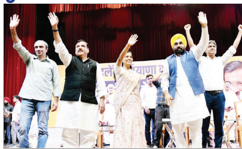
ದೆಹಲಿ ಮುಖ್ಯಮಂತ್ರಿ ಕೇಜ್ರಿವಾಲ್ ಅವರು ಪ್ರಸ್ತುತ ಅಲಾಕಾರಿ ನೀತಿ ಸಂಬಂಧಿತ ಪ್ರಕರಣದಲ್ಲಿ ನ್ಯಾಯಾಂಗ