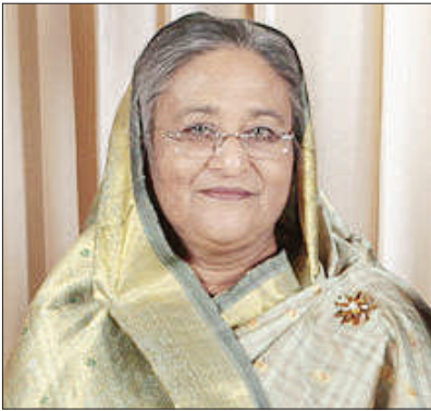
ಅವರ ಹಿತ್ತೈತಿ ಈ ಪ್ರಕರಣವನ್ನು ದಾಖಲಿಸಿದ್ದಾರೆ ಎಂದು ಧಾಕಾ ಟ್ರಿಬ್ಯೂನ್ ಪತ್ರಿಕೆ ವರದಿ ಮಾಡಿದೆ.