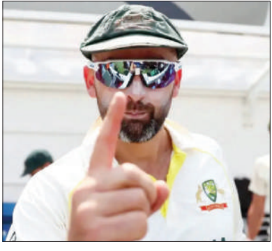
ನಾವು ಭಾರತದ ವಿರುದ್ಧ ಟೆಸ್ಟ್ ಸರಣಿ ಗೆದ್ದು 10 ವರ್ಷಗಳು ಕಳೆದಿವೆ. ಒಂದಾರ್ಥದಲ್ಲಿ ಇದೊಂದು ಅಪೂರ್ಣ ವ್ಯವಹಾರ. ಬಹಳ ವರ್ಷಗಳವರೆಗೆ

ಬೌರ್ಡರ್-ಗವಾಸ್ಕರ್ ಟ್ರೋಫಿಯನ್ನು ನಾವು ಮರಳಿ ಪಡೆಯುತ್ತೇವೆ ಹೀಗಂದಿದ್ದು ಮತ್ಯಾರೂ ಅಲ್ಲ, ಆಸ್ಟ್ರೇಲಿಯಾದ ಸ್ಪಿನ್ನರ್ ನಾಥನ್ ಲಿಯಾನ್. ಕಳೆದ ಒಂದು ದಶಕದಿಂದ ಉಖಿ ಸರಣಿಯಲ್ಲಿ ಟೀಮ್ ಇಂಡಿಯಾ ಪ್ರಾಬಲ್ಯ ಮೆರೆಯುತ್ತಾ ಬಂದಿದೆ. ಅದರ ಈ ಬಾರಿ ನಾವು ಕಪ್ ಗೆದ್ದೇ ಗೆಲ್ಲುತ್ತೇವೆ ಎಂದು ಆಸೀಸ್ ಸ್ಪಿನ್ನರ್ ವಿಶ್ವಾಸ ವ್ಯಕ್ತಪಡಿಸಿದ್ದಾರೆ. ಈ ಬಗ್ಗೆ ಇಎಸ್‌ಪಿಎನ್ ಜೊತೆ ಮಾತನಾಡಿದ ನಾಥನ್ ಲಿಯಾನ್, ಕಳೆದ 10 ವರ್ಷಗಳಲ್ಲಿ ಭಾರತ ತಂಡದ ಬಾಡರ್ಡ್-ಗವಾಸ್ಕರ್ ಟೆಸ್ಟ್ ಸರಣಿಯಲ್ಲಿ ಪ್ರಾಬಲ್ಯ ಸಾಧಿಸಿದೆ. ತವರು ಮತ್ತು ವಿದೇಶದಲ್ಲೂ ಸರಣಿಗಳನ್ನು ಗೆದ್ದಿದೆ. ಇನ್ನು ಕಳೆದ ಎರಡು ಟೆಸ್ಟ್ ಸರಣಿಗಳಲ್ಲಿ ಆಸ್ಟ್ರೇಲಿಯಾ ವಿರುದ್ಧ ಟೀಮ್ ಇಂಡಿಯಾ ಗೆದ್ದಿರುವುದು ಅತೀ ದೊಡ್ಡ ಸಾಧನೆ.