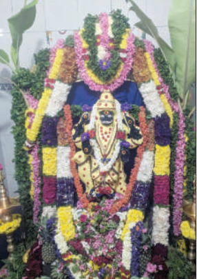
ವಿಜಯಪುರ ಪಟ್ಟಣದ ಸಂತೆ ಮೈದಾನದಲ್ಲಿ ಶನೇಶ್ವರ ಸ್ವಾಮಿ ದೇವಾಲಯದಲ್ಲಿ ನಾಲ್ಕನೇ ಶ್ರಾವಣ ಶನಿವಾರದ ಪ್ರಯುಕ್ತ ಶನೇಶ್ವರ ಸ್ವಾಮಿ ರವರಿಗೆ ವಿಶೇಷ ಬೆಳ್ಳಿ ಅಲಂಕಾರ ವಿಷರ್ಜಿಸಲಾಗಿರುವುದು