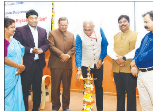
ವಿಭಿನ್ನವಾಗಿ ನಿಲ್ಲುತ್ತಾರೆ. ವಿದ್ಯಾರ್ಥಿಗಳಿಗೆ ಪಾಠ, ಪ್ರವಚನ ಹೇಳಿಕೊಡುವುದರ ಜೊತೆಗೆ ಬದುಕಿನ ವಾಸ್ತವ. ಎದುರಿಸಬೇಕಾದ