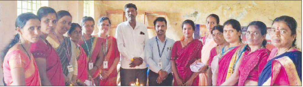
ಹುಳಿಯಾರು ಹೋಬಳಿ ದೊಡ್ಡಬಿದರೆ ಕಾರ್ಯಕ್ಷೇತ್ರದ ಪೋಚೆಟ್ಟಿ ಗ್ರಾಮದ ಧರ್ಮಸ್ಥಳ ಗ್ರಾಮಾಭಿವೃದ್ಧಿ ಯೋಜನೆಯ ಭೂಮಿಕಾ ಜ್ಞಾನ ವಿಕಾಸ ಕೇಂದ್ರ ವಾರ್ಷಿಕೋತ್ಸವ ಕಾರ್ಯಕ್ರಮ ನಡೆಯಿತು.