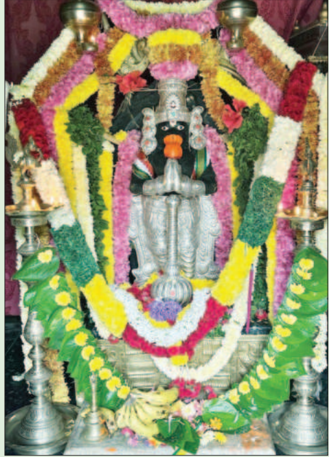
ವಿಜಯಪುರ ಪಟ್ಟಣದ ಶ್ರೀ ಸೋಮೇಶ್ವರ ಸ್ವಾಮಿ ಬಿಬಿ ರಸ್ತೆಯಲ್ಲಿನ ಇತಿಹಾಸ ಪ್ರಸಿದ್ಧ ಅನೇಕಲ್ ಚಿತ್ರದ ಉತ್ತರಾಭಿಮುಖ ಇಷ್ಠಾರ್ಥಸಿದ್ಧಿ ಶ್ರೀ ಅಂಜನೇಯ ಸ್ವಾಮಿರವರಿಗೆ ಭಾವಪೂರ್ವಕ ಶನಿವಾರದ ಪ್ರಯುಕ್ತ ವೆಂಕಟರಮಣ ಸ್ವಾಮಿ ಅಲಂಕಾರ ವಿರ್ಪಾಡಿಸಲಾಗಿರುವುದು.

ಬೆಂಗಳೂರು: ಕನ್ನಡ ಅಭಿವೃದ್ಧಿ ಪ್ರಾಧಿಕಾರದ ಅಧ್ಯಕ್ಷರಾದ ಡಾ. ಪುರುಷೋತ್ತಮ ಬೀಳಮಲೆ ಅವರು 2024 ನೇ ಸೆಪ್ಟೆಂಬರ್ 19 ಮತ್ತು 20 ರಂದು ಮೈಸೂರು ಜಿಲ್ಲೆಯಲ್ಲಿ ಪ್ರವಾಸ ಕೈಗೊಂಡು ಕೇಂದ್ರ ಸ್ಥಾನಕ್ಕೆ ಹಿಂದಿರುಗಿದಿದ್ದಾರೆ ಎಂದು ಕನ್ನಡ ಅಭಿವೃದ್ಧಿ ಪ್ರಾಧಿಕಾರದ ಅಪ್ಪ ಕಾರ್ಯದರ್ಶಿಗಳು ಪ್ರಕಟಣೆಯಲ್ಲಿ ತಿಳಿಸಿದ್ದಾರೆ.