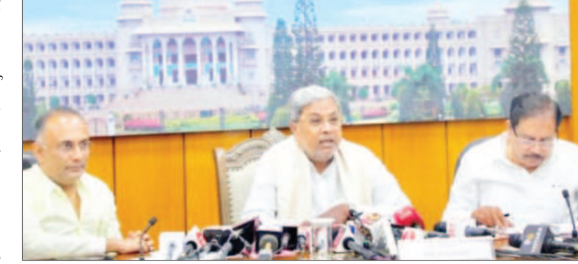
ಮಾಹಿತಿ ಬಂದಿದೆ. ಇದರ ನಿಯಂತ್ರಣಕ್ಕೆ ಕ್ರಮ ತೆಗೆದುಕೊಳ್ಳುವ ಭರವಸೆ ನೀಡಿದರು. ಡ್ರಗ್ಸ್ ದಂಧೆ ಪೊಲೀಸರಿಗೆ ಗೊತ್ತಿಲ್ಲದ ನಡೆಯಲ್ಲ. ಹೀಗಾಗಿ ಇನ್ನು ಮುಂದೆ ಡಿವೈಎಸ್ಸಿ, ಎಸ್ಸಿಪಿ, ಡಿಸಿಪಿ, ಎಸ್ಸಿಗಳಿಗೆ ಜವಾಬ್ದಾರಿ ಫಿಕ್ಸ್ ಮಾಡುವ ನಿರ್ಧಾರ ಮಾಡಿದ್ದೇವೆ. ಡ್ರಗ್ಸ್ ನಿಯಂತ್ರಣಕ್ಕೆ ಹೊಸ ಕಾನೂನು ತರಲು ಮುಂದಾಗಿದ್ದೇವೆ. ಡ್ರಗ್ಸ್ ಆಪರಾಧಕ್ಕೆ ಜಾಮೀನು ಸಿಗದಂತೆ ನಿಯಮ ಮಾಡುತ್ತೇವೆ. ಇದಲ್ಲದೆ ಜಿಲ್ಲಾ ಸಮಿತಿ ಮತ್ತು ರಾಜ್ಯ ಸಮಿತಿ ಕಡ್ಡಾಯವಾಗಿ ಪ್ರತಿ ತಿಂಗಳು ಸಭೆ ಮಾಡುವಂತೆ ಆದೇಶ ಮಾಡುತ್ತೇವೆ ಎಂದು ತಿಳಿಸಿದರು.

ಬೆಂಗಳೂರು: ಕರ್ನಾಟಕದಲ್ಲಿ ಡ್ರಗ್ಸ್ ಹಾವಳಿ ಮಟ್ಟ ಹಾಕಲು ಸರ್ಕಾರ ಟಾಸ್ಕ್ ಫೋರ್ಸ್ ರಚನೆಗೆ ಮುಂದಾಗಿದೆ. ನಿನ್ನೆ ಸಿಎಂ ಸಿದ್ದರಾಮಯ್ಯ ನೇತೃತ್ವದಲ್ಲಿ ಮಾದಕ ವಸ್ತುಗಳ ಹಾವಳಿ ಮತ್ತು ನಿಯಂತ್ರಣ ಕುರಿತು ಸಭೆ ನಡೆಯಿತು. ಸಭೆಯಲ್ಲಿ ಡ್ರಗ್ಸ್ ನಿಯಂತ್ರಣಕ್ಕೆ ಹೊಸ ಕಾನೂನು ತರುವುದು ಮತ್ತು ಡ್ರಗ್ಸ್ ಹಾವಳಿ ತಡೆಗೆ ವಿಶೇಷ ಟಾಸ್ಕ್ ಫೋರ್ಸ್ ರಚನೆ ಮಾಡುವ ನಿರ್ಧಾರ ಮಾಡಲಾಯಿತು. ಸಭೆ ಬಳಿಕ ಸುದ್ದಿಗೋಷ್ಠಿ ನಡೆಸಿ ಮಾತನಾಡಿದ ಸಿದ್ದರಾಮಯ್ಯ, ಕರ್ನಾಟಕದಲ್ಲಿ ಡ್ರಗ್ಸ್ ಹಾವಳಿ ಜಾಸ್ತಿ ಆಗಿದೆ. 50% ಡ್ರಗ್ಸ್ ಹಾವಳಿ ಬೆಂಗಳೂರಿನಲ್ಲೇ ಇದ್ದು, ಮಂಗಳೂರಿನಲ್ಲಿ 22% ಡ್ರಗ್ಸ್ ಹಾವಳಿ ಜಾಸ್ತಿ ಇದೆ. ಡ್ರಗ್ಸ್ ಹಾವಳಿ ತಡೆಯಲು ಮುಖ್ಯ ಕಾರ್ಯದರ್ಶಿಗಳ ನೇತೃತ್ವದಲ್ಲಿ ರಾಜ್ಯಮಟ್ಟದ ಸಮಿತಿ ಮತ್ತು ಜಿಲ್ಲಾ ಮಟ್ಟದಲ್ಲಿ ಡಿ ಸೆಕ್ರೆಟರಿಯಲ್ಲಿ ಸಮಿತಿ ಇದೆ. ಇದನ್ನು ಹೊರತುಪಡಿಸಿ ಮತ್ತಷ್ಟು ಗಂಭೀರ ಪರಮೇಶ್ವರ್ ನೇತೃತ್ವದಲ್ಲಿ ಟಾಸ್ಕ್ ಫೋರ್ಸ್ ರಚನೆ ಮಾಡುತ್ತಿದ್ದೇವೆ ಎಂದು ತಿಳಿಸಿದರು. ಈ ಸಮಿತಿಯಲ್ಲಿ ಶಿಕ್ಷಣ, ಆರೋಗ್ಯ, ಸಮಾಜ ಕಲ್ಯಾಣ ಇಲಾಖೆ ಸೇರಿ ಸಂಬಂಧಪಟ್ಟ ಇಲಾಖೆಗಳ ಸಚಿವರು ಸದಸ್ಯರಾಗಿರುತ್ತಾರೆ. ಬೆಂಗಳೂರು ಪೂರ್ವದಲ್ಲಿ ಡ್ರಗ್ಸ್ ಹಾವಳಿ ಜಾಸ್ತಿ ಇರೋ