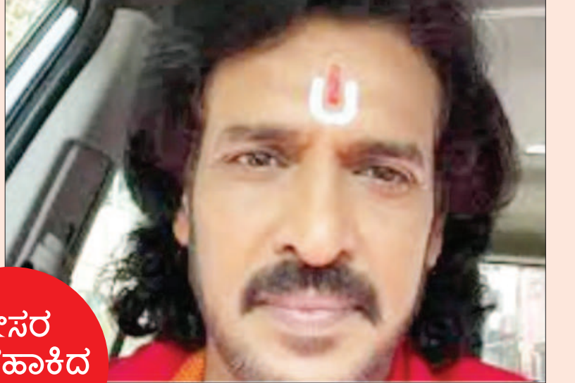
ಬಗ್ಗೆ ಅವರು ಸೋಲಿಯಲ್ ಮೀಡಿಯಾದಲ್ಲಿ ಬರವಣಿಗೆ ಮಾಡಿದ್ದಾರೆ. 'ಈ ರೆಕಾರ್ಡಿಂಗ್ ನಿಂದಾಗಿ ಹಲವು ಜನರ ಎರಡು ತಿಂಗಳ ಶ್ರಮ ವ್ಯರ್ಥವಾಯಿತು. ಈ ರೀತಿಯ ಕೆಲಸ ಮಾಡಬೇಡಿ. ಇದು ಒಳ್ಳೆಯ ಅನುಭವವನ್ನು ನಾಶ ಮಾಡುತ್ತದೆ' ಎಂದಿದ್ದಾರೆ. ಸಾಮಾನ್ಯವಾಗಿ ಸಿನಿಮಾಗಳ ಬಗ್ಗೆ ತಂಡದವರು ಆಪ್ ಡೇಟ್ ಕೊಟ್ಟಾಗ, ತಂಡದ ಕಡೆಯಿಂದ ಪೋಸ್ಟರ್ -ಟೀಸರ್ ರಿಲೀಸ್ ಆದಾಗ ಒಂದು ಕುತೂಹಲ ಇರುತ್ತದೆ. ಆದರೆ, ಈ ರೀತಿ ದೃಶ್ಯ ಲೀಕ್ ಆಗುವುದರಿಂದ ಸಿನಿಮಾ ಬಗ್ಗೆ ಇರುವ ನಿರೀಕ್ಷೆ, ಕುತೂಹಲ ಹೋಗಿ ಬಿಡುತ್ತವೆ. ಆ ರೀತಿ ಆಗಬಾರದು ಎನ್ನುವ ದೃಶ್ಯ ಸೋರಿಕೆ ಆಗದಂತೆ ತಡೆಯಲು ಎಲ್ಲರೂ ಬಯಸುತ್ತಾರೆ.

ಡಿಜಿಟಲ್ ಜಗತ್ತು ವಿಸ್ತಾರವಾಗಿ ಬೆಳೆಯುತ್ತಿದೆ. ಇದರ ಪರಿಣಾಮವಾಗಿ ಹಲವು ಹೀರೋಗಳ ಸಿನಿಮಾಗಳ ಪೋಸ್ಟರ್ ಗಳು ಲೀಕ್ ಆಗುತ್ತಿವೆ. ಈಗ ರಜನಿಕಾಂತ್, ಉಪೇಂದ್ರ, ಅಕ್ಕಿನೇನಿ ನಾಗಾರ್ಜುನ ನಟಿಸುತ್ತಿರುವ 'ಕೂಲಿ' ಸಿನಿಮಾದ ದೃಶ್ಯ ಲೀಕ್ ಆಗಿದೆ. ಈ ಬಗ್ಗೆ ನಿರ್ದೇಶಕ ಲೋಕೇಶ್ ಕನಗರಾಜ್ ಅವರು ಅಸಮಧಾನ ಹೊರಹಾಕಿದ್ದಾರೆ. ಅಲ್ಲದೆ, ಅವರು ಕೈಮುಗಿದು ಒಂದು ಕೋರಿಕೆಯನ್ನು ಮಾಡಿಕೊಂಡಿದ್ದಾರೆ. ರಜನಿಕಾಂತ್ ಅವರು ಸದ್ಯ 'ವೆಟ್ಟೆ'ಯನ್ ಸಿನಿಮಾ ಕೆಲಸಗಳಲ್ಲಿ ಬ್ಯುಸಿ ಇದ್ದಾರೆ. ಈ ಚಿತ್ರದ ಬಗ್ಗೆ ನಿರೀಕ್ಷೆ ಸೃಷ್ಟಿ ಆಗಿದೆ. ರಜನಿಕಾಂತ್, ಅಕ್ಕಿನೇನಿ ನಾಗಾರ್ಜುನ, ಉಪೇಂದ್ರ ಅವರಂಥ ಸ್ಟಾರ್ ಕಲಾವಿದರು ನಟಿಸುತ್ತಿರುವುದರಿಂದ ಸಹಜವಾಗಿಯೇ ಸಿನಿಮಾಗಾಗಿ ಫ್ಯಾನ್ ಕಾಡಿದ್ದಾರೆ. ಈ ಸಿನಿಮಾದ ದೃಶ್ಯವೊಂದು ಸೋರಿಕೆ ಆಗಿದೆ. ನಾಗಾರ್ಜುನ ಅವರು ಶೂಟ್ ನಲ್ಲಿ ಭಾಗಿ ಆದ ದೃಶ್ಯ ಇದಾಗಿದೆ. ನಾಗಾರ್ಜುನ ಅವರು ಆ ಯಕ್ಷ್ಮಣ್ ಅವತಾರದಲ್ಲಿ ಮಿಂಚಿದ್ದಾರೆ. ಇದನ್ನು ಶೂಟ್ ಮಾಡಿದ್ದು ಯಾರು, ಲೀಕ್ ಮಾಡಿದ್ದು ಯಾರು ಎನ್ನುವ ಪ್ರಶ್ನೆ ಮೂಡಿದೆ. ಈ ಘಟನೆ ಲೋಕೇಶ್ ಅವರಿಗೆ ಬೇಸರ ಮೂಡಿಸಿದೆ. ಈ