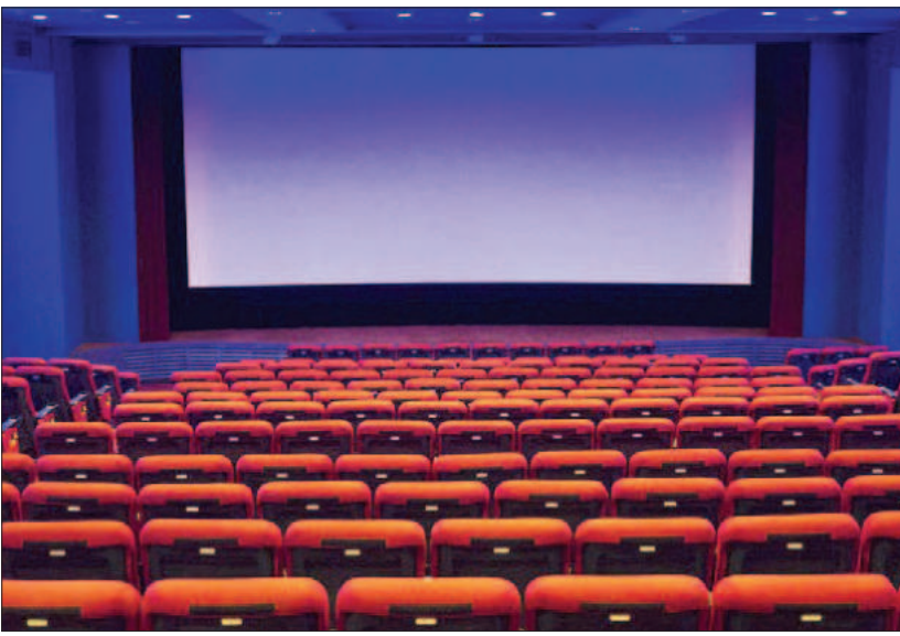
ಸದ್ಯ ಯುದ್ಧ, ಸ್ಟ್ರಿ 2, ಕೃಷ್ಣಂ ಪ್ರಣಯ ಸಖಿ, ಇಬ್ಬನಿ ತಬ್ಬಿದ ಇಳೆಯಲಿ ಸೇರಿದಂತೆ ಹಲವು ಸಿನಿಮಾಗಳು ಥಿಯೇಟರ್‌ನಲ್ಲಿ ಪ್ರಸ್ತುತ ಸದ್ಧ ಮಾಡುತ್ತಿವೆ.

9 ನಿಮಾ ಪ್ರೇಮಿಗಳಿಗೆ ಇದೀಗ ಗುಡ್ ನ್ಯೂಸ್ ಸಿಕ್ಕಿದೆ. ಇದೇ ಸೆ.20ರಂದು ರಾಷ್ಟ್ರೀಯ ಸಿನಿಮಾ ದಿನವಾಗಿದೆ. ಈ ದಿನದಂದು ಸಿನಿಮಾ ನೋಡುವ ಪ್ರೇಕ್ಷಕರಿಗೆ ಕೈಗೆಟುಕುವ ಬೆಲೆಯಲ್ಲಿ ವಿಶೇಷ ರಿಯಾಯಿತಿ ನೀಡಲಾಗಿದೆ. ರಾಷ್ಟ್ರ ವ್ಯಾಪ್ತಿ ಚಿತ್ರಮಂದಿರಗಳಲ್ಲಿ 99 ರೂ.ಗೆ ಟಿಕೆಟ್ ಬೆಲೆ ಇಳಿಕೆ ಮಾಡಲು 'ಮಲ್ಟಿಪ್ಲೆಕ್ಸ್ ಅಸೋಸಿಯೇಷನ್ ಆಫ್ ಇಂಡಿಯಾ' ನಿರ್ಧರಿಸಿದೆ. ಸೆ.20ರಂದು ಪಿಎಲ್, ಸಿನಿಪೋಲೀಸ್, ಮಿರರ್, ಐನಾಕ್, ಸಿಟಿಪ್ರೈಡ್ ಸೇರಿದಂತೆ 4000ಕ್ಕೂ ಹೆಚ್ಚು ಚಿತ್ರಮಂದಿರಗಳು ರಾಷ್ಟ್ರೀಯ ಸಿನಿಮಾ ದಿನವನ್ನು ಆಚರಿಸಲಿದ್ದಾರೆ. ಈ ದಿನದಂದು ದೇಶಾದ್ಯಂತ ಚಲನಚಿತ್ರ ಪ್ರೇಕ್ಷಕರು ಕೇವಲ 99 ರೂ.ಗೆ ಸಿನಿಮಾ ವೀಕ್ಷಿಸುವ ಅವಕಾಶ ನೀಡಲಾಗುತ್ತಿದೆ. ಅದಷ್ಟೇ ಅಲ್ಲ, ಚಿತ್ರಮಂದಿರದಲ್ಲಿನ ಫುಡ್ ಏಜಿಂಗಳ ಮೇಲೆ ಒಂದೂಳೆಯ ಆಫರ್ ಗಳನ್ನು ನೀಡಿ ಮಾಡಿದ್ದಾರೆ. ಇದರ ಕುರಿತು ಚಿತ್ರಮಂದಿರಗಳ ವೈಬ್ರಸೈಟ್‌ನಲ್ಲಿ ಸಂಪೂರ್ಣ ವಿವರ ಸಿಗಲಿದೆ. ಆನ್‌ಲೈನ್‌ನಲ್ಲಿ ಸಿನಿಮಾ ಟಿಕೆಟ್ ಬುಕಿಂಗ್ ಅವಕಾಶ ಕೂಡ ಇದೆ.