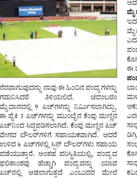
ನೆರವಾಗುವುದನ್ನು ನಾವು ಈ ಹಿಂದಿನ ಪಂದ್ಯಗಳನ್ನು ಗಮನಿಸಿದರೆ ತಿಳಿಯಲಿದೆ. ಚಿದಂಬರಂ ಮೈದಾನದಲ್ಲಿ 9 ಖಿಟ್‌ಗಳನ್ನು ನಿರ್ಮಿಸಲಾಗಿದ್ದು ಈ ಪೈಕಿ 3 ಖಿಟ್‌ಗಳನ್ನು ಮುಂಬೈನ ಕೆಂಪು ಮಣ್ಣಿನ ಖಿಟ್‌ನಿಂದ ಸಿದ್ಧಪಡಿಸಲಾಗಿದೆ. ಕೆಂಪು ಮಣ್ಣಿನ ಖಿಟ್ ವೇಗದ ಬೌಲರ್‌ಗಳಿಗೆ ಸಹಾಯಕವಾಗಿದೆ. ಆದರೆ ಉಳಿದ 6 ಖಿಟ್‌ಗಳಲ್ಲಿ ಸ್ಪಿನ್ ಬೌಲರ್‌ಗಳು ಸಹಾಯ ಪಡೆಯುತ್ತಾರೆ. ಅಂತಹ ಪರಿಸ್ಥಿತಿಯಲ್ಲಿ, ಪಂದ್ಯದ ಫಲಿತಾಂಶವು ಹೆಚ್ಚಾಗಿ ಪಂದ್ಯವನ್ನು ಯಾವ ಖಿಟ್‌ನಲ್ಲಿ ಆಡಲಾಗುತ್ತದೆ ಎಂಬುದರ ಮೇಲೆ

ಕಳೆದ ತಿಂಗಳು ಶ್ರೀಲಂಕಾದಲ್ಲಿ ಏಕದಿನ ಸರಣಿಯನ್ನು ಆಡಿ ಮುಗಿಸಿದ ಬಳಿಕ ಕ್ರಿಕೆಟ್ ನಿಂದ ರಜೆ ತೆಗೆದುಕೊಂಡಿದ್ದ ಟೀಂ ಇಂಡಿಯಾ ಇದೀಗ ತಿಂಗಳುಗಳ ಬಳಿಕ ಟೆಸ್ಟ್ ಸರಣಿಗೆ ಸಜ್ಜಾಗಿದೆ. ಆದರಂತೆ ಬಾಂಗ್ಲಾದೇಶ ವಿರುದ್ಧ 2 ಪಂದ್ಯಗಳ ಟೆಸ್ಟ್ ಸರಣಿಯನ್ನು ಆಡಲಿರುವ ಭಾರತ, ಇಂದಿನಿಂದ ಚೆನ್ನೈನ ಎಂಎ ಚಿದಂಬರಂ ಕ್ರೀಡಾಂಗಣದಲ್ಲಿ ಮೊದಲ ಟೆಸ್ಟ್ ಪಂದ್ಯವನ್ನು ಆಡಲಿದೆ. ಒಂದು ವಾರದಿಂದ ಟೀಂ ಇಂಡಿಯಾ ಆಟಗಾರರು ಚೆನ್ನೈನಲ್ಲಿ ಅಭ್ಯಾಸದಲ್ಲಿ ನಿರತವಾಗಿದ್ದರೆ, ಬಾಂಗ್ಲಾದೇಶ ತಂಡ ಕೂಡ ಚೆನ್ನೈಗೆ ಬಂದಿಳಿದಿದೆ. ಹೀಗಾಗಿ ನಾಳೆಯಿಂದ ಆರಂಭವಾಗಲಿರುವ ಮೊದಲ ಟೆಸ್ಟ್ ಪಂದ್ಯಕ್ಕೆ ವರುಣನ ಅವಕೃಪೆ ಎದುರಾಗಿದೆ. ಇದು ಅಭಿಮಾನಿಗಳಲ್ಲಿ ಆತಂಕ ಮೂಡಿಸಿದೆ. ಇದಲ್ಲದೆ ಚಿದಂಬರಂ ಖಿಟ್ ಯಾರಿಗೆ ಹೆಚ್ಚು ಸಹಕಾರಿಯಾಗಲಿದೆ ಎಂಬುದು ಕೂಡ ಕುತೂಹಲ ಕೆರಳಿಸಿದೆ. ಖಿಟ್ ಯಾರಿಗೆ ಸಹಕಾರಿ? ಚೆನ್ನೈ ಖಿಟ್ ಸಾಮಾನ್ಯವಾಗಿ ಸ್ಪಿನ್ ಬೌಲರ್‌ಗಳಿಗೆ