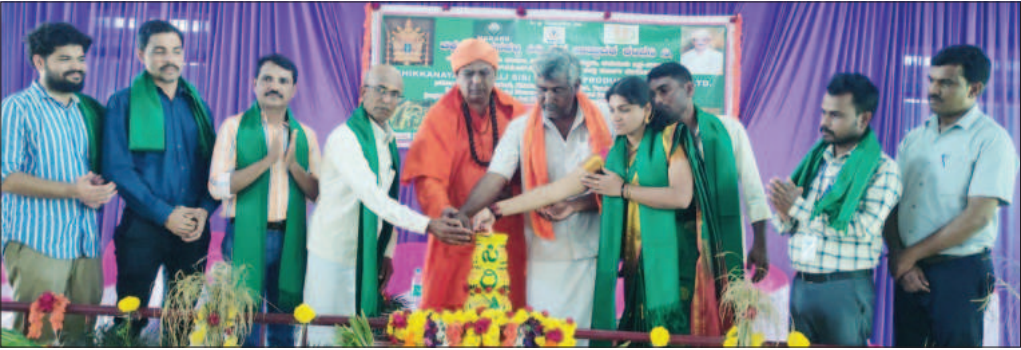
ಸೂಕ್ತಸಲಹೆ ಸೂಚನೆ ನೀಡುವಂತೆ ತಿಳಿಸಿದರು.

ಸಿರಿ ರೈತ ಉತ್ಪಾದಕ ಕಂಪನಿಯಿಂದ ಎಫಫಫಫ ಘಟಕಗಳನ್ನು ರಚಿಸಲಾಗಿದೆ. ಈ ಘಟಕದ ಸದಸ್ಯರು ಪ್ರತಿ ತಿಂಗಳು ಸಭೆ ಸೇರಿ ಕಂಪನಿಯ ಹಣಕಾಸಿನ ಮಹಿವಾಟುವಿನ ಬಗ್ಗೆ ಮಾಹಿತಿ ಪಡೆಯಬಹುದು. ರೈತರು ಬೆಳೆಯುವ ಕೃಷಿ ಉತ್ಪನ್ನಗಳ ಮಾರುಕಟ್ಟೆಯ ಬಗ್ಗೆ ಚರ್ಚಿಸಬಹುದು. ಮೌಲ್ಯವರ್ಧಿತ ಉತ್ಪನ್ನಗಳ ತರಬೇತಿ ಆಗುತ್ತೆಯೆ ಬಗ್ಗೆ ತಿಳಿಸಬಹುದು. ಹೊಸ ನಿರ್ದೇಶಕರ ಆಯ್ಕೆ ಸಂದರ್ಭದಲ್ಲಿ ಕ್ರಿಯಾಶೀಲ ವ್ಯಕ್ತಿಗಳನ್ನು ಆಯ್ಕೆ ಮಾಡಬಹುದು. ಒಟ್ಟಾರೆ ಕಂಪನಿ ಜೊತೆಗೆ ರೈತರೂ ಅರ್ಥಿಕವಾಗಿ ಬೆಳೆಯುವ ನಿಟ್ಟಿನಲ್ಲಿ ಎಲ್ಲರೂ ಮಾಸಿಕ ಸಭೆಯಲ್ಲಿ ಭಾಗವಹಿಸಿ