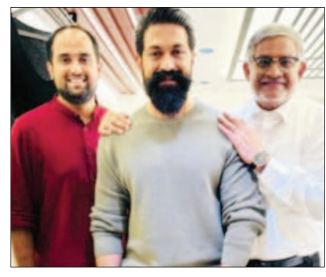
ಎಂದು ಭಾವಿಸಬಹುದಾಗಿದೆ. ಯಾಕಂದ್ರೆ ಕಾರಣವಿಲ್ಲದೆ ಯಶಾ ಯಾರನ್ನೂ ಅಷ್ಟು ಸುಲಭವಾಗಿ ಭೇಟಿಯಾಗಿಲ್ಲ.

ಹೀಗಾಗೇ ಟಾಲಿವುಡ್ ಅಂಗಳದಲ್ಲಿ 'ಟಾಕಿಕ್' ಚಿತ್ರಕ್ಕೆ ಭರಣಿ ಸೇರಿರುವ ಸುದ್ದಿ ವೈರಲ್ ಆಗಿದೆ. ಯಶಾ ಸೇರಿದಂತೆ ಉಳಿದ ನಟ ನಟಿಯರು ಯಾರಲ್ಲೂ ಟಾಕಿಕ್‌ನಲ್ಲಿ ಯಾವುದೇ ಪಾತ್ರ ಮಾಡಾರ ಅನ್ನೋ ವಿಚಾರ ನಿಗೂಢವಾಗೇ ಇದೆ. ಮುಹೂರ್ತದ ವಿಚಾರವನ್ನಷ್ಟೇ ಅಭಿಷಿಯಲ್ ಕನ್ನಡ್ ಮಾಡಿರುವ ಟಾಕಿಕ್ ತಂಡದಿಂದ ಬಳಿಕ ಯಾವುದೇ ಅಭಿಷಿಯಲ್ ಮಾಹಿತಿ ಹೊರಬಿದ್ದಿಲ್ಲ. ಮೊನ್ನೆ ಮೊನ್ನೆಯಷ್ಟೇ ನಯನತಾರಾ ಶೂಟಿಂಗ್ ಸೆಟ್‌ಗೆ ಆಗಮಿಸಿ ತಮ್ಮ ಮೊದಲ ಹಂತದ ಚಿತ್ರೀಕರಣ ಮುಗಿಸಿ ಕೊಟ್ಟ ಮಾಹಿತಿ ಇದೆ. ಇದೀಗ ಟಾಲಿವುಡ್‌ನ ಈ ಬಹುಮುಖ ಪ್ರತಿಭೆ ತನಿಕ್ಕಲ್ಲ ಭರಣಿ ವಿಲನ್ ಪಾತ್ರ ಮಾಡಿದ್ದಾರಾ...? ಪೋಷಕ ಪಾತ್ರ ಮಾಡಿದ್ದಾರಾ? ಅನ್ನೋದನ್ನ ತಿಳಿಯಬೇಕು ಅಂದ್ರೆ ಬಹುಶಃ ಟೀಮ್ ಫೋಷಣ್ ಮಾಡೋವರೆಗೂ ಕಾಯಬೇಕಾಗುತ್ತೆ.