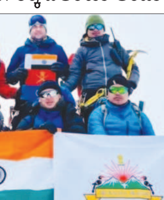
'ಪರ್ವತಾರೋಹಣ ಮತ್ತು ಸಾಹಸ ಕ್ರೀಡೆಗಳ ರಾಷ್ಟ್ರೀಯ ಸಂಸ್ಥೆ'ಯ ತಂಡವು ಈ ಪರ್ವತಕ್ಕೆ

6ನೇ ಲಾಮಾ ತ್ಯಾಂಗ್‌ಗಾಂಗ್ ಗ್ಯಾಟ್ಸೋ ಅವರ ಹೆಸರನ್ನು ನಾಮಕರಣ ಮಾಡಿತ್ತು. 6ನೇ ದಲಾಯಿ ಲಾಮಾ ಅವರ ಕಾಲಾತೀತ ಪಾಂಡಿತ್ಯ ಮತ್ತು ಮೊನ್ನಾ ಸಮುದಾಯಕ್ಕೆ ಹಾಗೂ ಇತರ ಸಮುದಾಯಗಳಿಗೆ ಅವರು ನೀಡಿದ ಕೊಡುಗೆಗೆ ಸಲ್ಲಿಸುವ ಗೌರವವಾಗಿದೆ ಎಂದು ರಕ್ಷಣಾ ಸಚಿವಾಲಯ ಹೇಳಿತ್ತು. ಈ ಬಗ್ಗೆ ಪ್ರತಿಕ್ರಿಯಿಸಿರುವ ಚೀನಾದ ಏದೇಶಾನ್ ಸಚಿವಾಲಯದ ವಕ್ತಾರ ಲಿನ್ ಜಿಯಾನ್ 'ಝುಂಗ್‌ಗಾನ್ ಪ್ರದೇಶ ಚೀನಾದ ಪ್ರದೇಶವಾಗಿದೆ. ಇಲ್ಲಿ ತಥಾಕಥಿತ ಅರುಣಾಚಲ ಪ್ರದೇಶವನ್ನು ಸ್ಥಾಪಿಸುವುದು ಭಾರತದ ಕಾನೂನುಬಾಹಿರ ಕ್ರಮವಾಗಿದ್ದು ಇದು ಅನುಚರವಾಗಿದೆ' ಎಂದಿದ್ದಾರೆ.