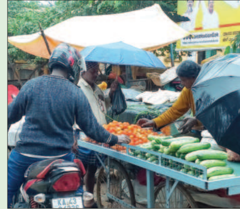
ದೇವನಹಳ್ಳಿ ತಾಲೂಕು ವಿಜಯಪುರ ಪಟ್ಟಣದ ಹಳೆ ಪುರಸಭೆಯ ರಸ್ತೆಯಲ್ಲಿ ಜನಗುಪ್ತಿಯ ಮಳೆಯಲ್ಲಿಯೇ ತರಕಾರಿ ವ್ಯಾಪಾರ ಮಾಡುತ್ತಿರುವ ವ್ಯಕ್ತಿ.

ಚಾಮರಾಜನಗರ: ಹಿಂದುಳಿದ ವರ್ಗಗಳ ಕಲ್ಯಾಣ ಇಲಾಖೆಯಿಂದ ಮೆಟ್ರಿಕ್ ನಂತರದ ಕೋರ್ಸುಗಳಲ್ಲಿ ವ್ಯಾಸಂಗ ಮಾಡುತ್ತಿರುವ ಹಿಂದುಳಿದ ವರ್ಗಗಳ ವಿದ್ಯಾರ್ಥಿಗಳು ಹಾಗೂ ಆಲೆಮಾರಿ, ಆಲೆ ಆಲೆಮಾರಿ ಪ್ರವರ್ಗ ವಿದ್ಯಾರ್ಥಿಗಳಿಂದ ವಿದ್ಯಾರ್ಥಿವೇತನ, ಶುಲ್ಕಮರುಪಾವತಿ, ವಿದ್ಯಾಸಿರಿ (ಉಚಿತ ಮತ್ತು ವಸತಿ ಸಹಾಯ ಯೋಜನೆ) ಸೌಲಭ್ಯಕ್ಕಾಗಿ ಆನ್‌ಲೈನ್ ಮೂಲಕ ಅರ್ಜಿ ಸಲ್ಲಿಸುವ ಅವಧಿಯನ್ನು ಅಕ್ಟೋಬರ್ 31 ರವರೆಗೆ ವಿಸ್ತರಿಸಲಾಗಿದೆ. ಮೆಟ್ರಿಕ್ ನಂತರದ ಹಿಂದುಸ್ಥಿ ಮತ್ತು ಸಮನಾಂತರ, ಸಾಮಾನ್ಯ ಪದವಿ, ಸಂಯೋಜಿತ ಉಭಯ ಪದವಿ ಕೋರ್ಸುಗಳಲ್ಲಿ ವ್ಯಾಸಂಗ ಮಾಡುತ್ತಿರುವ 2024-25ನೇ ಸಾಲಿನ ಮೆಟ್ರಿಕ್ ನಂತರದ ವಿದ್ಯಾರ್ಥಿಗಳು ಸೌಲಭ್ಯಕ್ಕೆ ಆನ್‌ಲೈನ್ ಮೂಲಕ ಮಲ್‌ಸೈಟ್ www.ssp.postmatric.karnataka.gov.in ನಲ್ಲಿ ಅರ್ಜಿ ಸಲ್ಲಿಸಬಹುದು. ಕಾರ್ಯಾಚರಣೆಗಾಗಿ ವಿವರ, ಅರ್ಜಿ ಸಲ್ಲಿಸಬೇಕಾದ ದಾಖಲೆಗಳು ಹಾಗೂ ವಿದ್ಯಾರ್ಥಿವೇತನಕ್ಕೆ ಸಂಬಂಧಿಸಿದ ಸರ್ಕಾರಿ ಆದೇಶಗಳ ಬಗ್ಗೆ ಮಾಹಿತಿಗಾಗಿ ಮಲ್‌ಸೈಟ್ www.bewd.karnataka.gov.in , ಇಲಾಖಾ ಸಹಾಯವಾಣಿ ದೂ.ಸಂ 8050770005, ಇ-ಮೇಲ್ bewdhelpline@gmail.in , ರಾಜ್ಯ ವಿದ್ಯಾರ್ಥಿವೇತನ ತಂತ್ರಾಂಶದ ಸಹಾಯವಾಣಿ ಇ-ಮೇಲ್ postmatrichelp@karnataka.gov.in ಮತ್ತು ದೂ.ಸಂ 1902 ಸಂಪರ್ಕಿಸಬಹುದು. ಅರ್ಜಿ ಸಲ್ಲಿಸಲು ಅಕ್ಟೋಬರ್ 31 ಅಂಚಿವ ದಿನವಾಗಿದೆ. ಹೆಚ್ಚಿನ ಮಾಹಿತಿಗಾಗಿ ನಗರದ ಜಿಲ್ಲಾಡಳಿತ ಭವನದಲ್ಲಿರುವ ಹಿಂದುಳಿದ ವರ್ಗಗಳ ಕಲ್ಯಾಣ ಇಲಾಖೆಯ ದೂ.ಸಂ 08226-222180 ಸಂಪರ್ಕಿಸುವಂತೆ ಇಲಾಖೆಯ ಜಿಲ್ಲಾ ಅಧಿಕಾರಿ ಪ್ರಕಟಣೆಯಲ್ಲಿ ತಿಳಿಸಿದ್ದಾರೆ.