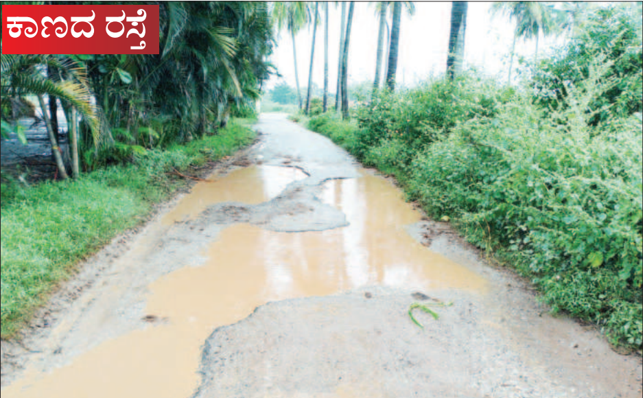
ವಿಜಯಪುರ ಪಟ್ಟಣದ ವಿಜಯ ಪುರ ಹೋಬಳಿಯ ಗಡ್ಡನಾಯಕನಹಳ್ಳಿ ರಸ್ತೆಯಲ್ಲಿ ಕಳೆದ ಎರಡು ದಿನಗಳಿಂದ ಬೀಳುತ್ತಿರುವ ಮಳೆಗೆ ಬಿದ್ದಿರುವ ದೊಡ್ಡ ದೊಡ್ಡ ಹಳ್ಳಗಳಲ್ಲಿ ರಸ್ತೆಯನ್ನೇ ಹುಡುಕುವಂತಾಗಿದೆ.