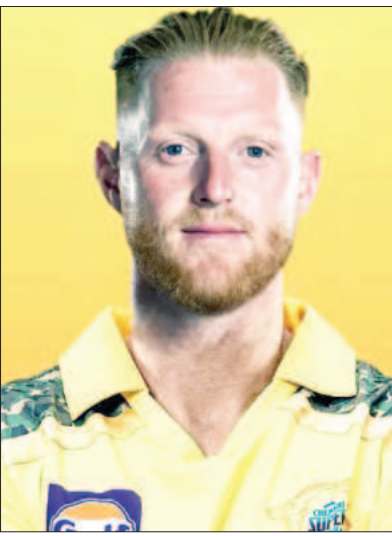
ವಿರೇದಿಸಿತ್ತು. ಆದರೆ ಗಾಯದ ಕಾರಣ ಸ್ಕೋಟ್ ಆಡಿದ್ದು ಕೇವಲ 2 ಪಂದ್ಯಗಳನ್ನು ಮಾತ್ರ. ಅಲ್ಲದೆ

ಇಂಡಿಯನ್ ಪ್ರೀಮಿಯರ್ ಲೀಗ್‌ನ 18ನೇ ಆವೃತ್ತಿಯಲ್ಲಿ ಇಂಗ್ಲೆಂಡ್ ಟೆಸ್ಟ್ ತಂಡದ ನಾಯಕ ಬೆನ್ ಸ್ಕೋಟ್ ಕಾಣಿಸಿಕೊಳ್ಳುವುದಿಲ್ಲ ಎಂಬುದು ಖಚಿತವಾಗಿದೆ. ಮೆಗಾ ಹರಾಜಿಗಾಗಿ ಹೆಸರು ನೋಂದಣಿ ಮಾಡಿಕೊಂಡಿರುವ ಆಟಗಾರರಲ್ಲಿ ಸ್ಕೋಟ್ ಹೆಸರು ಕಾಣಿಸಿಕೊಂಡಿಲ್ಲ. ಇದರೊಂದಿಗೆ ಬೆನ್ ಸ್ಕೋಟ್ ಐಪಿಎಲ್ 2025 ರಿಂದ ಹೊರಗುಳಿದಿರುವುದು ಕನ್ಸರ್ಮ್ ಆದಂತಾಗಿದೆ. ಈ ಬಾರಿಯ ಮೆಗಾ ಹರಾಜಿಗಾಗಿ ಇಂಗ್ಲೆಂಡ್‌ನ 52 ಆಟಗಾರರು ಹೆಸರು ನೋಂದಾಯಿಸಿಕೊಂಡಿದ್ದಾರೆ. ಇದಾಗಿದ್ದು ಸ್ಕೋಟ್ ಅವರು ಹೆಸರು ರಿಜಿಸ್ಟರ್ ಮಾಡಿಕೊಂಡಿಲ್ಲ. ಇದಕ್ಕೆ ಮುಖ್ಯ ಕಾರಣ ಮುಂಬರುವ ಆರ್ಟ್ ಸರಣಿ ಎನ್ನಲಾಗಿದೆ. ಆಸ್ಟ್ರೇಲಿಯಾ ವಿರುದ್ಧದ ಪ್ರತಿಷ್ಠಿತ ಟೆಸ್ಟ್ ಸರಣಿಯ ಸಿದ್ಧತೆಗಾಗಿ ಸ್ಕೋಟ್ ಐಪಿಎಲ್ ಸಿಸನ್-18 ರಿಂದ ಹೊರಗುಳಿಯಲು ನಿರ್ಧರಿಸಿದ್ದಾರೆ.