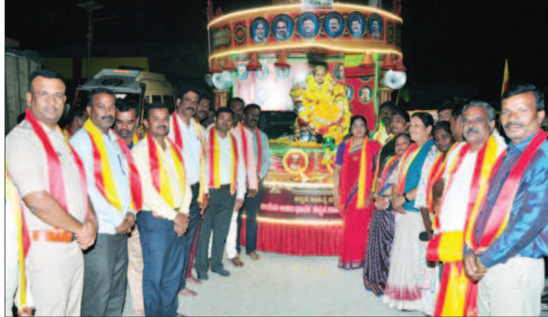
ಕಲೆ ನಾಟಕ ಸಂಸ್ಕೃತಿ ಕ್ಷೇತ್ರಕ್ಕೆ ಮಂಡ್ಯ ತನ್ನದೇ ಕೊಡುಗೆ ನೀಡುತ್ತಾ ಬಂದಿದೆ. ಕೆರಗೋಡು ಸಂಚಿಹೊನ್ನಮ್ಮ ತ್ರಿವೇಣಿ ಅಂತ ಕವಿಗಳನ್ನು ಕೊಟ್ಟ ತವರೂರಾಗಿದೆ. ಸಾಹಿತ್ಯ ಸಮ್ಮೇಳನದಲ್ಲಿ ಚಿಂತನ ಮಂಥನ ನಡೆದು ಹಲವು ಸಮಸ್ಯೆಗಳನ್ನು ಚರ್ಚಿಸಿ ತಂದು ಬಗೆಹರಿಸುವ ಕೆಲಸವನ್ನು ಒಟ್ಟಾಗಿ ಮಾಡೋರು ಇಲ್ಲಿ ನಡೆಯುವ ವಿಷಯಾಧಾರಿತ ಚರ್ಚೆಗಳು ರಾಜ್ಯ ರಾಷ್ಟ್ರಮಟ್ಟದಲ್ಲಿ ಸುದ್ದಿಗಾಗುತ್ತವೆ ಎಂಬ