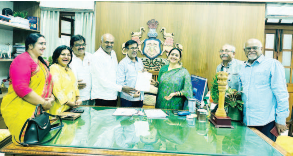
ಇಲಾಖೆ ಪ್ರಧಾನ ಕಾರ್ಯದರ್ಶಿಯಾಗಿದ್ದಾಗ ಈ ನಿಟ್ಟಿನಲ್ಲಿ ಪ್ರಯತ್ನ ಮಾಡಲಾಗಿತ್ತು. ಶಾಲಾ ಶಿಕ್ಷಣ ಕಲಿಕೆಯ ಬಗ್ಗೆ ವಿದ್ಯಾರ್ಥಿಗಳಲ್ಲಿ ಆಸಕ್ತಿ ಮೂಡಿಸಲು ಸಾಕಷ್ಟು ಕಾರ್ಯಕ್ರಮಗಳನ್ನು ಹಮ್ಮಿಕೊಳ್ಳಲಾಗಿತ್ತು. ಆದರಿಂದಾಗಿ ಸಾಕಷ್ಟು ಬದಲಾವಣೆಯನ್ನು ತರಲು ಸಾಧ್ಯವಾಗಿತ್ತು ಎಂದು ಹೇಳಿದರು. ಈಗಿನ ಕಾಲಘಟ್ಟದ ಯುವ ಜನರ ನಿರೀಕ್ಷೆಗಳನ್ನು

ಸೋಲಿಯಲ್ ಮೀಡಿಯಾ ವೇದಿಕೆಯನ್ನು ಬಳಸಿಕೊಂಡು ಉತ್ತಮ ಸಮಾಜ ನಿರ್ಮಾಣಕ್ಕಾಗಿ ಇಂಥಹ ಜಾಗೃತಿ ಮೂಡಿಸುವ ಪ್ರಯತ್ನಗಳನ್ನು ಕಡಿಮೆ ಬಡ್ಡಿಯಲ್ಲಿ ಮಾಡಲು ಮುಂದಾಗುವುದಾದರೆ ಸರ್ಕಾರವೂ ಕೂಡ ಈ ನಿಟ್ಟಿನಲ್ಲಿ ಸಹಕಾರ ನೀಡಲು ಸಾಧ್ಯವಾಗುತ್ತದೆ ಎಂದು ಹೇಳಿದರು. ತಾವು ವಾರ್ತಾ ಮತ್ತು ಸಾರ್ವಜನಿಕ ಸಂಪರ್ಕ