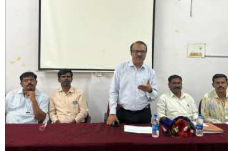
ಸೌಲಭ್ಯ ಒದಗಿಸಲಾಗಿದೆ. ಹಸು,ಅಮ್ಮ ಮೇಕೆಗೂ ಸಹಾ ಲಸಿಕೆ ಮಾಡಲಾಗುತ್ತಿದ್ದು ಪಶು ಆರೈಕೆ ಕುರಿತು ರೈತರಿಗೆ ಕಿರುಪಾಠದ ಜಾಗೃತಿ ಮೂಡಿಸಲಾಗುತ್ತಿರುವುದು ಚಿನ್ನನಾಡಿನ ಪಶುಇಲಾಖೆ ಸಾಧನೆಯಾಗಿದೆ ಎಂದು ನುಡಿದರು.

ರೇಜಿಕ್ ಸಾಕುನಾಯಿ ಮತ್ತು ಬೀದಿನಾಯಿಗಳಿಗೂ ಲಸಿಕೆ ಹಾಕಲಾಗುತ್ತಿದ್ದು ಈಗಾಗಲೇ 25 ಸಾವಿರ ಶ್ವಾನಗಳಿಗೆ