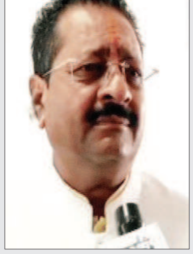
ದೆಗುಲದ ಬಳಿಗೆ ಸಿಎಂ ಹೋಗಿಲಿಲ್ಲ. ವಾಗ್ದೇವಿ ಶಾಪದಿಂದಲೇ ಮುಡಾದಲ್ಲಿ ಸಿಎಂ

ವಿಜಯಪುರ: ಭಾರತದಲ್ಲಿ ಈಗಲೇ ಒಂದು ಪಾಕಿಸ್ತಾನ ನಿರ್ಮಾಣ ಆಗಿದೆ. ಭಾರತದ ವಕ್ಲಾ ಆಸ್ತಿ ಪಾಕಿಸ್ತಾನದಷ್ಟಿದೆ ಎಂದು ಬಿಜೆಪಿ ಶಾಸಕ ಬಸನಗೌಡ ಪಾಟೀಲ್ ಯತ್ನಾಳ್ ಹೇಳಿಕೆ ನೀಡಿದ್ದಾರೆ. ಮಾಧ್ಯಮಗಳೊಂದಿಗೆ ಮಾತನಾಡಿದ ಅವರು, ಭಾರತದಲ್ಲಿ ಇನ್ನೊಂದು ಪಾಕಿಸ್ತಾನ » ಯತ್ನಾಳ್ ದಿನದಿಂದ ದಿನಕ್ಕೆ ಆಸ್ತಿ ಆರೋಪ ನಾಲಾಯಕ್ ಕಾಂಗ್ರೆಸ್ ಮಾಡಿದ ಕಾನೂನು ಇದಾಗಿದೆ. ವಕ್ಲಾ ವಿರುದ್ಧ ದೊಡ್ಡ ಸಂಗ್ರಾಮ ಆಗಬೇಕಿದೆ. ದೆಹಲಿಯಲ್ಲಿ ಮೌಲ್ವಿ ಚಿರದ್ವಬಾಬು ನಾಯ್ಡು ನಿತೇಶ್‌ಗೆ ಧಮ್ಕಿ ಹಾಕಿದ್ದಾನೆ. ಬಿಲ್‌ಗೆ ಬೆಂಬಲ ನೀಡಿದರೆ 5 ಲಕ್ಷ ಜನ ಸೇರಿಸುತ್ತೇನೆ ಎಂದಿದ್ದಾನೆ ಎಂದು ಹೇಳಿದರು. ಅಂದು ಕುಂಕುಮ ಹಚ್ಚದ ಸಿಎಂ ಈಗ ಕುಂಕುಮ ಹಚ್ಚಿಕೊಳ್ಳುತ್ತಿದ್ದಾನೆ. ಚಾಮುಂಡೇಶ್ವರಿ ಬಳಿ ಹೋಗಿ ಈಗ ಕುಂಕುಮ ಹಚ್ಚಿ ಎನ್ನುತ್ತಿದ್ದಾನೆ. ವಿಜಯಪುರದ ವಾಗ್ದೇವಿ