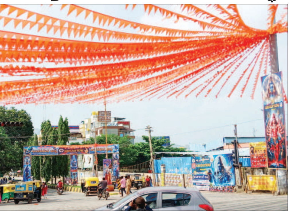
ಕೋಲಾರದ ದಕ್ಷಿಣ ಕಾಶಿಯಿಂದೇ ಪ್ರಖ್ಯಾತಿ ಗಳಿಸಿರುವ ಅಂತರಗಂಗೆ ಜಾತ್ರೆಗೆ ಬರುವ ಭಕ್ತರನ್ನು ಆಹ್ವಾನಿಸಲು ಬಸ್‌ನಿಲ್ದಾಣ ವೃತ್ತದಲ್ಲಿ ಬೃಹತ್ ಕಮಾನು ಹಾಗೂ ಶಿವನ ಬೃಹತ್ ಕಟೋಟ್‌ಗಳನ್ನು ನಿರ್ಮಿಸಿ ಇಡೀ ವೃತ್ತದಲ್ಲಿ ಕೇಸರಿ ಬಂಟಿಂಗ್ ಕಟ್ಟಿರುವ ಬಜರಂಗದಳ ಕಾರ್ಯಕರ್ತರು.

ಬಜರಂಗದಳ ಕಾರ್ಯಕರ್ತರು ನಗರದ ಬಸ್ ನಿಲ್ದಾಣ ವೃತ್ತದಲ್ಲಿ ಭಕ್ತರನ್ನು ಸ್ವಾಗತಿಸುವ ದೊಡ್ಡ ಕಮಾನಿನೊಂದಿಗೆ ಇಡೀ ಪ್ರದೇಶದಲ್ಲಿ ಕೇಸರಿ ಧ್ವಜಗಳು ರಾರಾಜಿಸುವಂತೆ ಮಾಡಿದ್ದು, ಇಡೀ ಪ್ರದೇಶವೇ ಕೇಸರಿಮಯವಾಗಿದೆ. ಎಲ್ಲಾ ಕಡೆ ಶಿವನ ಕಟೋಟ್‌ಗಳು, ಪೆಕ್ಸ್‌ಗಳು ಹಾಕಲಾಗಿದ್ದು, ಅಂತರಗಂಗೆ ಜಾತ್ರೆಗೆ ಬರುವ ಹಿಂದೂಗಳಿಗೆ ಭವ್ಯ ಸ್ವಾಗತ ಕೋರುವ ಕಮಾನು ತಲೆಯೆತ್ತಿದೆ. ಕಡೆ ಕಾರ್ತಿಕ ಸೋಮವಾರದ ಜಾತ್ರೆ ಮತ್ತಷ್ಟು ವಿಜೃಂಭಣೆಯಿಂದ ನಡೆಸಲು ಪ್ರೋವಸಿದ್ಧತೆ ನಡೆಸಿರುವ ಕಾರ್ಯಕರ್ತರು ಬಸ್‌ನಿಲ್ದಾಣ ವೃತ್ತದಲ್ಲಿ ಪೆಂಡಾಂಟ್ ನಿರ್ಮಿಸಿ, ಜಾತ್ರೆಗಾಗಿ ಬರುವ ಭಕ್ತರಿಗೆ ನೆರಳು ಒದಗಿಸಿ, ಉಚಿತ ಬಸ್ ಸೇವೆಯನ್ನು ಇಲ್ಲಿಂದಲೇ ಆರಂಭಿಸಲು ಸಿದ್ಧತೆ ನಡೆಸಿದ್ದಾರೆ. ಬರುವ ಭಕ್ತರಿಗಾಗಿ ಉಚಿತ, ಪ್ರಸಾದ,ಕುಡಿಯುವ ನೀರು, ರಕ್ಷಣೆ ಸೇರಿದಂತೆ ಎಲ್ಲಾ ವ್ಯವಸ್ಥೆಗಳನ್ನು ಕಲ್ಪಿಸುವ ನಿಟ್ಟಿನಲ್ಲಿ ಬಜರಂಗದಳ ಕಾರ್ಯಕರ್ತರು ವಾರದಿಂದ ಶ್ರಮಿಸುತ್ತಿದ್ದಾರೆ.