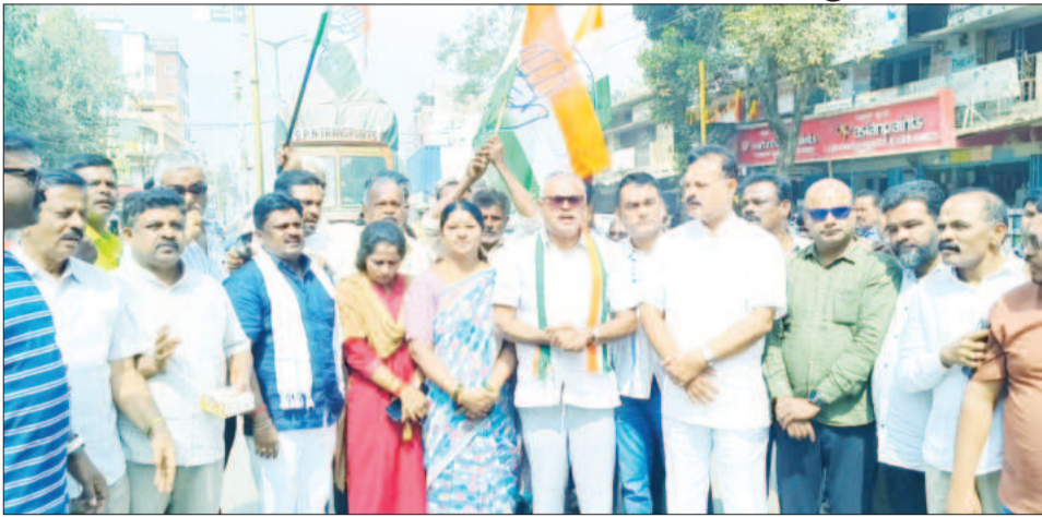
ಈ ಎರಡು ಪಕ್ಷಗಳು ಮೈತ್ರಿ ಕೂಟದ ಕನ್ನಡ ಬಿಟ್ಟು ಬಾಯಿಯನ್ನು ಗಟ್ಟಿಯಾಗಿ ಮುಚ್ಚಿಕೊಂಡು ಇರಬೇಕು. ರಾಜ್ಯದ ಜನತೆ ಕಾಂಗ್ರೆಸ್ ಪಕ್ಷದ ಪರವಾಗಿದ್ದಾರೆ ಎಂಬುದನ್ನು