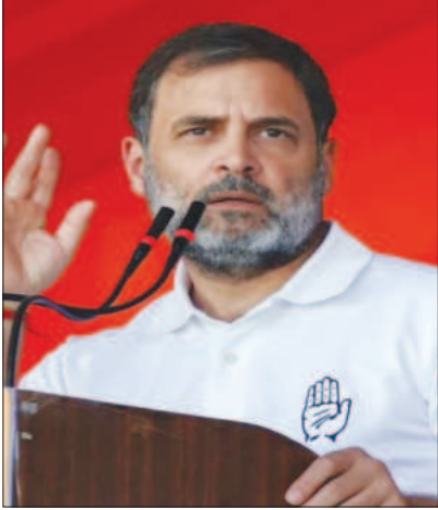
ಹಿಂದಿನ ವಿಚಾರಣೆಯ ವೇಳೆ ನ್ಯಾಯಾಲಯವು ಅರ್ಜಿದಾರರ ಕೋರಿಕೆಯನ್ನು ಸ್ವೀಕರಿಸಲಾಗಿದೆಯೇ

ರಾಹುಲ್ ಗಾಂಧಿ ಅವರ ದ್ವಿಪೌರತ್ವ ಪ್ರಶ್ನಿಸಲಾಗಿದ್ದು, ಭಾರತೀಯ ನ್ಯಾಯ ಸಂಹಿತೆ ಮತ್ತು ಪಾಸ್ಪೋರ್ಟ್ ಕಾಯ್ದೆ ಅಡಿ ಅವರ ನಾಗರಿಕತ್ವದ ವಿರುದ್ಧ ಸಿಬಿಐ ಪ್ರಕರಣ ದಾಖಲಿಸಿಕೊಂಡು ತನಿಖೆ ನಡೆಸಬೇಕು ಎಂದು ಅರ್ಜಿಯಲ್ಲಿ ಕೋರಲಾಗಿದೆ.