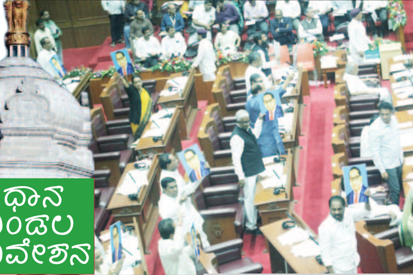
ವಿಧಾನ ಮಂಡಲ ಅಧಿವೇಶನ

ಬೆಳಗಾವಿ / ಬೆಂಗಳೂರು: ಬಳ್ಳಾರಿಯಲ್ಲಿ ಸಂಭವಿಸಿದ ಬಾಣಂತಿಯರ ಸಾವಿನ ಪ್ರಕರಣವನ್ನು ಸರ್ಕಾರ ಗಂಭೀರವಾಗಿ ಪರಿಗಣಿಸಿದೆ. ಇದರಲ್ಲಿ ತತ್ಪ್ರತ್ಯಕ್ಷನಾದ ತೀವ್ರ ಬಂಧನ, ಯಾವುದೇ ಮೂಲಾಬಲ ಇಲ್ಲದೇ, ನನ್ನ ಮೇಲಿನ ಕ್ರಮಕ್ಕೂ ಸಿದ್ಧ ಎಂದು ಆರೋಗ್ಯ ಮತ್ತು ಕುಟುಂಬ ಕಲ್ಯಾಣ ಇಲಾಖೆ ಸಚಿವ ದಿನೇಶ್ ಗುಂಡೂರಾವ್ ಹೇಳಿದರು. ಬೆಳಗಾವಿ ಸುವರ್ಣ ವಿಧಾನಸಭೆಯಲ್ಲಿ ನಡೆಯುತ್ತಿರುವ ಅಧಿವೇಶನದಲ್ಲಿ, ವಿರೋಧ ಪಕ್ಷದ ನಾಯಕರು ನಿಯಮ 69 ಅಡಿ ಬಾಣಂತಿಯರ ಸಾವಿನ ಕುರಿತು ಪ್ರಸ್ತಾಪಿಸಿದ್ದ ವಿಚಾರಗಳಿಗೆ ಸಚಿವ ದಿನೇಶ್ ಗುಂಡೂರಾವ್ ಶುಕ್ರವಾರ ಉತ್ತರಿಸಿದರು. ಕಳೆದ ನವೆಂಬರ್ ತಿಂಗಳ 9, 10 ಹಾಗೂ 11 ತಾರೀಖಿನಂದು ಬಳ್ಳಾರಿ ಆಸ್ಪತ್ರೆಯಲ್ಲಿ 34 ಸಿಜೇರಿಯನ್ ಹೆರಿಗೆ ಮಾಡಲಾಗಿದೆ. ಈ ಪೈಕಿ 7 ಬಾಣಂತಿಯರು ಹೆರಿಗೆ ನಂತರ ತೀವ್ರ ತರನಾಗಿ ಆಸ್ಪತ್ರೆಗೊಂಡರು. ಇದರಲ್ಲಿ 5 ಬಾಣಂತಿಯರು ಸಾವನ್ನಪ್ಪಿದರೆ, ಇಬ್ಬರು ಸಾವಿನಿಂದ ಪಾರಾದರು. ಘಟನೆ ತಿಳಿದ ತಕ್ಷಣವೇ, ಸಾವಿನ ಕಾರಣ ತಿಳಿಯಲು ಬೆಂಗಳೂರಿನ ರಾಜೀವ್ ಗಾಂಧಿ ಆರೋಗ್ಯ ಇನ್ಸ್ಟಿಟ್ಯೂಟ್ನ ವಿಶ್ವವಿದ್ಯಾಲಯದ ವೈದ್ಯರ ತಂಡ ರಚಿಸಿ ಬಳ್ಳಾರಿಗೆ ಕಳುಹಿಸಿಕೊಂಡಲಾಯಿತು. ಈ ತಂಡ ನವೆಂಬರ್ 12 ಹಾಗೂ 13 ರಂದು ಕೊಲಕತ್ತೆಯಲ್ಲಿ ಅಧ್ಯಯನ ನಡೆಸಿ, ನವೆಂಬರ್ 14 ರಂದು ವರದಿ ನೀಡಿದೆ. ಇದರಲ್ಲಿ ವೈದ್ಯರ ಶಸ್ತ್ರಚಿಕಿತ್ಸೆಯ ಎಲ್ಲಾ ಶಿಲ್ಪಗಾರ ನಿಯಮಗಳನ್ನು ಪಾಲಿಸಿದ್ದಾರೆ. ವೈದ್ಯರಿಂದ ಲೋಪವಾಗಿಲ್ಲ, ಬದಲಾಗಿ ಸಿಜೇರಿಯನ್ ನಂತರ ಬಾಣಂತಿಯರಿಗೆ ನೀಡಿದ ರಿಂಗರ್ ಲ್ಯಾಕ್ಟೇಟ್ ಐವಿ ದ್ರಾವಣದ ಪ್ರತಿಕೂಲ ಪರಿಣಾಮದಿಂದ ಸಾವು ಸಂಭವಿಸಿರುವುದಾಗಿ ವರದಿ ನೀಡಿದರು. ಇದರ ಆಧಾರದಲ್ಲಿ ಪಶ್ಚಿಮ ಬಂಗಾ ಕಂಪನಿ ಪ್ರಾರ್ಥಿಸಿದ ರಿಂಗರ್ ಲ್ಯಾಕ್ಟೇಟ್ ಐವಿ ದ್ರಾವಣವನ್ನು ಪರೀಕ್ಷೆಗಾಗಿ ಲ್ಯಾಬಿಗೆ ಕಳುಹಿಸಿಕೊಟ್ಟಾಗ ಕಳಪೆ ಗುಣಮಟ್ಟದ್ದು ಎಂದು ಪತ್ತೆಯಾಗಿದೆ. ಹೈದರಾಬಾದ್ ಲ್ಯಾಬ್‌ನಲ್ಲಿ ನಡೆಸಿದ ಪರೀಕ್ಷೆಯಲ್ಲಿ ರಿಂಗರ್ ಲ್ಯಾಕ್ಟೇಟ್ ಐವಿಯಲ್ಲಿ ಎಂಡೋ ಟಾಕ್ಸಿಕ್ ಅಂಶ ಇರುವುದಾಗಿ ತಿಳಿದು ಬಂದಿದೆ ಎಂದು ಸಚಿವ ದಿನೇಶ್ ಗುಂಡೂರಾವ್ ಮಾಹಿತಿ ನೀಡಿದರು.