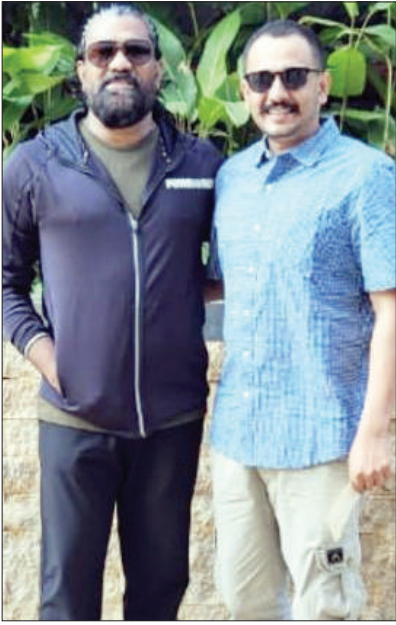
ಮನರಂಜನಾಕೃತ್ ಸಿನಿಮಾಗಳನ್ನು ಕೂಡೋ ದೃಷ್ಟಿಯಿಂದ ಕೆಲಸ ಮಾಡುತ್ತೇವೆ. ಅದರಂತೆ ಇಂಥ

ಹೊಸ ಬಗೆಯ ಚಿಂತನೆಯುಳ್ಳ, ನಿರ್ದೇಶಕರಿಂದ ಜನರ ಮನರಂಜಿಸುವ ಕೆಲಸಕ್ಕೆ ಕೈ ಹಾಕಿರೋದೇ ಒಂದು ಮೈನವಿರೇಳಿಸೋ ಪ್ರಯತ್ನ. ಇಂತಹ ತಂಡದ ಜೊತೆಗೆ ಸಿನಿಮಾ ಮಾಡೋ ಮೂಲಕ ಮಲಯಾಳಂ ಚಿತ್ರರಂಗಕ್ಕೆ ಕಾಲಿಡುತ್ತಿರುವ ನಮಗೆ ಹೆಮ್ಮೆ ತಂದಿದೆ. ಒಂದು ಕಥೆಯನ್ನೇ ತೆರೆ ಮೇಲೆ ತರೋ ಪ್ರಕ್ರಿಯೆಯೇ ರೋಮಾಂಚ. ನನ್ನಂತೆಯೇ ಒಳ್ಳೆಯ ಕಥೆಗೆ, ಸ್ಕ್ರಿಪ್ಟ್‌ಗೆ ಒತ್ತು ಕೊಡುವ ತಂಡದ ಜೊತೆ ಕೆಲಸ ಮಾಡಿರೋದು ನಿಜಕ್ಕೂ ಹೆಮ್ಮೆಯ ವಿಷಯ. ಇದು ನನ್ನ ಹೃದಯಕ್ಕೆ ಹತ್ತಿರವಾದ ಕಥೆಯಾಗಿದೆ. ಸಿನಿಮಾ ಕೃಷಿಯ ಬಗ್ಗೆ ಇಷ್ಟೊಂದು ಗಾಢ ಪ್ರೀತಿಯುಳ್ಳ ತಂಡದ ಜೊತೆ ಕೆಲಸ ಮಾಡೋದೇ ಒಂದು ದೊಡ್ಡ ಖುಷಿ ಅಂತ ಅಭಿಪ್ರಾಯಪಟ್ಟರು. ಕೆವಿಎನ್ ಪ್ರೊಡಕ್ಷನ್ಸ್ ಪಾಲಿಗೆ 2025 ಸುವರ್ಣ ಸಮಯವಾಗಲಿದೆ. ಈಗಾಗಲೇ ಯಶ್ ಜೊತೆ ಟಾಕಿಕ್, ತಮಿಳಿನ ದಳಪತಿ ಜೊತೆ ‘ತಳವಡಿ 69’ ಸಿನಿಮಾ, ಹಿಂದಿಯಲ್ಲಿ ಪ್ರಿಯದರ್ಶನ್ ಜೊತೆ ಒಂದು ಸಸ್ಟೈನ್ ಥ್ರಿಲ್ಲರ್ ಸಿನಿಮಾ, ಹಾಗೆಯೇ ಧ್ರುವ ಸರ್ಜಾ ಜೊತೆ ‘ಕಡಿ’ ಸಿನಿಮಾವಿದೆ. ಇದೀಗ ಮಲಯಾಳಂ ಚಿತ್ರರಂಗಕ್ಕೆ ಹೀಗೆ ನುರಿತರೊಂದಿಗೆ ಕಾಲಿಡಿದ್ದು, ಮುಂದಿನ ದಿನಗಳಲ್ಲಿ ಇನ್ನೂ ದೊಡ್ಡ ದೊಡ್ಡ ಯೋಜನೆಗಳನ್ನು ಹಾಕಿಕೊಂಡಿರೋ ಸೂಚನೆ ಕೆವಿಎನ್ ಸಂಸ್ಥೆ ಕೊಡುತ್ತಿದೆ.