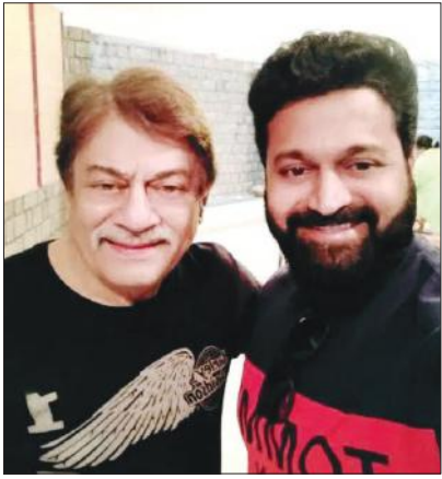
ಪ್ರಿಯ ಅನಂತ್ ನಾಗ್ ಅವರಿಗೆ ಪದ್ಮಭೂಷಣ ಪ್ರಶಸ್ತಿ ಲಭಿಸಿದ ಸುದ್ದಿ ಕೇಳಿ ಅಪಾರ ಸಂತೋಷವಾಯಿತು. ನಿಮ್ಮ ಕಲಾ ಸಾಧನೆ ಕನ್ನಡ ನಾಡಿನ ಕೀರ್ತಿಯನ್ನು ಹೆಚ್ಚಿಸಿದೆ. ನಿಮ್ಮ ಈ ಸಾಧನೆಗೆ ನನ್ನ ಹೃದಯಪೂರ್ವಕ ಪ್ರಶಸ್ತಿ ಘೋಷಣೆ ಆಗಿದೆ.

ಅಭಿನಂದನೆಗಳು' ಎಂದಿದ್ದಾರೆ. ಅನಂತ್ ನಾಗ್ ಅವರಿಗೆ ಒಂದೇ ರೀತಿಯ ಗಂಭೀರ ಪಾತ್ರಗಳನ್ನೇ ನಿರ್ದೇಶಕರುಗಳು ನೀಡುತ್ತಿದ್ದ ಸಮಯದಲ್ಲಿ ರಿಷಬ್ ಶೆಟ್ಟಿ ಅನಂತ್ ನಾಗ್ ಅವರನ್ನು ಭಿನ್ನವಾಗಿ ತೆರೆಯ ಮೇಲೆ ತೋರಿಸುವ ಪ್ರಯತ್ನ ಮಾಡಿದ್ದರು. ರಿಷಬ್ ಶೆಟ್ಟಿ ನಿರ್ದೇಶನದ 'ಸರ್ಕಾರಿ ಹಿರಿಯ ಪಾಠ ಶಾಲೆ ಕಾಸರಗೋಡು' ಸಿನಿಮಾದಲ್ಲಿ ಅನಂತ್ ನಾಗ್ ಅವರಿಗೆ ಭಿನ್ನವಾದ ಪಾತ್ರವನ್ನು ನೀಡಿದ್ದರು. ಆ ಸಿನಿಮಾ ಸೂಪರ್ ಹಿಟ್ ಆಗಿತ್ತು. ಅನಂತ್ ನಾಗ್ ಅವರನ್ನು ಭಿನ್ನ ರೀತಿಯಲ್ಲಿ ರಿಷಬ್ ಆ ಸಿನಿಮಾದಲ್ಲಿ ತೋರಿಸಿದ್ದರು. ಹಿರಿಯ ನಟ ಅನಂತ್ ನಾಗ್ ಅವರಿಗೆ ಪದ್ಮ ಪ್ರಶಸ್ತಿ ಸಿಗಬೇಕು ಎಂಬುದು ಬಹು ವರ್ಷದ ಬೇಡಿಕೆ ಆಗಿತ್ತು. ಕಳೆದ ವರ್ಷ ನಟ ಮಗಾಸ್ವಾರ್ಥಿ ಚಿರಂಜೀವಿಗೆ ಪದ್ಮ ವಿಭೂಷಣ ಘೋಷಣೆಯಾದಾಗಲೂ ಅನಂತ್ ನಾಗ್ ಅವರನ್ನು ನಿರ್ಲಕ್ಷ್ಯ ಮಾಡಿರುವ ಬಗ್ಗೆ ಆಸಮಾಧಾನ ವ್ಯಕ್ತಪಡಿಸಲಾಗಿತ್ತು. ಆದರೆ ಈಗ ಕೊನೆಗೂ ಅನಂತ್ ನಾಗ್ ಅವರಿಗೆ ಪದ್ಮ ಭೂಷಣ ಪ್ರಶಸ್ತಿ ಘೋಷಣೆ ಆಗಿದೆ.