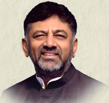
ಶ್ರೀ ಡಿ.ಕೆ. ಶಿವಕುಮಾರ್ ಮಾನ್ಯ ಉಪ ಮುಖ್ಯಮಂತ್ರಿಗಳು

ಶ್ರೀ ಸಿದ್ದರಾಮಯ್ಯ ಸನ್ಮಾನ್ಯ ಮುಖ್ಯಮಂತ್ರಿಗಳು