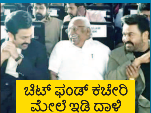
ಚಿಟ್ ಫಂಡ್ ಕಚೇರಿ ಮೇಲೆ ಇಡಿ ದಾಳಿ