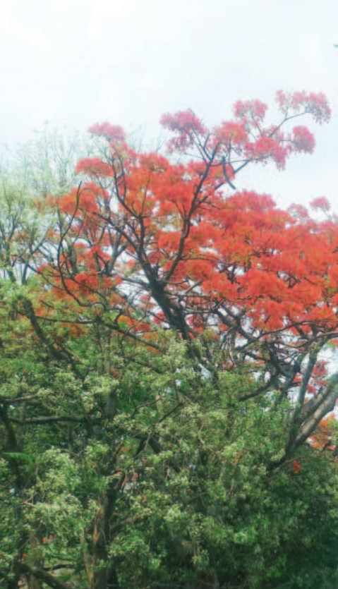
ವಿಜಯಪುರದ ಪಟ್ಟಣದ ದೇವನಹಳ್ಳಿ ರಸ್ತೆಯ ಎರಡು ಬದಿಗಳಲ್ಲಿ ಮತ್ತು ಜಯಚಾಮರಾಜೇಂದ್ರ ಬಡಾವಣೆಯ ಉದ್ದಾನವನಗಳಲ್ಲಿ ಮೇ ತಿಂಗಳು ಮೊದಲನೇ ತಾರೀಖಿಗೆ ಕಂಡು ಬರುತ್ತಿರುವ ಮೇ ಪೂರ್ವ ಮರದ ಹೂವುಗಳು ಎಲ್ಲರನ್ನೂ ಆಕರ್ಷಿಸುತ್ತಲೇ ಇರುವುದು ವಿಶೇಷವೆಂದರೆ ಏಪ್ರಿಲ್ ತಿಂಗಳಿನಲ್ಲಿ ಮರದಲ್ಲಿ ಒಂದು ಹೂವು ಕಾಣದಿರುವುದು ಮೇ ತಿಂಗಳ ಮೊದಲನೇ ತಾರೀಖಿನಿಂದ ಎಲ್ಲೆಲ್ಲೂ ಕಂಡು ಬರುತ್ತಿರುವುದು ವಿಶೇಷವಾಗಿತ್ತು.

ಮಂಡ್ಯ: ಗರದ ಶ್ರೀ ಲಕ್ಷ್ಮೀಜನಾರ್ಧನಸ್ವಾಮಿ ದೇವಾಲಯದ 2025-26 ನೇ ಬ್ರಹ್ಮ ರಥೋತ್ಸವವು ಮೇ 7 ರ ಬುಧವಾರದಂದು ನಡೆಯಲಿದೆ ಎಂದು ಶ್ರೀ ಲಕ್ಷ್ಮೀಜನಾರ್ಧನಸ್ವಾಮಿ ದೇವಾಲಯದ ಕಾರ್ಯನಿರ್ವಾಹಕ ಅಧಿಕಾರಿ ಪ್ರಕಟಣೆಯಲ್ಲಿ ತಿಳಿಸಿದ್ದಾರೆ.