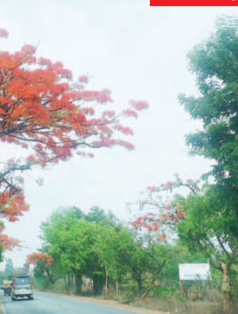
ವಿಜಯಪುರದ ಪಟ್ಟಣದ ದೇವನಹಳ್ಳಿ ರಸ್ತೆಯ ಎರಡು ಬದಿಗಳಲ್ಲಿ ಮತ್ತು ಜಯಚಾಮರಾಜೇಂದ್ರ ಬಡಾವಣೆಯ ಉದ್ದಾನವನಗಳಲ್ಲಿ ಮೇ ತಿಂಗಳು ಮೊದಲನೇ ತಾರೀಖಿಗೆ ಕಂಡು ಬರುತ್ತಿರುವ ಮೇ ಪೂರ್ವ ಮರದ ಹೂವುಗಳು ಎಲ್ಲರನ್ನೂ ಆಕರ್ಷಿಸುತ್ತಲೇ ಇರುವುದು ವಿಶೇಷವೆಂದರೆ ಏಪ್ರಿಲ್ ತಿಂಗಳಿನಲ್ಲಿ ಮರದಲ್ಲಿ ಒಂದು ಹೂವು ಕಾಣದಿರುವುದು ಮೇ ತಿಂಗಳ ಮೊದಲನೇ ತಾರೀಖಿನಿಂದ ಎಲ್ಲೆಲ್ಲೂ ಕಂಡು ಬರುತ್ತಿರುವುದು ವಿಶೇಷವಾಗಿತ್ತು.