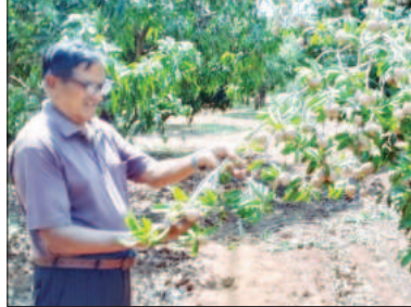
ಹೆಣ್ಣಿನ ಗಿಡಗಳನ್ನು ಬೆಳೆಯುತ್ತಿರಲಿಲ್ಲವೆಂದು ತಿಳಿಸಿದರು. ಬೆಂಗಳೂರಿನ ಲಾಲ್ಬಾಗ್ನಲ್ಲಿ ಹೆಣ್ಣಿನ ಗಿಡಗಳು ಇಂತಹವು ಇರುತ್ತಿದ್ದು ಗ್ರಾಮೀಣ ಪ್ರದೇಶದ ಹಳ್ಳಿಗಳಲ್ಲಿ ಇಂತಹ ಗಿಡಗಳು ಅಪರೂಪವಾಗಿದ್ದವು.