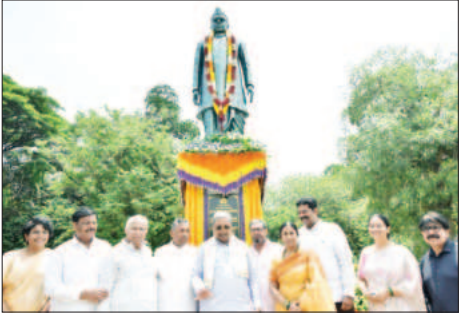
ಮೀಸಲಾತಿ ಪರವಾಗಿ ನೀಡಿರುವ ಆದೇಶದಂತೆ ನಾವು ಮುಂದುವರಿದೇವೆ.

2011ರ ಜನಗಣತಿ ಆಧಾರದಲ್ಲಿ ಸದಾಚಿವ ಆಯೋಗ ಪರಿಶಿಷ್ಟ ಜಾತಿ ಸಮುದಾಯಗಳ ಜನಸಂಖ್ಯೆಯನ್ನು ಗುರುತಿಸಿತು. 1-8-2024 ರಲ್ಲಿ ಸುಪ್ರೀಂ ಕೋರ್ಟ್ ಒಳ