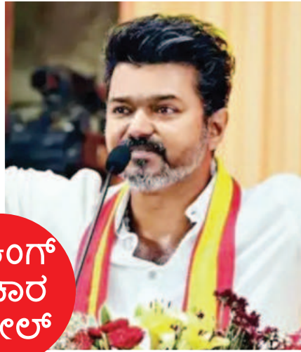
ತಾಕಿಂಗ್ ವಿಚಾರ ರಿವೀಲ್

ದಳದತಿ ವಿಜಯ್ ನಟನೆಯ 'ಜನ ನಾಯಗನ್' ಸಿನಿಮಾ ನಿರೀಕ್ಷೆ ಮೂಡಿಸಿದೆ. ಈ ಚಿತ್ರ ದೊಡ್ಡ ಮಟ್ಟದಲ್ಲಿ ಹಿಟ್ ಆಗುವ ಸೂಚನೆ ಇದೆ. ಇದಕ್ಕೆ ಕಾರಣ ಇದು ವಿಜಯ್ ಅವರ ಕೊನೆಯ ಚಿತ್ರವಾಗಲಿದೆ ಎಂಬುದು. ಆ ಬಳಿಕ ಅವರು ರಾಜಕೀಯಕ್ಕೆ ಎಂಟ್ರಿ ಕೊಡಲಿದ್ದಾರೆ. ಈಗ ಅವರು ಪ್ರತಿ ವಿಚಾರವನ್ನು ವೋಟ್ ರೀತಿಯಲ್ಲೇ ನೋಡುತ್ತಿದ್ದಾರೆ ಎನ್ನುವ ಮಾತುಗಳು ಕೇಳಿ ಬಂದಿವೆ. ಇದಕ್ಕೆ ಅವರು ಇತ್ತೀಚೆಗೆ ತೆಗೆದುಕೊಂಡ ನಿರ್ಧಾರವೇ ಕಾರಣ. 'ಜಾಟ್' ಸಿನಿಮಾ ಮಾಡಿ ಫೇಮಸ್ ಆದ ತೆಲುಗಿನ ಗೋಪಿಚಂದ್ ಮಲಿನೇನಿ ಅವರು ಇತ್ತೀಚೆಗೆ ಸಂದರ್ಶನ ಒಂದನ್ನು ನೀಡಿದ್ದಾರೆ. ಈ ವೇಳೆ ಅವರು ದಳದತಿ ವಿಜಯ್ ಬಗ್ಗೆ ಹಾಗೂ ಅವರ ಸಿನಿಮಾ ಬಗ್ಗೆ ಮಾತನಾಡಿದ್ದಾರೆ. ಕೊನೆಯ ಸಿನಿಮಾಗೆ ಅವರಿಗೆ ತಮಿಳು ನಿರ್ದೇಶಕರನ್ನೇ ಆಯ್ಕೆ ಮಾಡಿಕೊಳ್ಳಬೇಕು ಎಂಬ ಒತ್ತಡ ಇತ್ತು ಎಂದಿದ್ದಾರೆ. ಗೋಪಿಚಂದ್ ಅವರು ವಿಜಯ್‌ನ ಭೇಟಿ ಮಾಡಿ