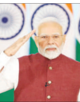
ಭಯೋತ್ಪಾದಕ ಕೇಂದ್ರಗಳನ್ನು ಧ್ವಂಸಗೊಳಿಸಿತು. "ನಮ್ಮ ತ್ರಿವಿಧ ದಳಗಳು ಒಂದು ಚಕ್ರವ್ಯೂಹವನ್ನು

ಬಿಕಾನೇರ್: ಪ್ರಧಾನ ಮಂತ್ರಿ ನರೇಂದ್ರ ಮೋದಿ ಅವರು ಗುರುವಾರ ರಾಜಸ್ಥಾನದ ಬಿಕಾನೇರ್‌ನಲ್ಲಿ ನಡೆದ ಸಾರ್ವಜನಿಕ ಸಭೆಯಲ್ಲಿ ಇಂಡಸ್ ವಾಟರ್ ಟ್ರೀಟಿ (ಏಫ್‌ಟಿ) ಕುರಿತು ಪಾಕಿಸ್ತಾನಕ್ಕೆ ಕಟ್ಟುನಿಟ್ಟಾದ ಎಚ್ಚರಿಕೆ ನೀಡಿದರು. "ಪಾಕಿಸ್ತಾನವು ಭಯೋತ್ಪಾದಕರನ್ನು ರಫ್ತು ಮಾಡುವುದನ್ನು ಮುಂದುವರಿಸಿದರೆ, ಭಾರತದ ಹಕ್ಕಿನ ಒಂದು ಹನಿ ನೀರನ್ನೂ ಅದಕ್ಕೆ ನೀಡುವುದಿಲ್ಲ. ಭಾರತೀಯರ ರಕ್ಷಣೆಗಾಗಿ ಅಟವಾದಿದರೆ, ಪಾಕಿಸ್ತಾನಕ್ಕೆ ಭಾರೀ ಬೆಲೆ ತೆರಬೇಕಾಗುತ್ತದೆ," ಎಂದು ಅವರು ದೃಢವಾಗಿ ಹೇಳಿದರು. ಅಪರೇಷನ್ ಸಿಂದೂರ್ ಮತ್ತು ಚಕ್ರವ್ಯೂಹ ಪಾಹಲ್‌ಗಾಮ್‌ನಲ್ಲಿ ಏಪ್ರಿಲ್ 22, 2025ರಂದು ನಡೆದ ಭಯೋತ್ಪಾದಕ ದಾಳಿಯಲ್ಲಿ 26 ಮಂದಿ ಬಲಿಯಾದ ನಂತರ, ಭಾರತೀಯ ಸೇನೆಯು 'ಅಪರೇಷನ್ ಸಿಂದೂರ್' ಮೂಲಕ ಪಾಕಿಸ್ತಾನ ಮತ್ತು ಆಕ್ರಮಿತ ಜಮ್ಮು-ಕಾಶ್ಮೀರದ ಒಂಬತ್ತು