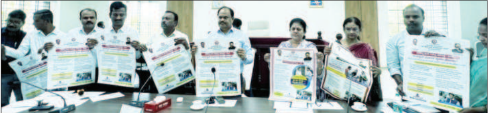
ಸಮೀಕ್ಷೆ ನಡೆದಿದೆ ಎಂದು ತಿಳಿಸಿದರು.

ಜಿಲ್ಲೆಯಲ್ಲಿ ಒಟ್ಟು ಅಂದಾಜು 353806 ಕುಟುಂಬಗಳಿದ್ದು, ಅದರಲ್ಲಿ 342156 ಕುಟುಂಬಗಳ ಸಮೀಕ್ಷೆ ಮುಗಿದಿದ್ದು ಶೇಕಡ 96.71 ರಷ್ಟು ಪ್ರಗತಿ ಸಾಧಿಸಲಾಗಿದೆ. ಪರಿಶಿಷ್ಟ ಜಾತಿಯ ಒಟ್ಟು 110273 ಕುಟುಂಬ ಗಳಿದ್ದು 98753 ಸಮೀಕ್ಷೆಯಾದ ಪರಿಶಿಷ್ಟ ಜಾತಿಯ ಕುಟುಂಬಗಳಾಗಿದ್ದು ಶೇಕಡ 89.55 ರಷ್ಟು ಸಮೀಕ್ಷೆ ಯಾಗಿದೆ. ಇತರ ಕುಟುಂಬಗಳು 251099 ಇದ್ದು 254666 ಕುಟುಂಬಗಳ ಸಮೀಕ್ಷೆ ಮುಗಿದಿದ್ದು ಶೇಕಡ 101.42 ರಷ್ಟು