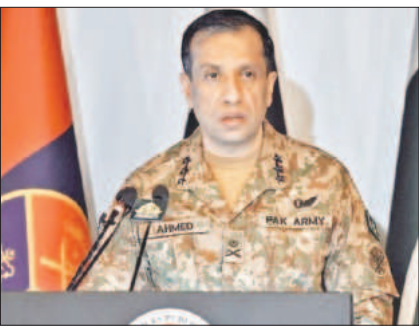
ಸಿಂಧೂ ನದಿ ನೀರಿನ ಒಪ್ಪಂದವನ್ನು ರದ್ದುಗೊಳಿಸಿದ. ಪಾಕಿಸ್ತಾನ ಹಲವು ಬಾರಿ ಈ ಕುರಿತು ಮಾತನಾಡುವಂತೆ