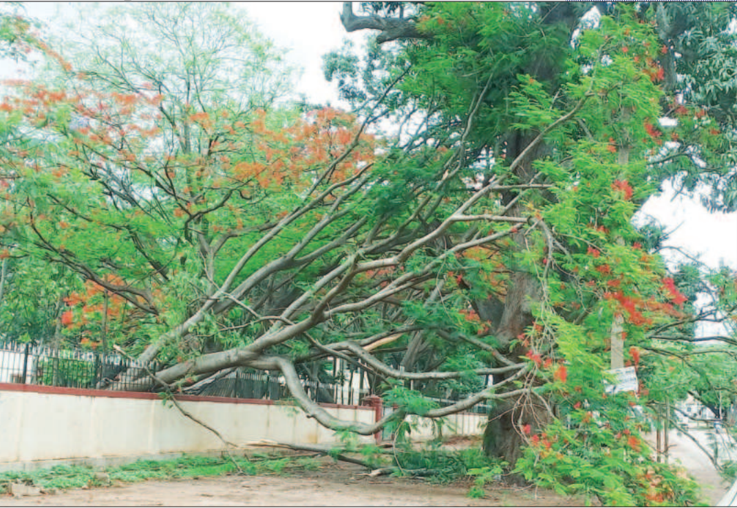
ವಿಜಯಪುರ ಪಟ್ಟಣದಲ್ಲಿ ಕಳೆದ 2 ದಿನಗಳಿಂದ ಆಷಾಢ ಮಾಸವನ್ನು ನೆನಪಿಸುವಂತಹ ಗಾಳಿ ಬೀಸುತ್ತಿದ್ದು, ಮಳೆ ಬಾರದಿದ್ದರೂ, ಬೀಸುತ್ತಿರುವ ಜೋರು ಗಾಳಿಗೆ ಶನಿವಾರದಂದು ಪರಿವೀಕ್ಷಣಾ ಮಂದಿರದ ಒಳಗಿರುವ ಗುಲ್ಬರ್ಗ್(ಮೇ ಪ್ಲವರ್)ಮರ ಬುಡ ಸಮೇತ ಬಿದ್ದಿದ್ದು, ಅಲ್ಲೇ ಎಳೆನೀರು ವ್ಯಾಪಾರ ಮಾಡುತ್ತಿದ್ದವರು ಆ ಸಮಯದಲ್ಲಿ ಅಲ್ಲಿಲ್ಲದ ಕಾರಣ ಯಾವುದೇ ಅನಾಹುತ ಸಂಭವಿಸದೆ, ಕೇವಲ ಕಾಂಪೌಂಡ್ ಗೋಡೆಗೆ ಹಾನಿಯಾಗಿದೆ.