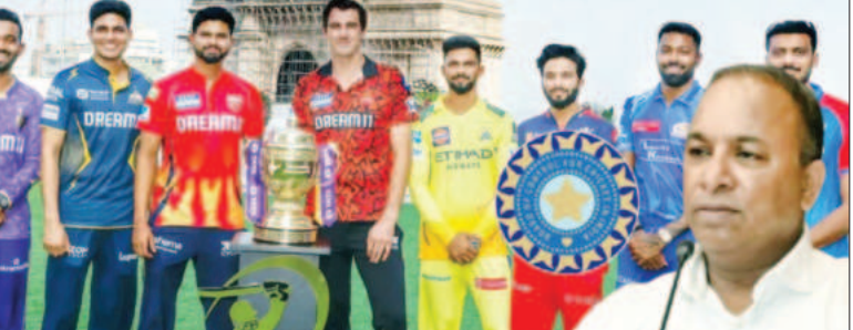
ಬಿಸಿಸಿಬಿ ಕಾರ್ಯದರ್ಶಿ ಹೇಳಿದ್ದೇನು: ಭವಿಷ್ಯದಲ್ಲಿ ಐಪಿಎಲ್ ವಿಜಯೋತ್ಸವ ಆಚರಣೆಗೆ ಮಾರ್ಗಸೂಚಿಗಳನ್ನು ಜಾರಿಗೆ ತರುವ ಬಗ್ಗೆ ಬಿಸಿಸಿಬಿ ಚಿಂತಿಸುತ್ತಿದೆ ಎಂದು ಬಿಸಿಸಿಬಿ ಕಾರ್ಯದರ್ಶಿ ದೇವಜಿತ್ ಸೈಕಿಯಾ ಕ್ರಿಕೆಟ್‌ಗೆ ತಿಳಿಸಿದ್ದಾರೆ. ‘ಇಂತಹ ದುರಂತಗಳ ನಡೆಯದಂತೆ ಬಿಸಿಸಿಬಿ ಏನನ್ನಾದರೂ ಮಾಡಬೇಕಾಗುತ್ತದೆ. ನಾವು ಮಾನವನಾಗಿರಲು ಸಾಧ್ಯವಿಲ್ಲ. ಇದು ಆರ್ ಸಿಬಿಯ ಖಾಸಗಿ ಕಾರ್ಯಕ್ರಮವಾಗಿತ್ತು, ಆದರೆ ಬಿಸಿಸಿಬಿ ಆಗಿ ನಾವು ಭಾರತದಲ್ಲಿ ಕ್ರಿಕೆಟ್ ಗೆ ಜವಾಬ್ದಾರಾಗಿದ್ದೇವೆ. ಭವಿಷ್ಯದಲ್ಲಿ ಇಂತಹ ಘಟನೆಗಳು ಮತ್ತೆ ಸಂಭವಿಸದಂತೆ ನೋಡಿಕೊಳ್ಳಲು ನಾವು ಪ್ರಯತ್ನಿಸುತ್ತೇವೆ ಎಂದು ಹೇಳಿಕೊಂಡಿದ್ದಾರೆ. ಬಿಸಿಸಿಬಿ ಈಗ ಏನು ಮಾಡುತ್ತದೆ: ಈಗ

2025 ರ ಐಪಿಎಲ್‌ಗೆ ಸುಪ್ರಾಂತ್ಯವೇನೋ ಸಿಕ್ಕಿತು. ಅದರ 17 ವರ್ಷಗಳ ಬಳಿಕ ಚಾಂಪಿಯನ್ ಆದ ಮಿಷಿ ಆರ್‌ಸಿಬಿ ತಂಡಕ್ಕೆ 18 ಗಂಟೆಯೂ ಉಳಿಯಲಿಲ್ಲ. ಚಿನ್ನಸ್ವಾಮಿ ಕ್ರೀಡಾಂಗಣದ ಬಳಿ ಸಂಭವಿಸಿದ ಕಾಲ್ಕಳೆದಿಂದ 11 ಅಮಾಯಕ ಜೀವಗಳು ಬಲಿಯಾದವು. ಇನ್ನು ಕೆಲವರು ಗಾಯಗೊಂಡು ಆಸ್ಪತ್ರೆ ಸೇರಿದ್ದಾರೆ. ಈ ಅವಘಡಕ್ಕೆ ಕಾರಣರಾದವರನ್ನು ಈ ತಿಟ್ಟಿಗೊಳಪಡಿಸಲಾಗಿದೆಯಾದರೂ, ಈ ಅವಘಡ ನಡೆಯದಂತೆ ತಡೆಯಲು ಸಾಕಷ್ಟು ಅವಕಾಶಗಳಿದ್ದವು. ಆದರೆ ಸರ್ಕಾರ, ಆಯೋಜಕರು, ಫ್ರಾಂಚೈಸಿ ಹಾಗೂ ಕೆಎಸ್ ಸಿಎಯ ಬೇಜವಾಬ್ದಾರಿತನದಿಂದ ಸಾವು ನೋವು ಉಂಟಾಯಿತು. ಇದೀಗ ಇನ್ನು ಮುಂದೆ ಈ ರೀತಿಯ ಘಟನೆಗಳು ಮರುಕಳಿಸದಂತೆ ತಡೆಯಲು ಬಿಸಿಸಿಬಿ ಮಹತ್ವದ ಹೆಜ್ಜೆ ಇಟ್ಟಿದೆ ಎಂದು ವರದಿಯಾಗಿದೆ. ಬೆಂಗಳೂರಿನಲ್ಲಿ ನಡೆದ ದುರಂದಿಂದಾಗಿ ಐಪಿಎಲ್ ಪ್ರತಿಕ್ಷೇಪ ಬಿಸಿಸಿಬಿ ವಿಶ್ವ ಕ್ರಿಕೆಟ್ ಮುಂದೆ ತಲೆ ತಗ್ಗಿಸುವಂತಾಗಿದೆ. ಒಂಗಳಿ ಇನ್ನು ಮುಂದೆ ಈ ತನ್ನ ನಡೆಯದಂತೆ ತಡೆಯಲು ಮುಂದಾಗಿರುವುದಾಗಿ ಬಿಸಿಸಿಬಿ ಕಾರ್ಯದರ್ಶಿ ದೇವಜಿತ್ ಸೈಕಿಯಾ ಹೇಳಿದ್ದಾರೆ. ಬಿಸಿಸಿಬಿ ಶೀಘ್ರದಲ್ಲೇ ಈ ಬಗ್ಗೆ ಹೊಸ ಕಾನೂನನ್ನು ತರಲಿದೆ ಎಂದು ಹೇಳಲಾಗುತ್ತಿದೆ.