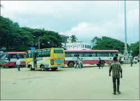
ಆದರೆ ಬಸ್ ನಿಲ್ದಾಣದಲ್ಲಿ ಮೂಲಸೌಲಭ್ಯಗಳ ಕೊರತೆಯಿಂದ ಪ್ರಯಾಣಿಕರು ನಲುಗಿದ್ದಾರೆ.

ಇಲ್ಲಿನ ಬಸ್ ನಿಲ್ದಾಣದಿಂದ ದಿನ ನಿತ್ಯ ನೂರಾರು ವಿದ್ಯಾರ್ಥಿಗಳು, ಉದ್ಯೋಗಿಗಳು, ಸಾರ್ವಜನಿಕರು ಬಸ್ ಸಂಚಾರವನ್ನು ಅವಲಂಬಿಸಿದ್ದಾರೆ. ಕಾಂಗ್ರೆಸ್ ಸರ್ಕಾರ 'ಶಕ್ತಿ' ಯೋಜನೆಯಡಿ ನೀಡಿರುವ ಮೆಟರ್ಯರಿಂಗ್ ಉಚಿತ ಬಸ್ ಸೌಲಭ್ಯದಿಂದ ಮೆಟಾ ಪ್ರಯಾಣಿಕರ ಸಂಖ್ಯೆ ಏರಿಕೆಯಾಗಿದೆ.