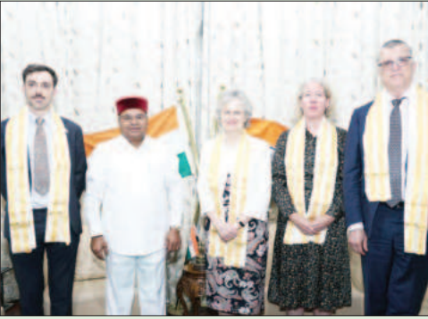
ದಕ್ಷಿಣ ಆಸ್ಟ್ರೇಲಿಯಾದ ಗವರ್ನರ್ ಗೌರವಾನ್ವಿತ ಫ್ರಾನ್ಸಿಸ್ ಆಡಮ್ಸ್ ಎಸಿ ಅವರು ಕರ್ನಾಟಕ ರಾಜ್ಯಪಾಲ ಗೌರವಾನ್ವಿತ ಫಾವರ್‌ಚಂದ್ ಗಡ್ಡೋಟ್ ಅವರನ್ನು ರಾಜಭವನದಲ್ಲಿ ಸ್ವಾಗತಿಸುತ್ತಿರುವುದು. ಭೇಟಿ ಮಾಡಿದರು.

ಬೆಂಗಳೂರು: ಚಾಮರಾಜೇಂದ್ರ ಮೃಗಾಲಯವು 12 ರಿಂದ 18 ವರ್ಷದೊಳಗಿನ ವಿದ್ಯಾರ್ಥಿಗಳಿಗೆ 33ನೇ ಯುವ ಸಂಘಟನೆಯನ್ನು ಆಯೋಜಿಸಲು ಉದ್ದೇಶಿಸಿದ್ದು, ಕಾರ್ಯಕ್ರಮವನ್ನು ಜುಲೈ 2025 ರಿಂದ ಜನವರಿ 2026 ರವರೆಗೆ 25 ಭಾನುವಾರಗಳಂದು ಬೆಳಿಗ್ಗೆ 10:00 ರಿಂದ ಮಧ್ಯಾಹ್ನ 1:00 ಗಂಟೆವರೆಗೆ ನಡೆಸಲಾಗುವುದು. ಮೊದಲು ಬಂದವರಿಗೆ ಮೊದಲ ಆದ್ಯತೆ ಆಧಾರದ ಮೇಲೆ 60 ಮಂದಿ ವಿದ್ಯಾರ್ಥಿಗಳನ್ನು ಮಾತ್ರ ಆಯ್ಕೆ ಮಾಡಲಾಗುವುದು. ಆಯ್ಕೆಯಾದ ವಿದ್ಯಾರ್ಥಿಗಳಿಗೆ ವನ್ಯಪ್ರಾಣಿಗಳ ವೈವಿಧ್ಯತೆ, ಸಂರಕ್ಷಣೆ ಹಾಗೂ ಮೃಗಾಲಯ ಪರಿಸರದಲ್ಲಿ ಅವುಗಳ ನಿರ್ವಹಣೆ, ಪ್ರಾಣಿ ವರ್ತನೆ ಅಧ್ಯಯನದ ಬಗ್ಗೆ ಕಾಲಕಾಲಕ್ಕೆ ತರಗತಿಗಳ ಮೂಲಕ ತಿಳಿಯಪಡಿಸಲಾಗುವುದು. ಆಸಕ್ತಿಯುಳ್ಳವರು ಜೂನ್ 25 ರಿಂದ ಜೂನ್ 28 ರವರೆಗೆ ಮೃಗಾಲಯದ ಕಛೇರಿಯಿಂದ ಅರ್ಜಿಯನ್ನು ಪಡೆದು ಭರ್ತಿ ಮಾಡಿ ಅರ್ಜಿಯನ್ನು ಕಚೇರಿಯ ವೆಳೆಯಲ್ಲಿ ಸಲ್ಲಿಸುವುದು. ಭರ್ತಿ ಮಾಡಿದ ಅರ್ಜಿಯೊಂದಿಗೆ ಪಾಸ್‌ಪೋರ್ಟ್‌ ಆಕೃತಿಯ ಇತ್ತೀಚಿನ ಭಾವಚಿತ್ರ, ವಯಸ್ಸಿನ ಪ್ರರಾಮಗಾಗಿ ಆಧಾರ್ ಕಾರ್ಡ್ ಅಥವಾ ಜನನ ಪ್ರಮಾಣ ಪತ್ರದ ನಕಲು ದಾಖಲಾತಿಗಳನ್ನು ಸಲ್ಲಿಸಬೇಕು. ಶಿಬಿರದ ಶುಲ್ಕ ರೂ. 2,500/- ಪಾವತಿಸಬೇಕು. ಭರ್ತಿ ಮಾಡಿದ ಅರ್ಜಿಯನ್ನು 2025 ನೇ ಜೂನ್ 28ರ ಸಂಜೆ 4:00 ಗಂಟೆಯೊಳಗಾಗಿ ಸಲ್ಲಿಸುವುದು. ಶಿಬಿರಕ್ಕೆ ಹಾಜರಾಗಲು ಆಯ್ಕೆಯಾದ ಸದಸ್ಯರಿಗೆ ಇ-ಮೇಲ್ ಮೂಲಕ ಸೂಚನೆ ಮತ್ತು ಹೆಚ್ಚಿನ ವಿವರಗಳನ್ನು ಕಳುಹಿಸಲಾಗುವುದು.