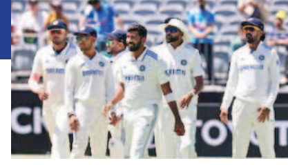
ಫೀಲ್ಡ್‌ಗೆ ಬರುವ ಮೊದಲು ಸಿದ್ಧತೆ ಮಾಡಿಕೊಂಡಿದ್ದಾರೆ ಎಂದು ನಾನು ಭಾವಿಸುವುದಿಲ್ಲ. ರೋಟೇಶನ್ ಅಥವಾ ವಿರಾಟ್ ಕೊಟ್ಟಿಲ್ಲ, ನಾಯಕರಾಗಿದ್ದಾಗ, ಅವರನ್ನು ನೋಡುವ ಮೂಲಕವೇ ಅವರು ನಾಯಕ ಎಂದು ತಿಳಿಯಬಹುದಿತ್ತು ಏಕೆಂದರೆ ಅವರು ತಂಡದ ಮೇಲೆ ಹಿಡಿತ ಸಾಧಿಸಿದ್ದರು. ಆದರೆ ಭಾರತ ತಂಡ ಅಡ್ಡಮಾಗ, ನಾನು ಇಬ್ಬರು ಅಥವಾ ಮೂವರು ನಾಯಕರನ್ನು ನೋಡಿದಂತೆ ಭಾಸವಾಯಿತು. ಈ ನಾಯಕತ್ವದಲ್ಲಿ ಸಾಮರ್ಥ್ಯ ಕಾಣಲಿಲ್ಲ. ಭಾರತ ತಂಡ ಸೋಲಲು ಮುಖ್ಯ ಕಾರಣವೆಂದರೆ ಅವರು ಕ್ಯಾಚ್‌ಗಳನ್ನು ಬಿಟ್ಟುಬಿಟ್ಟಿದ್ದು ಮತ್ತು ಲೋ ಆರ್ಡರ್ ಬ್ಯಾಟರ್‌ಗಳ ನಿರರ್ಲ ಪ್ರದರ್ಶನ ಎಂದು ಹೇಳಿದರು.

ಶುಭಮನ್ ಗಿಲ್ ಕೂಡ ಟೀಕೆಗೆ ಗುರಿಯಾಗಿದ್ದಾರೆ. ಭಾರತ ಕ್ರಿಕೆಟ್ ತಂಡ ಇಂಗ್ಲೆಂಡ್ ಪ್ರವಾಸಕ್ಕೆ ಗೊಂಡು 5 ಪಂದ್ಯಗಳ ಟೆಸ್ಟ್ ಸರಣಿಯನ್ನು ಆಡುತ್ತಿದೆ. ಲೀಡ್ಸ್ ನಲ್ಲಿ ನಡೆದ ಮೊದಲ ಟೆಸ್ಟ್ ಕ್ರಿಕೆಟ್ ಪಂದ್ಯದಲ್ಲಿ ಭಾರತ ತಂಡ 5 ವಿಕೆಟ್‌ಗಳಿಂದ ಸೋತಿದೆ. 371 ರನ್‌ಗಳ ಗುರಿಯನ್ನು ಬೆನ್ನಟ್ಟಿದ ಇಂಗ್ಲೆಂಡ್ ಉತ್ತಮವಾಗಿ ಬ್ಯಾಟಿಂಗ್ ಮಾಡಿ ಗುರಿಯನ್ನು ತಲುಪಿತು. ಭಾರತ ತಂಡದ ನಾಯಕನಾಗಿ ನೇಮಕಗೊಂಡ ಶುಭಮನ್ ಗಿಲ್, ಅವರ ನಾಯಕತ್ವದಲ್ಲಿ ಮೊದಲ ಪಂದ್ಯವನ್ನು ಸೋತರು. ಇಂಗ್ಲೆಂಡ್‌ನ ಮಾಜಿ ಆಟಗಾರ ಮತ್ತು ಕ್ರಿಕೆಟ್ ನಿರೂಪಕ ನಾಸೀರ್ ಹುಸೇನ್ ಈ ಬಗ್ಗೆ ಸಂದರ್ಶನವೊಂದರಲ್ಲಿ ಹೀಗೆ ಹೇಳಿದರು. ಟೆಸ್ಟ್ ಕ್ರಿಕೆಟ್‌ನಲ್ಲಿ ರೋಟೇಶನ್ ಶರ್ಮಾ ಮತ್ತು ಏರಾಟ್ ಕೊಟ್ಟಿಲ್ಲ ಇದ್ದಂತಹ ವ್ಯಕ್ತಿತ್ವ ಗಿಲ್‌ರಲ್ಲಿ ನನಗೆ ಕಾಣುತ್ತಿಲ್ಲ. ಅವರು ಪ್ರತಿ ಬೆಂಡಿಗೂ ಪ್ರತಿಕ್ರಿಯಿಸುತ್ತಾರೆ. ಮಾತ್ರವಲ್ಲ, ಅವರು ಅಡ್ಡಾನ್ಯ್ ಆಗಿ ನಿರ್ಧಾರಗಳನ್ನು ತೆಗೆದುಕೊಳ್ಳುತ್ತಿದ್ದಾರೆ. ಹಾಗೂ